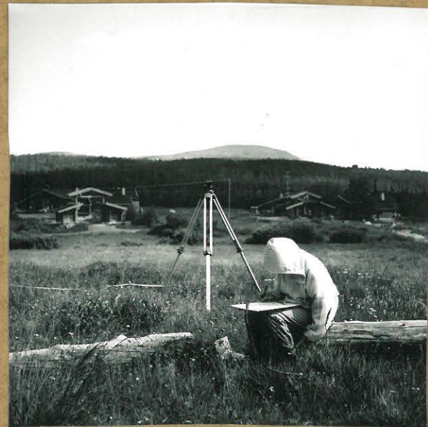
76695. PIIRTÄJÄ BEATRICE SOHLSTRÖM PIIRTÄMÄSSÄ YLEISKARTTAA.