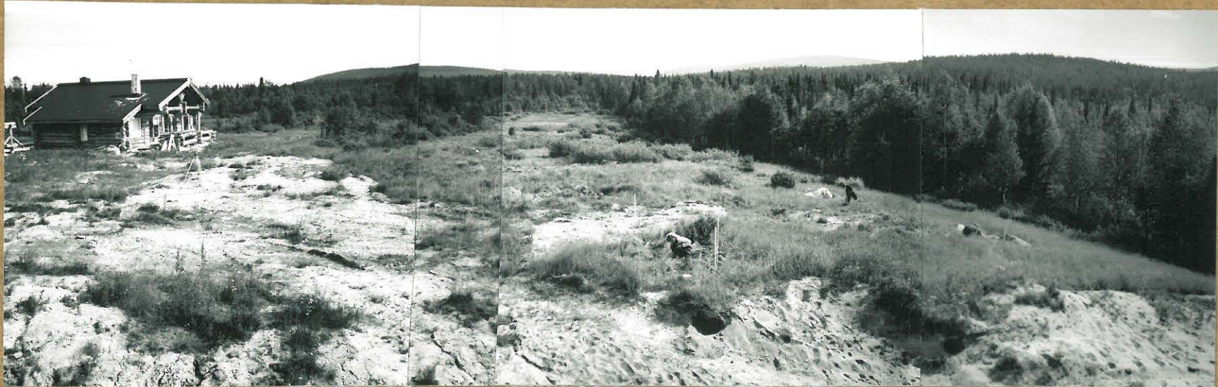
76691-94. YLEISKUVA TUTKIMUSALUESTA. OIKEALLA TÖRMÄN REUNALLA KAIUVAAT TYÖSSÄ. KUVATTU LÄNNESTÄ ITÄÄN.