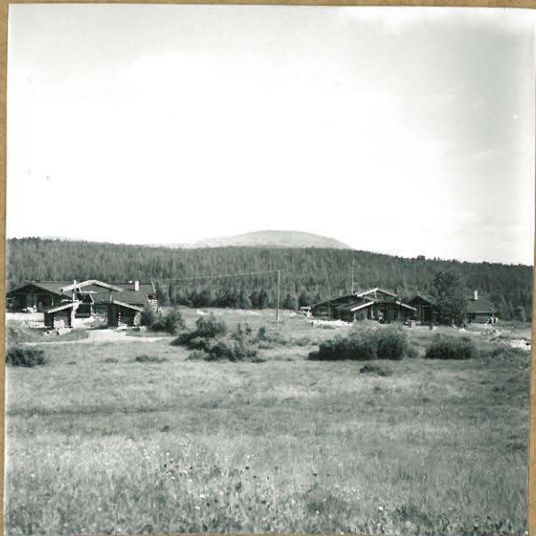
76696. YLEISKUVA RIEMURITIERIN EDUSTALTA ITÄÄN. TUTKIMUSALUE HUULOIDEN JÄLISSÄ TÖRMÄN REUNALLA.