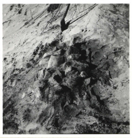
Kuiva 3. F. 22745