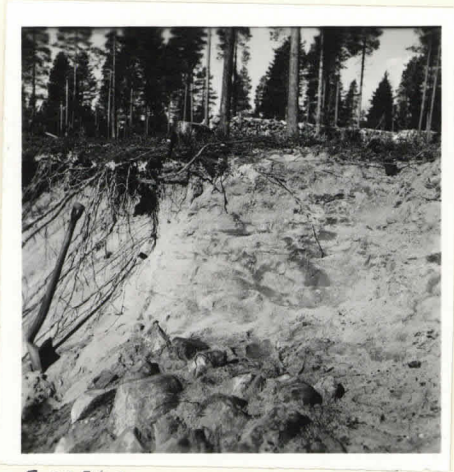
Kuiva 6. F. 22748