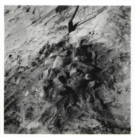
Kuiva 4. F. 22746