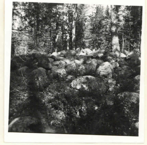
Kuiva 7. Kuiva niemi, Näsran karju. - Lapinpaunio. V. Luks 1958.