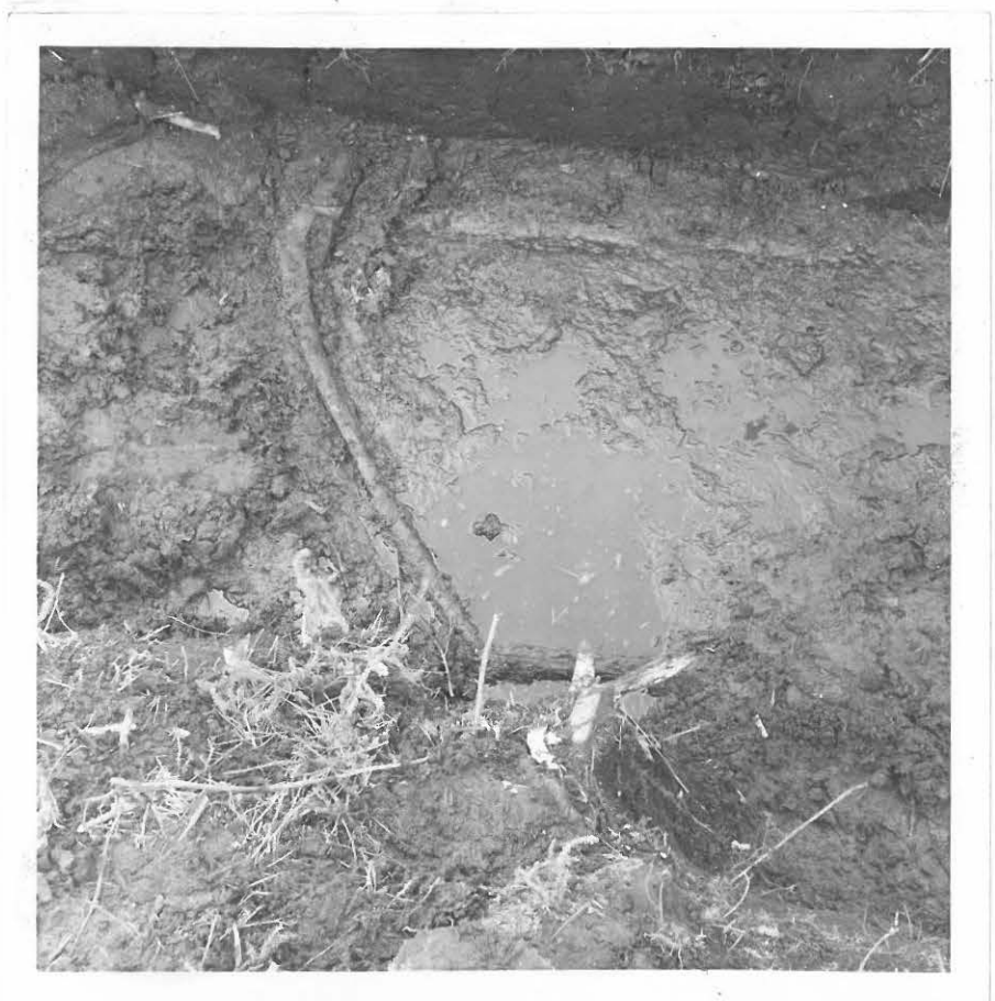
4. Satak. mus. neg 18040 Peräpuu läheltä, kaustat poistettu.