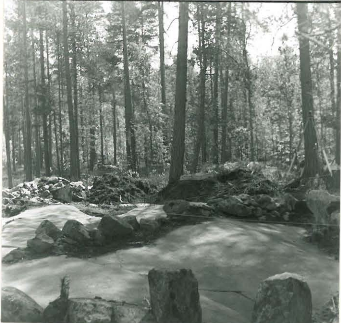
PROFILI ENNEN PURKAMISTA JA PIIRTÄMISTÄ KAAKOSTA.