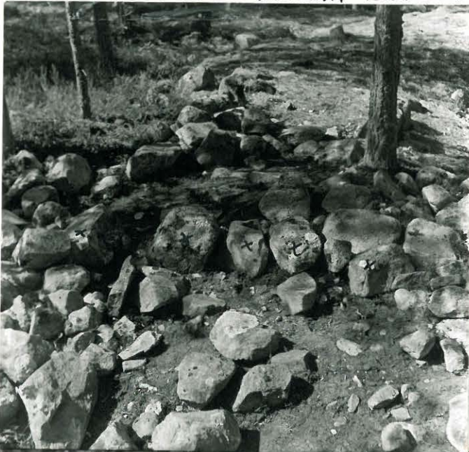
MAHDOLLISESTI ALKUPERÄISELLÄ PAI- KALLA OLEVAT LIVET MERKITY RISTEIN.