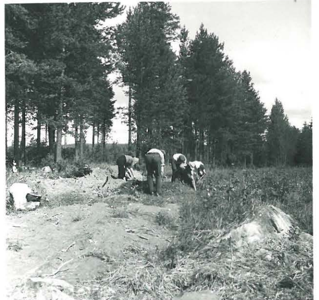
Kuva 4. Kurikka, Syväoja, kuivamäki, kuivatus alkuvaiheessa, kuvattu muennilleen lounaasta. F. 33335