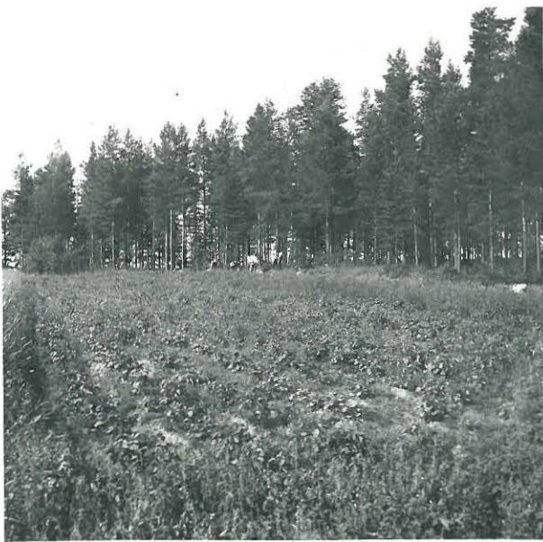
Kuva 3. Kurikka, Syväoja, kuivamäki. F. 33334