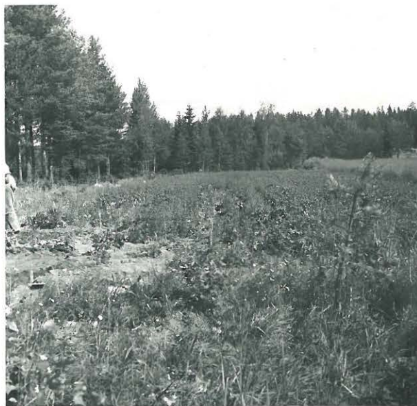
Kuva 7. Kurikka, Syvänoja, Kuivamäki Rumppaikkaa launoista nähtynä. - F. 33338