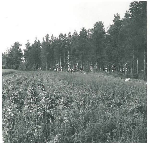
Kuva 2. Kurikka, Syväoja, kuivamäki, F. 33333