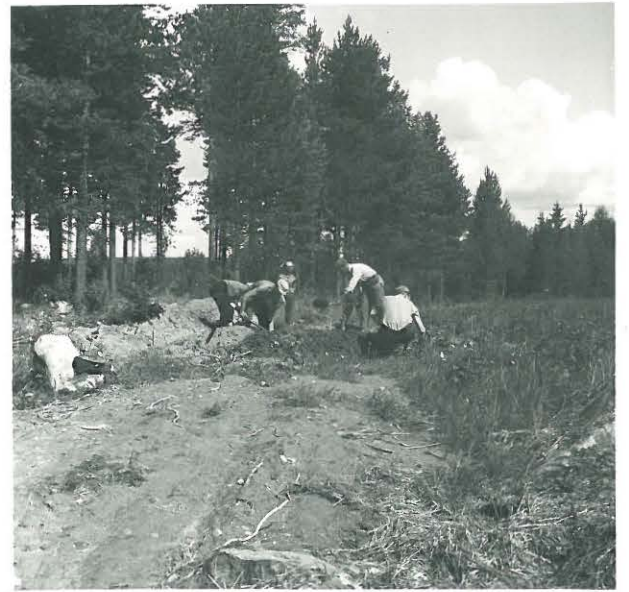
Kuva 6. Kurikka, Syvänoja, Kuivamäki kairaus launoista. F. 33337