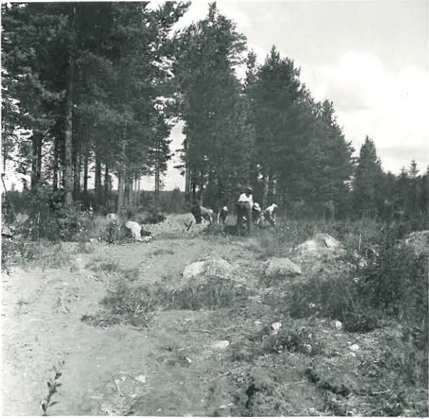
Kuva 5. Kurikka, Syvänoja, Kuivamäki kairaus launoista. F. 33336