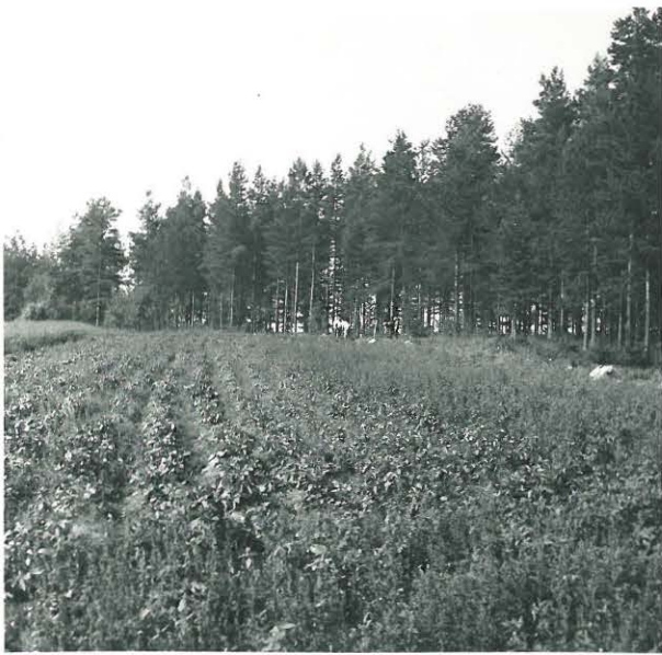
Kuva 1. Kurikka, Syväoja, kuivamäki, kuvattu muennilleen ilästä. F. 33332