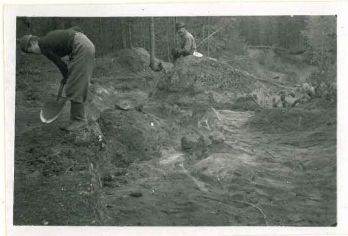
Vilho ammuksipaikan kaivaus luoteesta