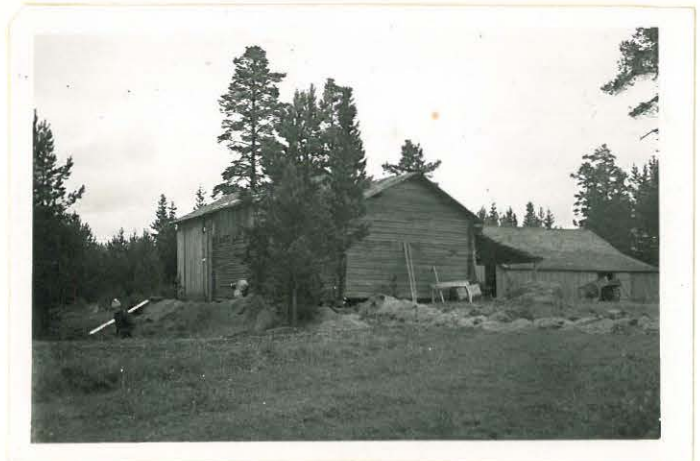
Niikkarin I:n kaivaus lounaasta