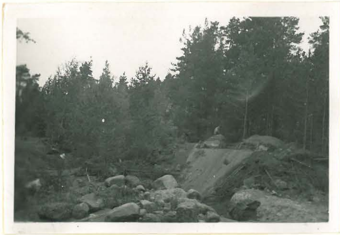
Vilho ammuksipaikka lounaasta.

Vyperi Ullasvuoni, Vilho ja Niikkarin ammuksipaikat.