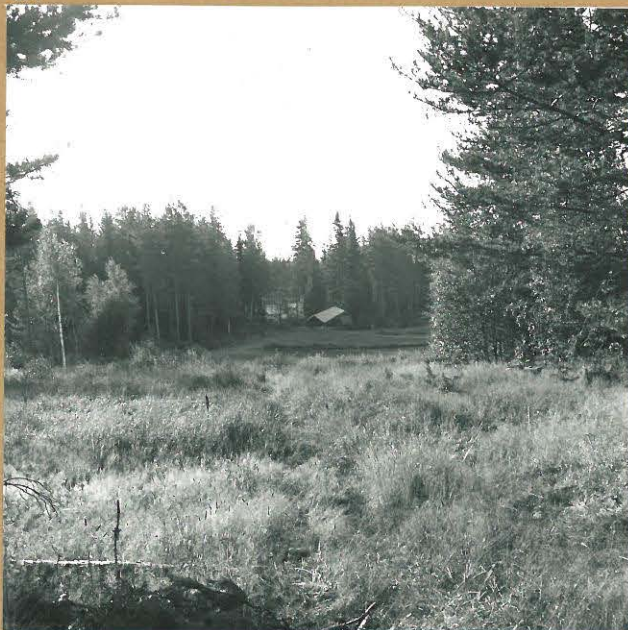
f. 56207 JÄRVELÄNKANGAS 1. PELTOAUKEA KOHTEEN ITÄPUOLELLA. OIKEALLA LINJA 28-32. NW-SE.