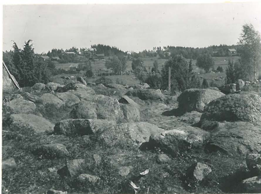
9. Savemäki. Neliskulmainen latomus kairattuna. Kuva NW:stä päin. ↑ kohdalla ruumishaudan paikka. L. 33507