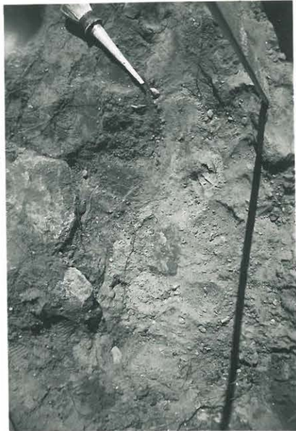
25. Ruumishaudan paikka latomuksessa. Valok. NW:stä.