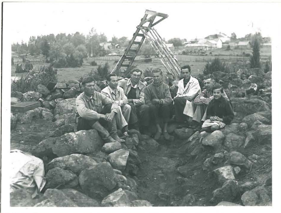
13. Savemäki. Kaivajat pyöreän röykkiön "ruumishautakuopan" reunalla. 33511