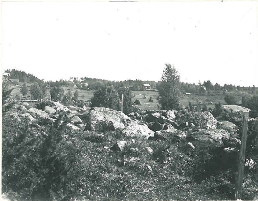
1. Savemäki. Nelisk. latomus NO:sta. L. 33499