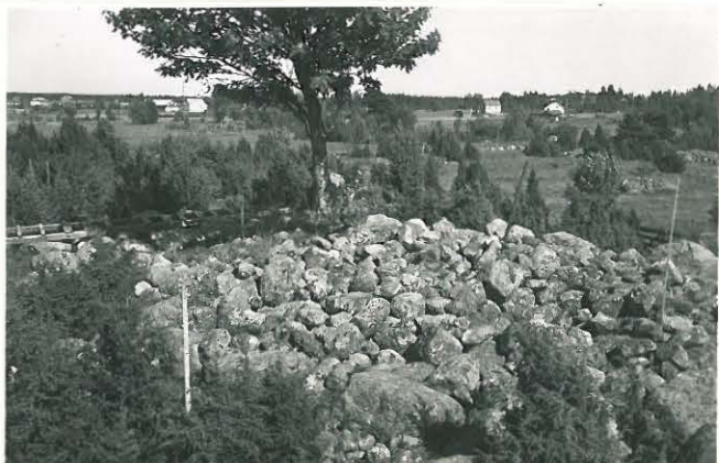
16. Sama lähempää. F. 33513.