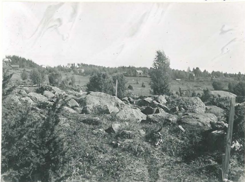
3. Savemäki. Neliskulm. latomus paljoi- tettuna. Kuva NO:sta. L. 33501. Ella Kirikoski 1955.