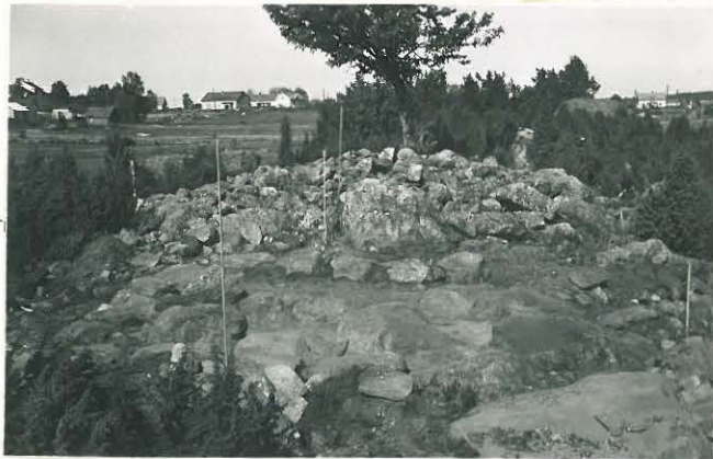
15. Savemäen pyöreä röykkiö ennen kaivautta. Valok. SW:stä päin.