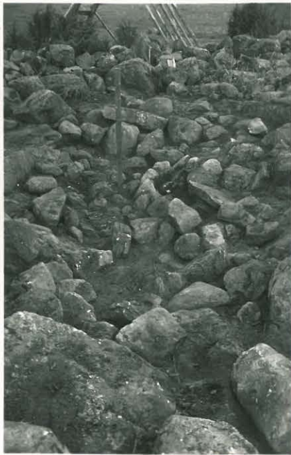
18. Pyöreän röykkiön ruumishautakuoppa. F. 33515