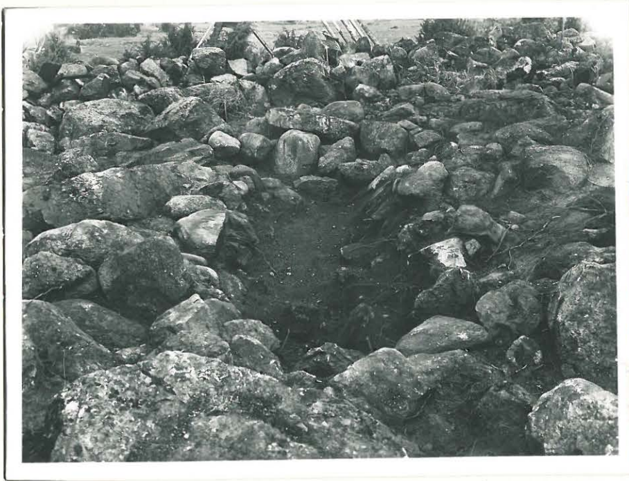
14. Savemäki. „Ruumishaudan” paikalla pyöreässä röykkiössä. Valok. N:stä päiv. L. 33512