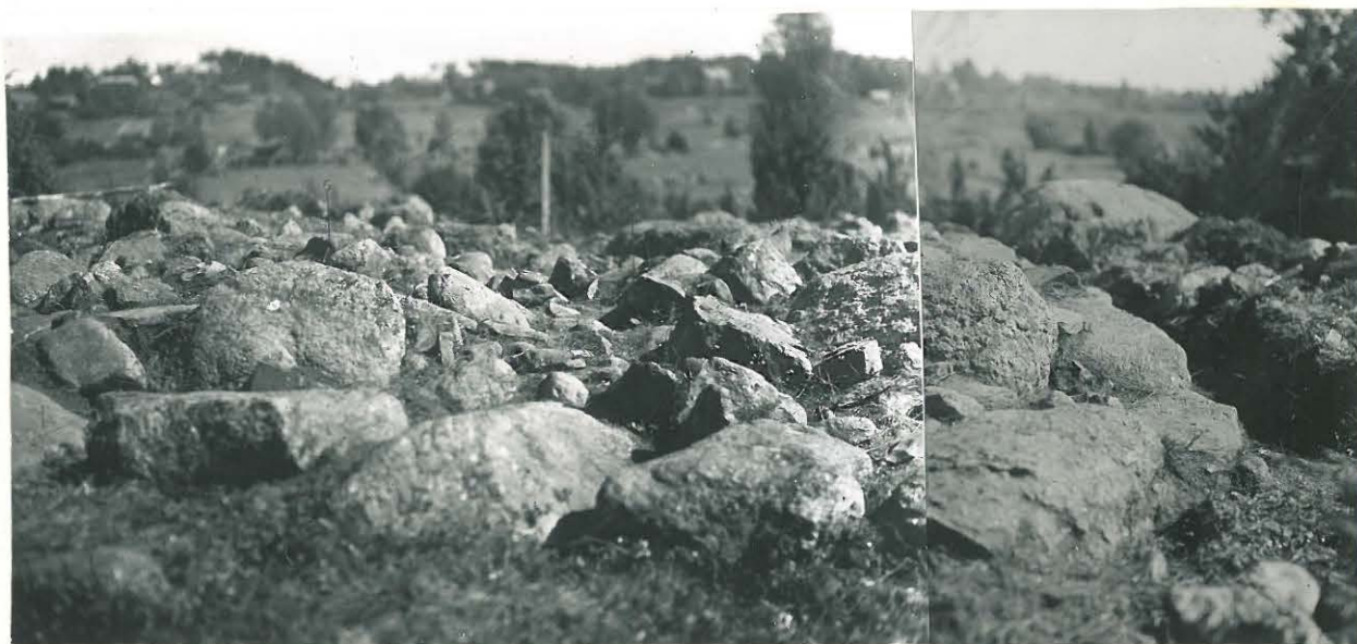
7-8 Laitila, Savemäki. Neliskulmainen latomus paljastettuna turpeesta ja maasta. Valok. NW:stä päin. L. 33505/6