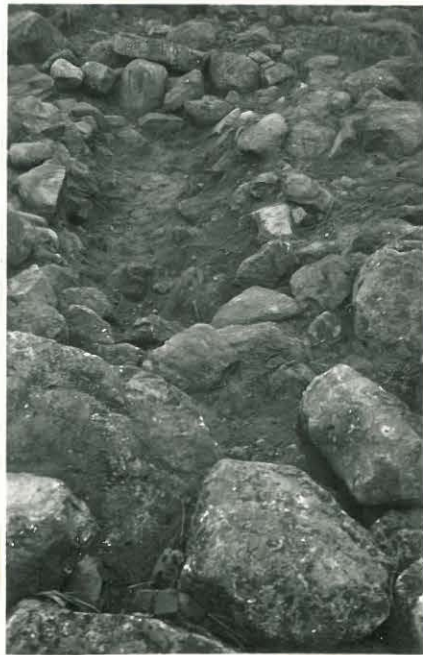
19. Sama aivan röhjällä. F. 33516