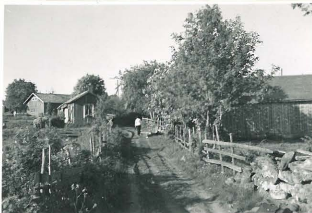
29. Kylätie kaivauspaikalta kylään. F. 33524.