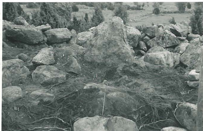
23. Saviastianpalojen löytöpaikka latomuksen reunassa Q 4. F. 33520