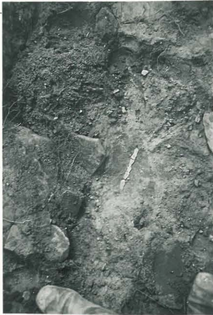
24. Rautaesineen jäännös latomukseen ruumis- haudassa. Valok. NW:stä F. 33521.