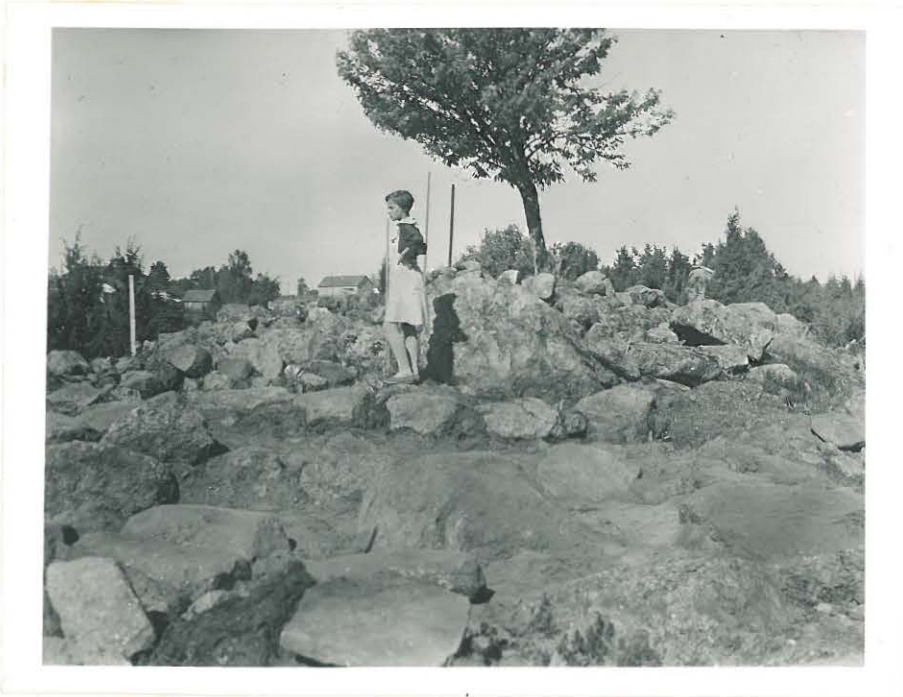
12. Laitila, Savemäki. Pyöreä röykkiö ennen kaivausta. Valok. SW:stä päin L. 33510