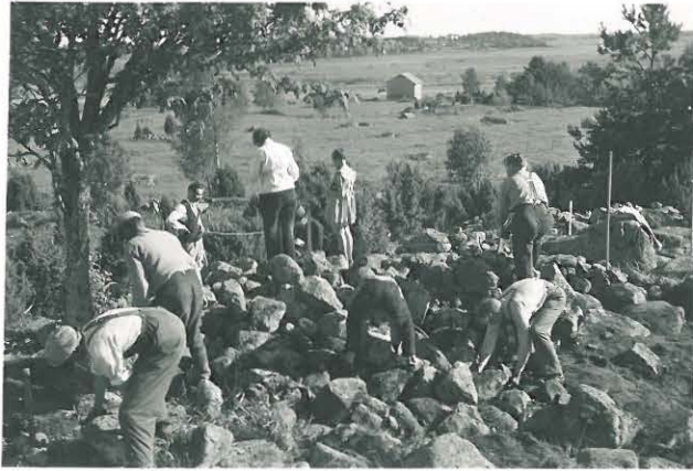
27. Pyöreän louhkeion kaivaustyö käynnissä. F. 33523.