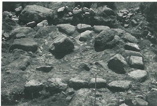
21. Latomuksen NW osan valokuvattuna NO:sta päin. F. 33518.