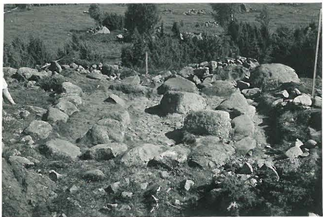
20. Heinäkivikentän latomus kairauksen jälkeä. Kuva NW:stä päin. Kesellä edestä ruumishaudan paikka. F. 33517.