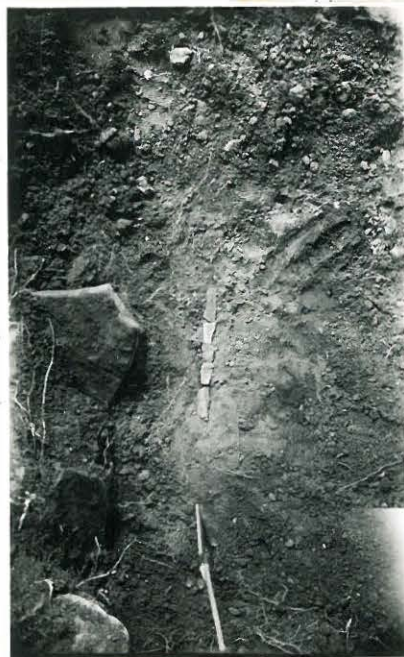
26. Sama kuva kuin 24, mutta lähempää. F. 33522.