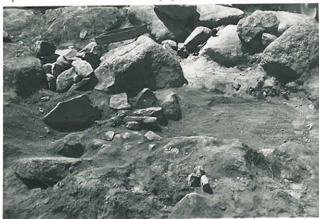
22. Hiokkakiivilaakkoja rykelmässä. Ruumishaudan jalkopää. Valok. N:stä päin. F. 33519