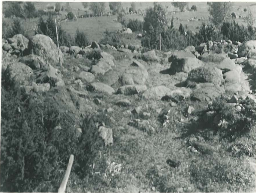
2. Savemäki. Neliskulm. latomus kivistuna. Ulosta. NO:sta. L. 33500