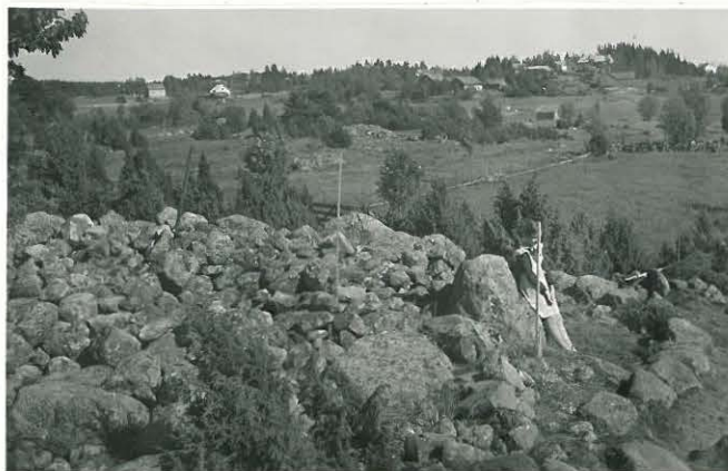
17. Savemäen pyöreän röykkiön S-osa. Valok. W:stä päin. F. 33514