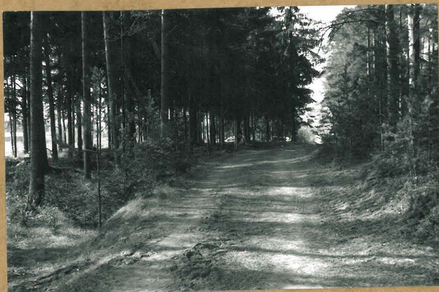
F. 100737. KOTASAAREN HALKI MENEVÄ METSÄTIE, KUV. POHJOISESTA.