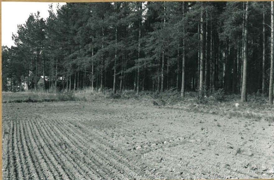
F. 100738. KAIVAUSALUETTA LADON PÖRJÖISPUOLELLA, KUV. KOILLISESTA.