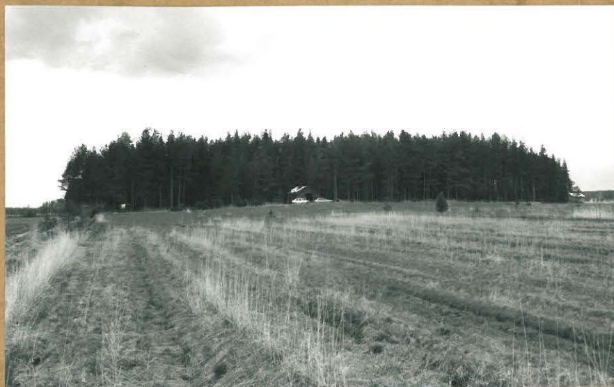
F. 100734. KOTASAARENMÄKI, KUV. KAAKOSTA