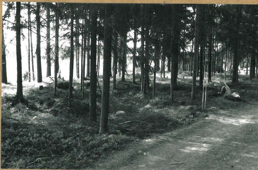
F. 100738 KAIVAUSALUETTA LADON PÖHJÖISPUOLELLA, KUV. LUOTEESTA.