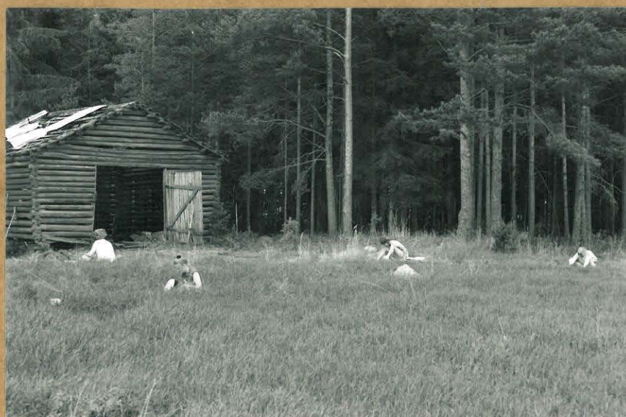
F. 100735. KAIVAUSSALUETTA LADON LUONA, KUV. KAAKOSTA