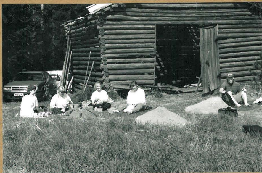
F. 100740. ILOISET KAIVAJAT TAUOLLÄ.