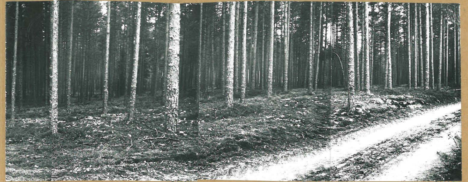
HIEKKAKUOPAN LÄNSIPUOLISTA HARJUA. KUVATTU LUOTTEESTA - 10ÄSTÄ.