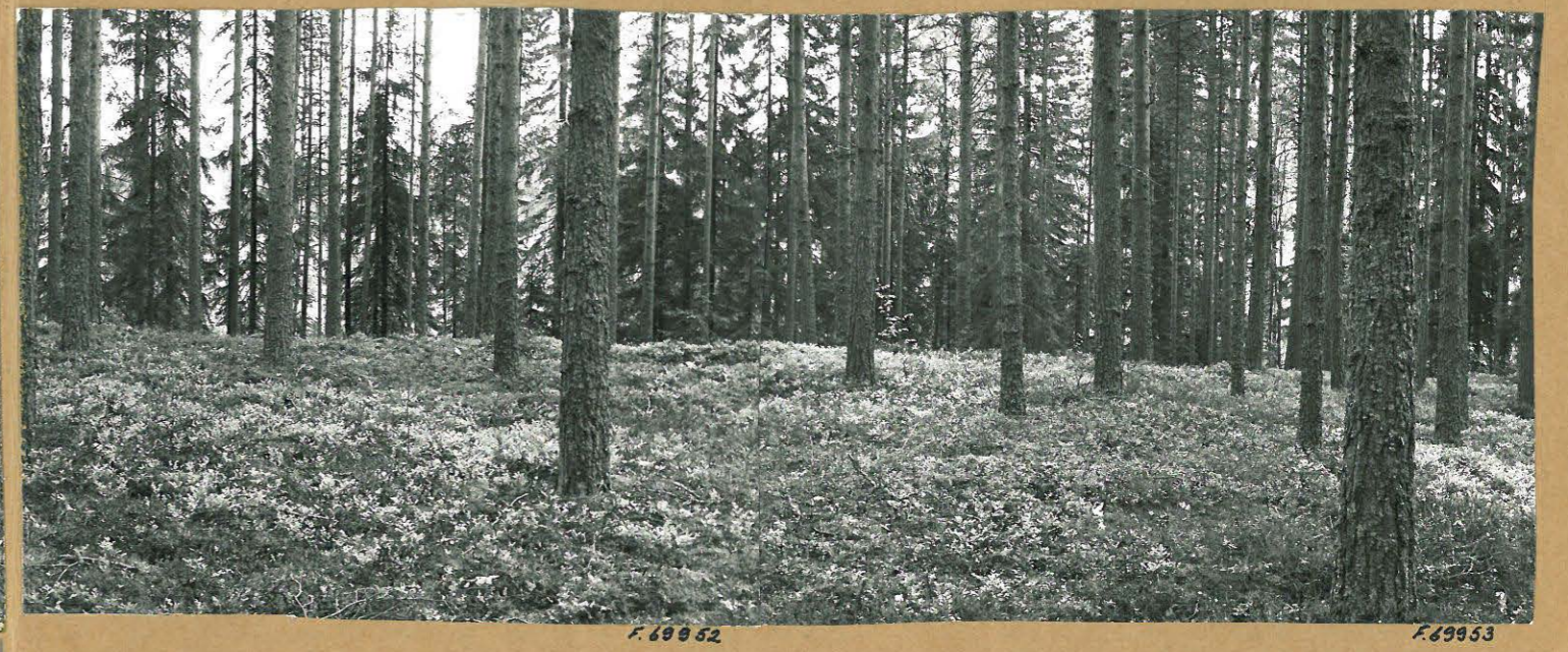
KUVA 5: MAISEMAKUVA NIEMEKKEEN PÄÄNDRINTEESTÄ, KUVATTU ETELÄSTÄ. OIKEALLA LAAJEA PAINANNE.