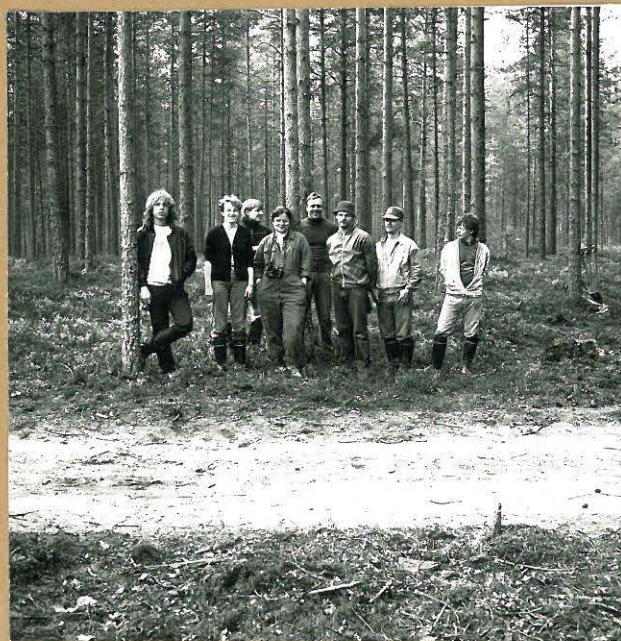
Kuva 13: Kuopanne 3. Kuvattu kaakosta.