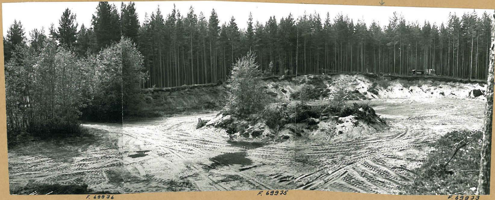
Kuva 2: Maisemakuva tutkimusalueesta. Mirja Miettisen tutkimin punamultahaudan sijainti merkitty kuvaan nuolella. Kuvattu idästä.