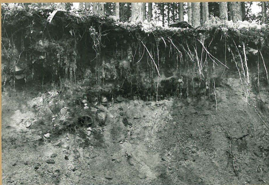
Kuva 8: Pohjoisempi edellä mainituista liesistä. Kuvattu lännestä.