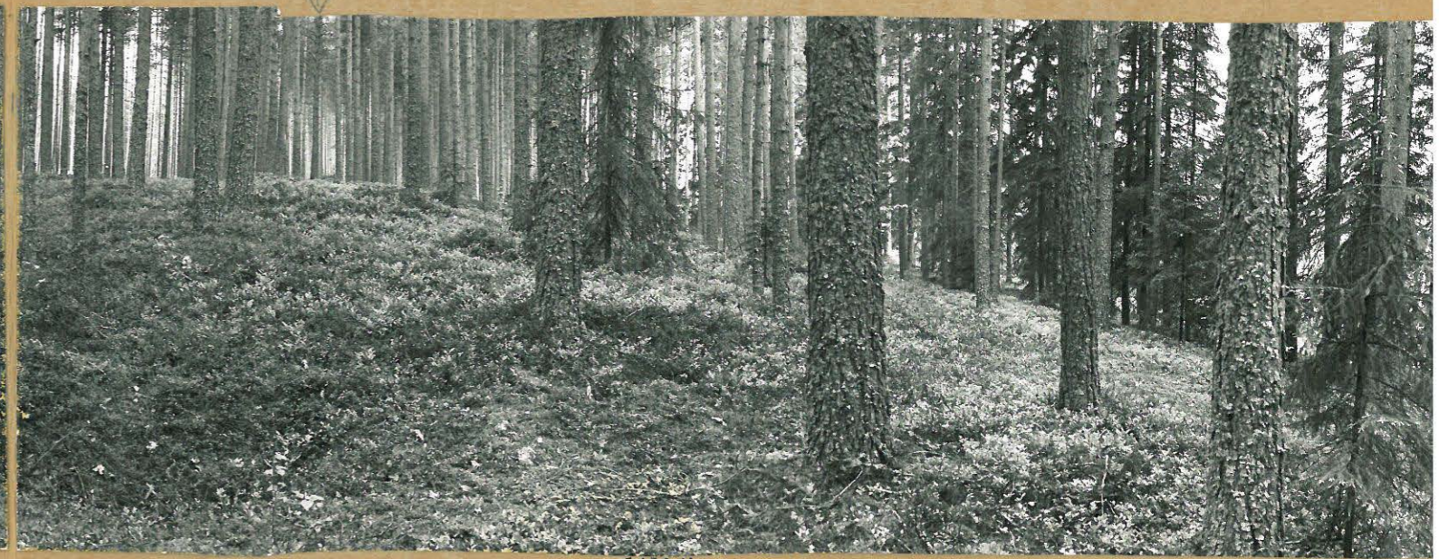
KUVA 4: MAISEMAKUVA NIEMEKKEEN LÄRJESTÄ, KUVATTU ITÄKAAROSTA. PAINANTEITA EDESSÄ KESKEILLÄ.