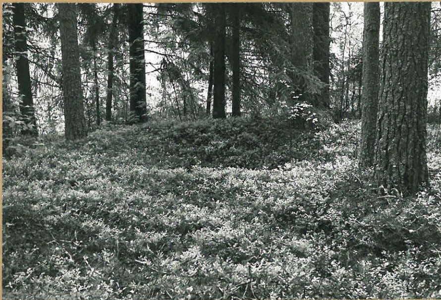
Kuva 10: Laaja kodanpohjapainanne (kuopanne 1) asuinpaikan itäosassa, niemellä Sahijoen länsipuolella. Kuvattu idästä.