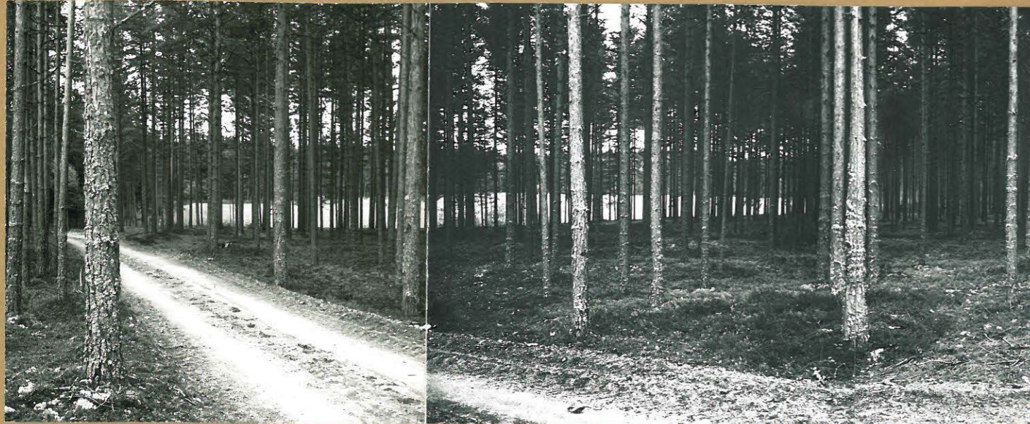
KUVA 3: MAISEMAKUVIA TUTKIMUSALUESTA. KUVASSA ALUEELLA OLEVAN SUUREN