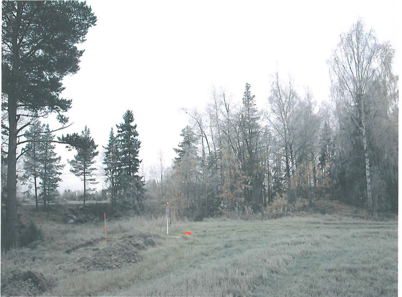
Yleiskuva koekuoppien 1-4 alueesta. Vasemmalla oleva linjakeppi on kk 4:n, oikealla taustalla kk 3:n kohdalla. Pohjoiskoillisesta.