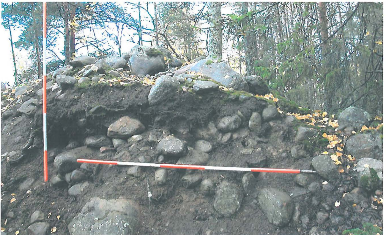
Hiekkakuopan W-profilia. Pystyssä oleva linjakeppi on pisteen "A" kohdalla. Koillisesta.