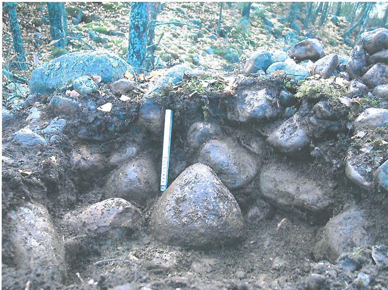
Koekuoppa 3. S-profiili. Pohjoisesta.