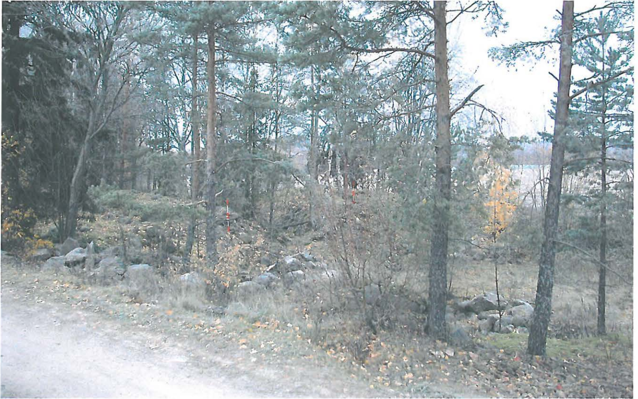
Yleiskuva alueesta, jolta on löytynyt merkkejä polttokalmistosta. Vasemmalla oleva linjakeppi on pisteen "A" kohdalla, oikealla taustalla kk 3:n kohdalla. Kaakosta.

mahdollisesti säilynyt koekuoppa 3:n kohdalla olevalla kumpareella sekä siitä länteen ja luoteeseen.