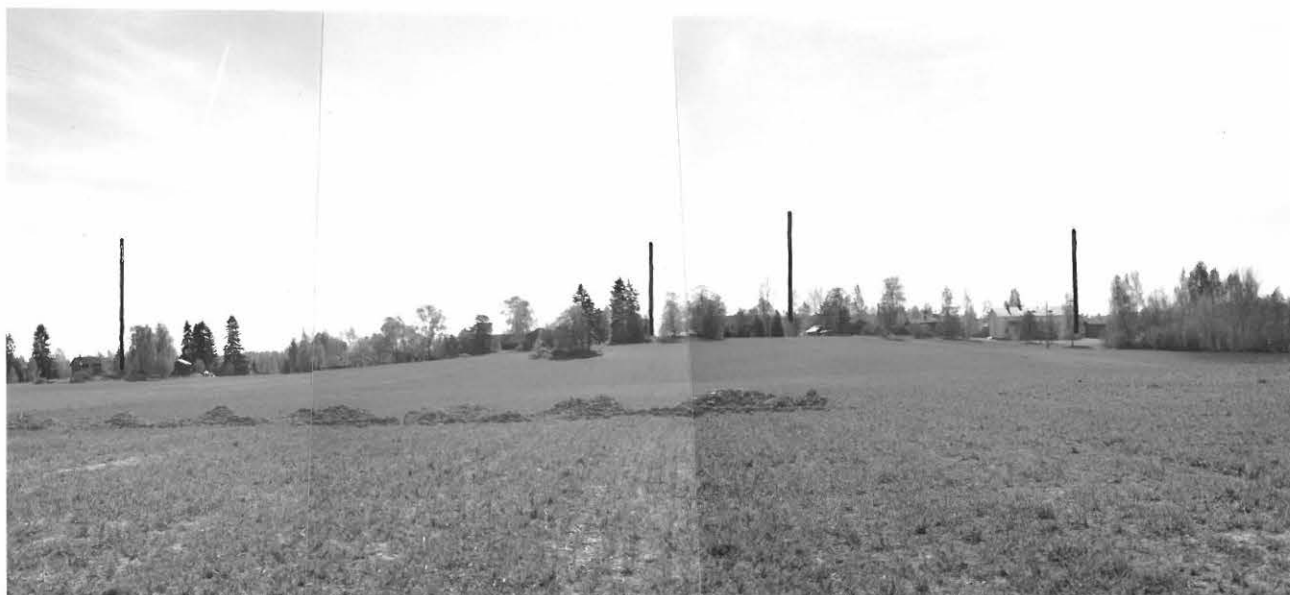
F. 117055-57 Mottisen tilan eteläosaa, vas. ns-talo ja vasemmalla nurussa näkyvän tumman aitan edessä kuppikivi porrasakiverä, kiveillä peltosaarekkeen takaisella kukkulalla pottokeräkaluuninto, josta vieressä oikealla ajettamatonä, mutta mahd. eihistoriallisia rakenteita; vasemmalla teurassa Mottisen niemen juressa pottokeräkaluuninto, kvattu peltosaarekkeen keskivaiheilta, pohjoisesta