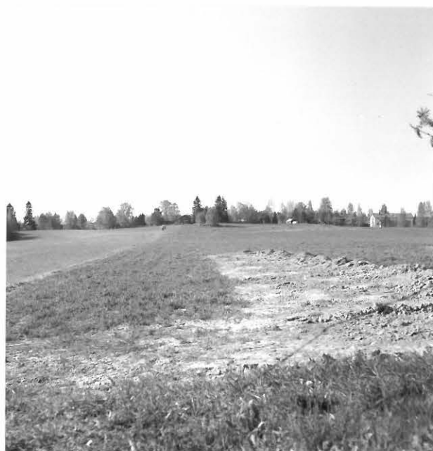
F. 117058 Mottisen tilan keski- ja eteläosaa, oike. ns-talo kvattu pohjoisimmasta peltosaarekkeesta, pohjoisesta