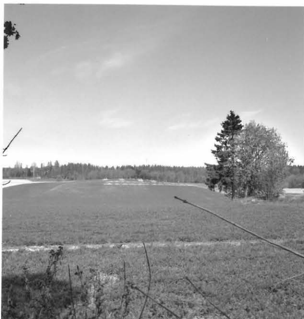
F. 117054 Mottisen tilan pohjoispääty taustalla kivet kvattu nihi saarekkeesta etelästä