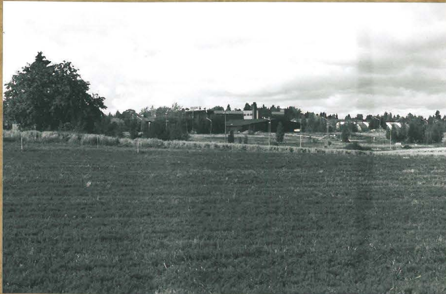
F. 111052 TUTKIMUSALUETTA KUMINAPELLOLLA. KUV. IDÄSTÄ.