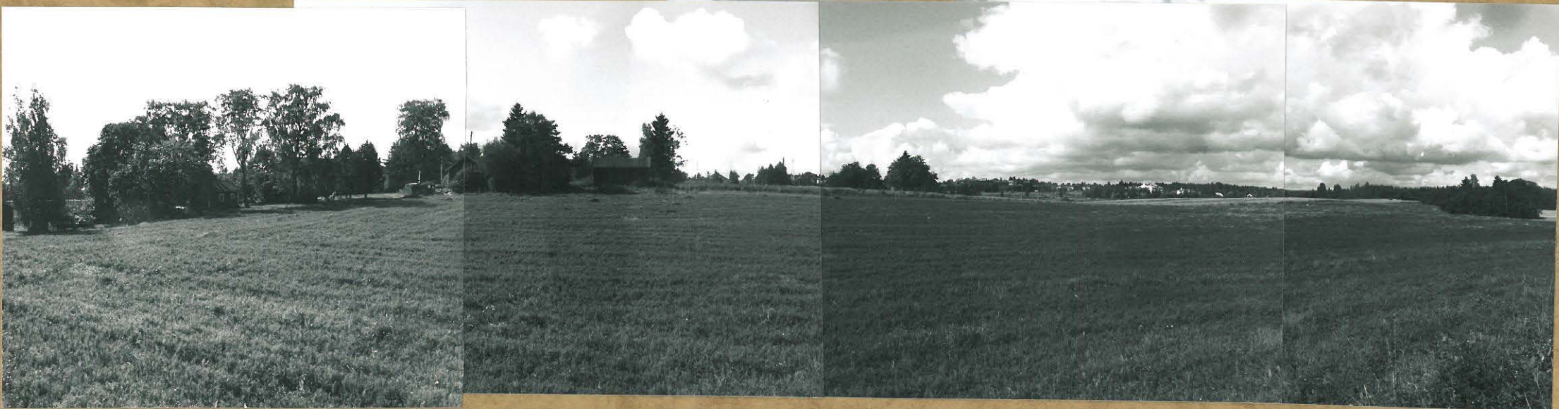
F. 111053 - 56 PANORAAMA TUTKIMUSALUEESTA. KUV. IDÄSTÄ.