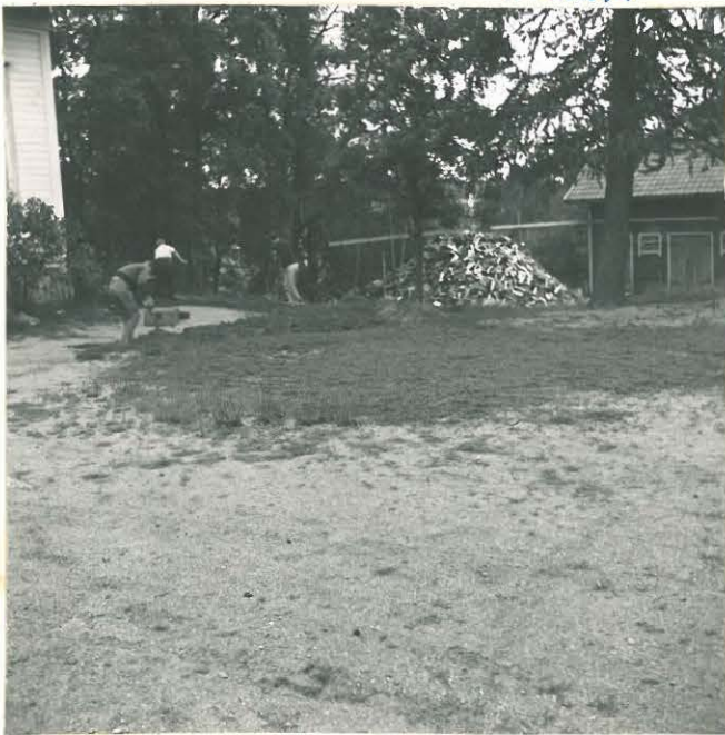
Koecia luoetaan umpien kalmiston itä-koillis puolella.