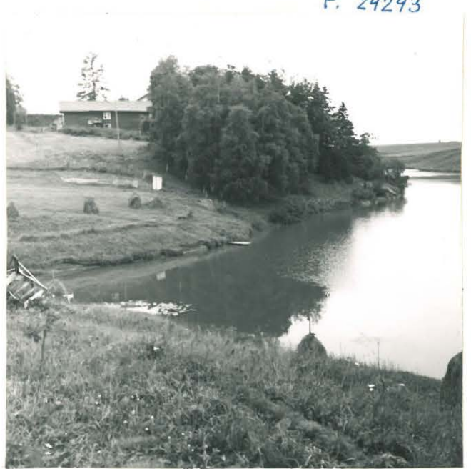
Kukonharjun kalmisto kuvattuna Savijoen ja Aurajoen välissä oltavalla niemekkeeltä,