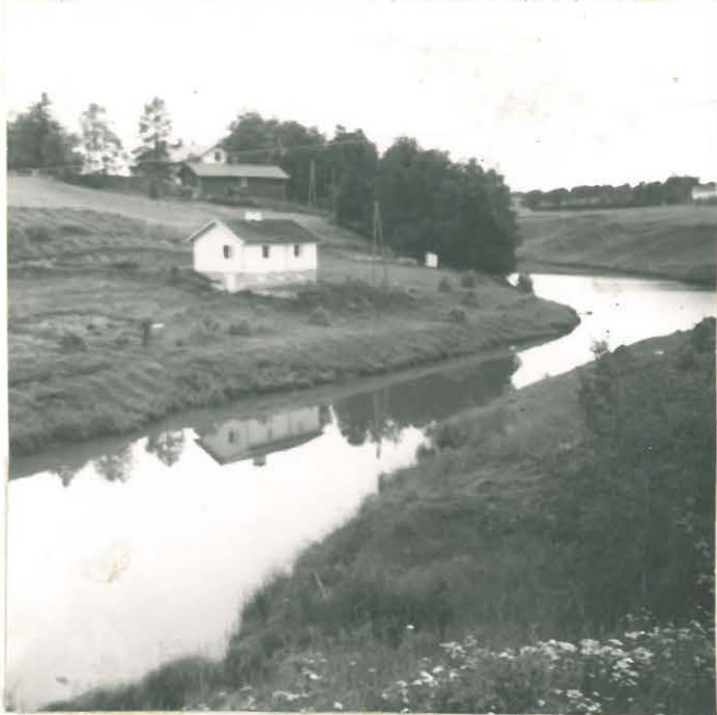
Loukimaisten Kukonharjun kalmistokom- pleksi kuvattu Savijoen N puolelta.