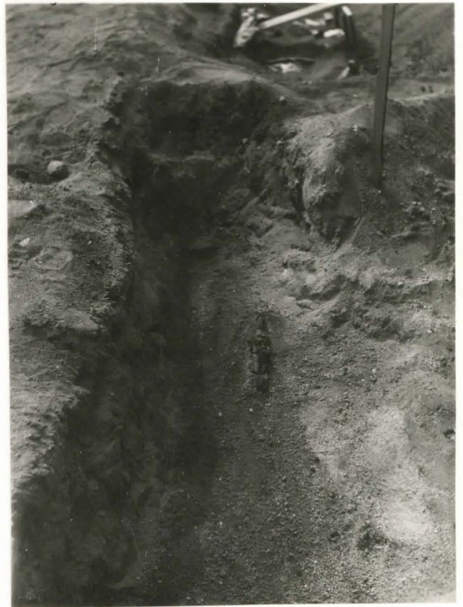
35. Hauta 51. Valok idästä F 42 507