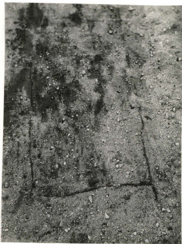
41. Hauta 68. Arken ään- nivoat ja kädensijat sel- västi näkyvissä F 42513