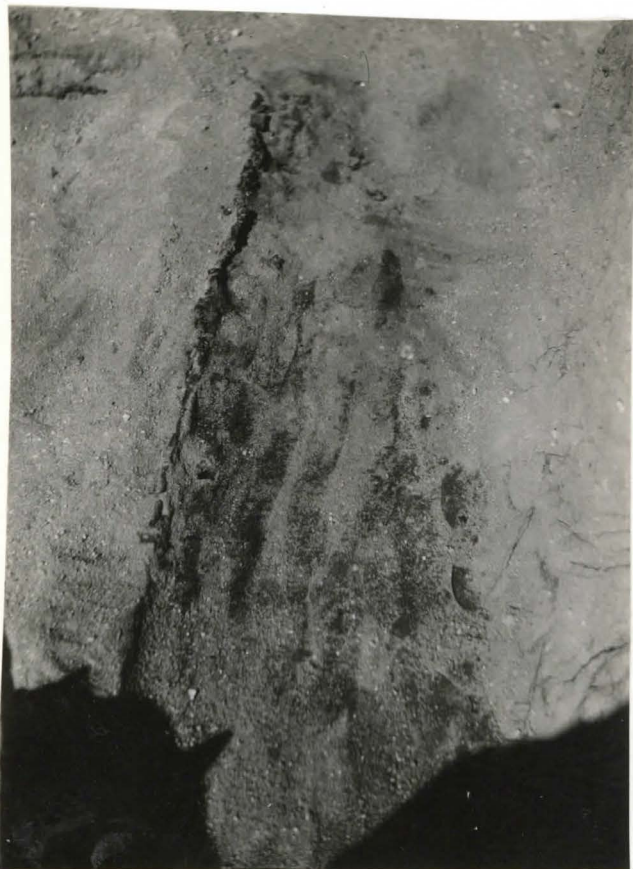
43. Hauta 73. Häute- maassa runsaasti hiiltä. F 42515