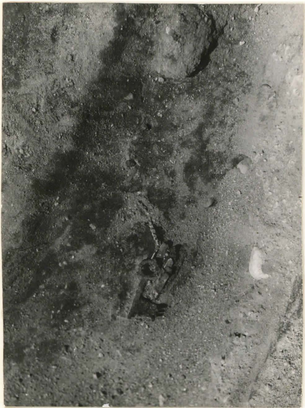
37. Hauta 56, kuvattu idästä. F 42509