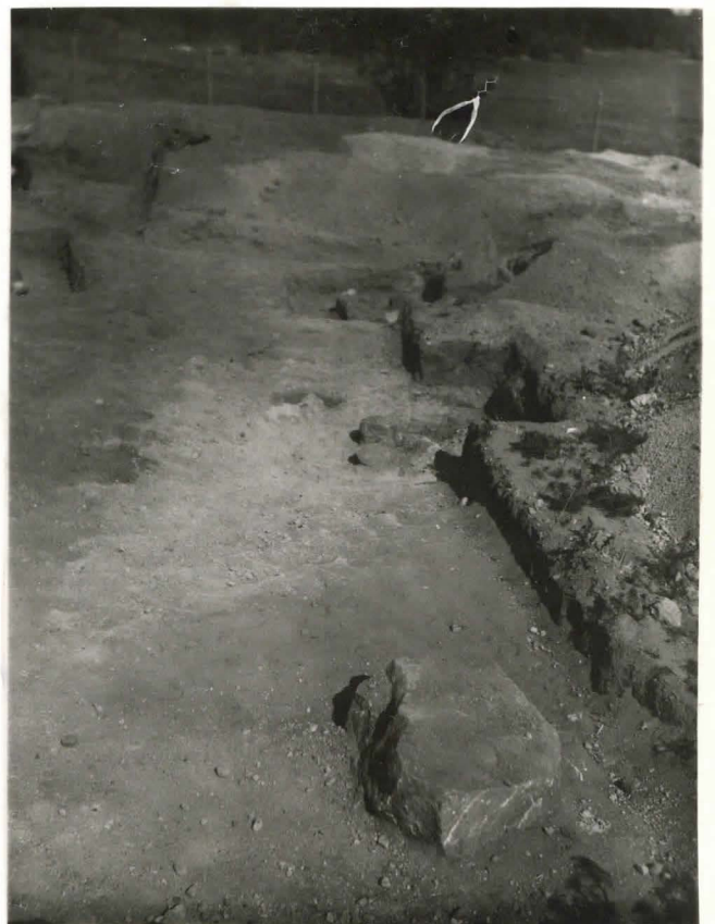
18. Rakennuksen perustuk- sen eteläsivun (latomuk- set VII, VI ja V.) F 42491