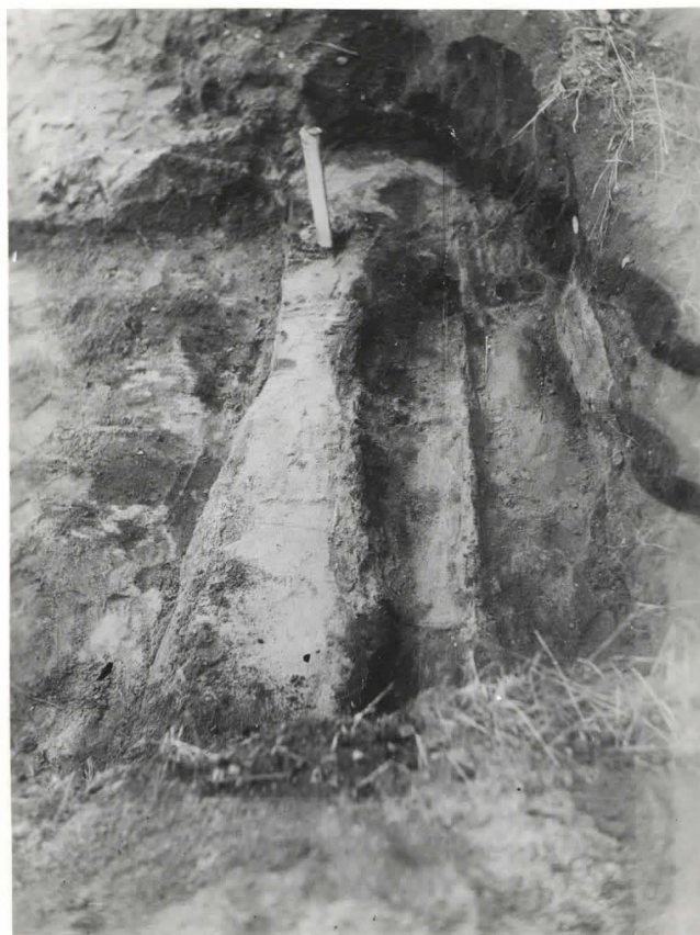
48. Hauta 86, valok. idästä F 42520