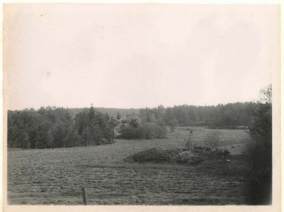
2 Ristinpelto lounaasta katsottuna F42475