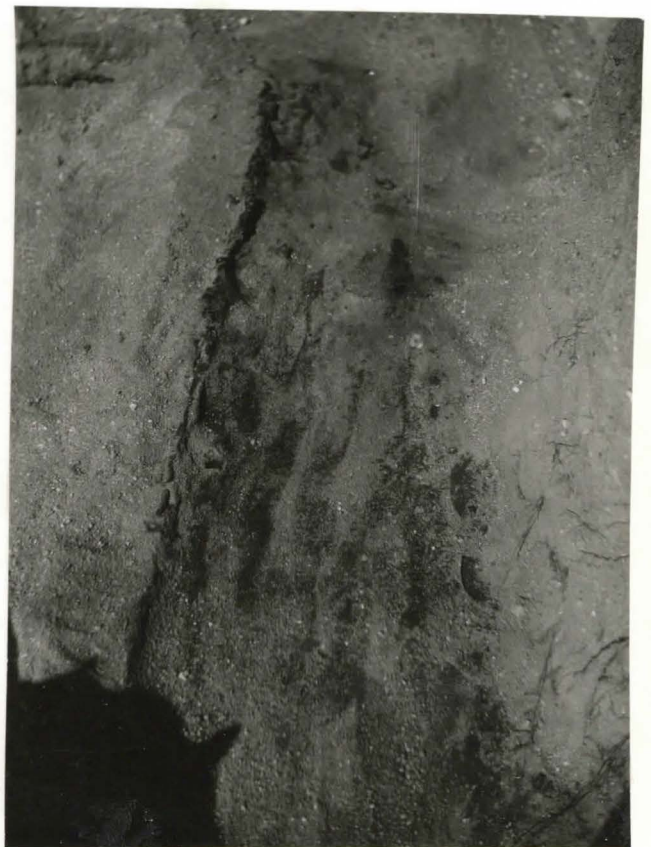
44. Hauta 73. Valok. idästä. F 42516