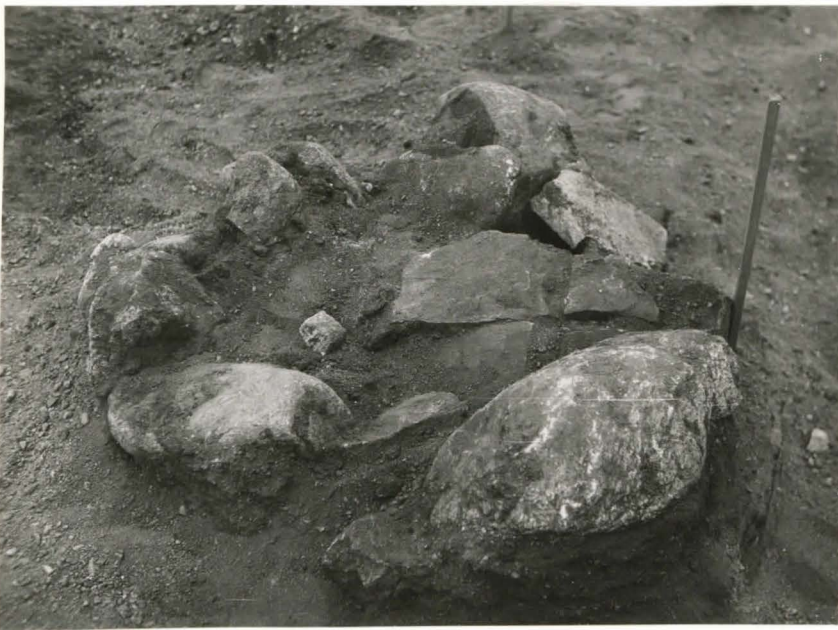
20 Rakennuksen pe- rustukseen kuulu- va kivilatomus IV F 42493