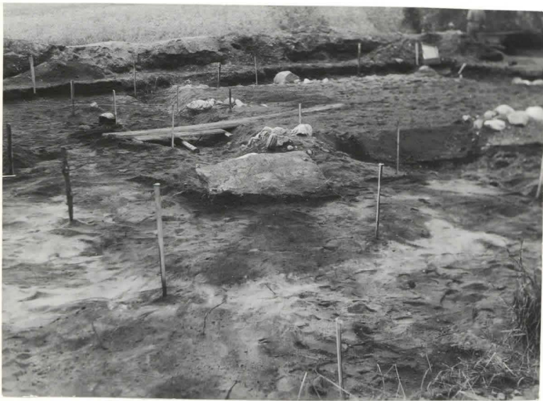
16. Rakennuksen perustus NW-suunnasta. F 42489