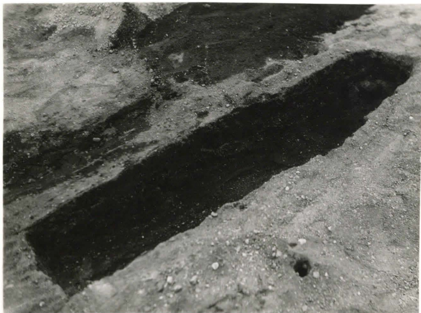
39. Hauta 68. Tummaa hiilensikaista täytettä. F 42511