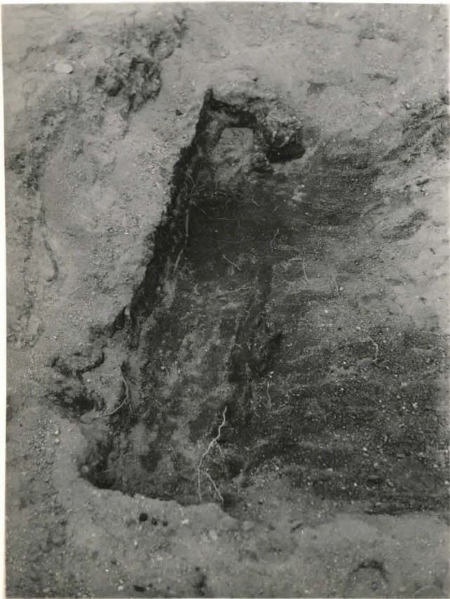
34. Hauta 35. valok. idästä F 42 506