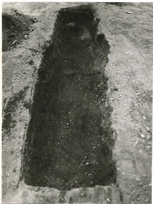
40. Hauta 68. Tummaa hiilensikaista täytettä F 42512