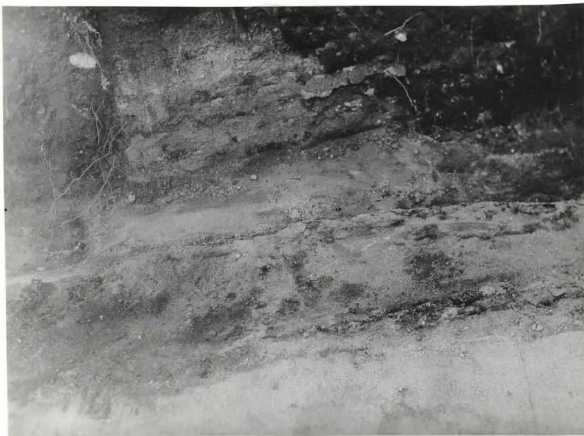
49. Hauta 86, valok. etelästä F. 42521