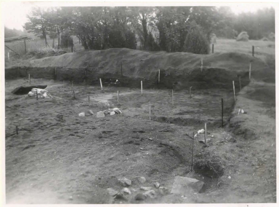
Lieto. Sawala 10. Ristin Delto

Dakennuksen perus- tukseen kuuluvat kivilatomukset III-VI F 42483