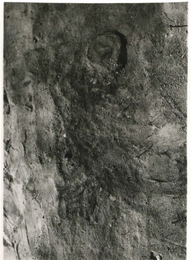
38. Hauta 63, kuvattu idästä. F 42510