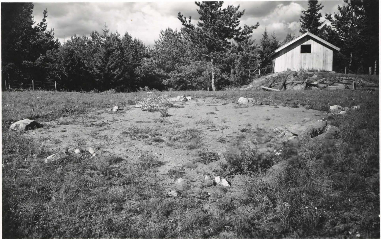
22. Rakennuksen perustus SO-kulmasta valokuvattu. Turku 10.9.51