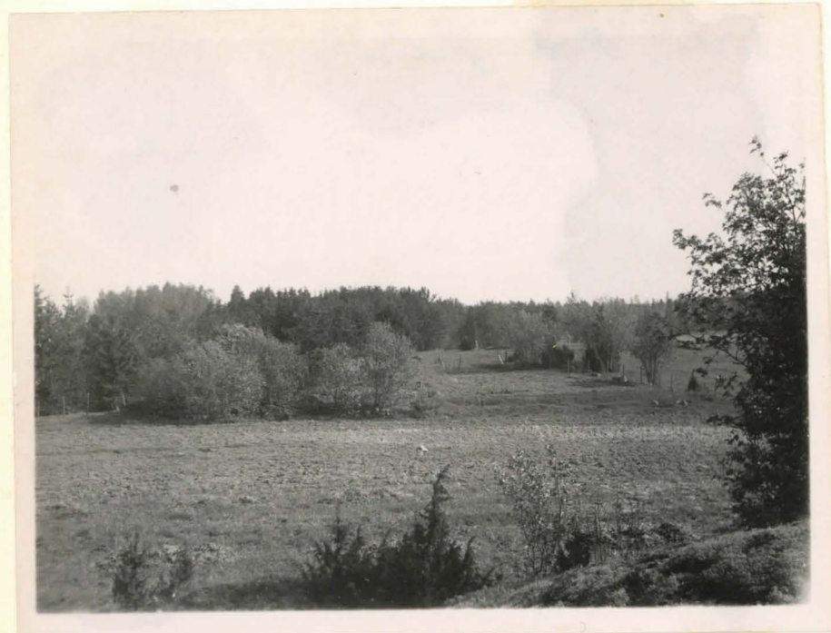
3 Ristinpelto valokuvattu WSW-suunnasta F 42476