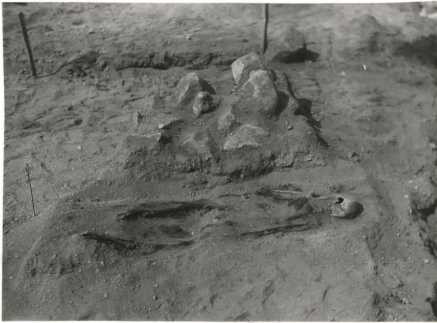
33 Luuranko haudassa 50. Sen takana kivilatamus II F 42 505