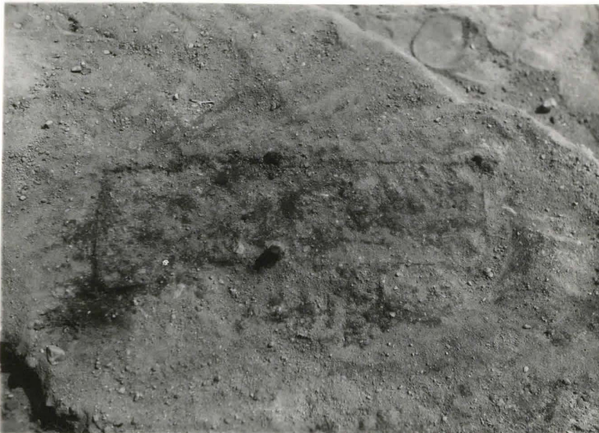
32 Lapsenhauta 15 a. Arkun reuheet ja -naulat selvästi näkyvinä F 42504.