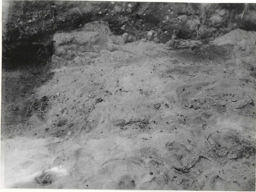
50. Hauta 96. F 42522