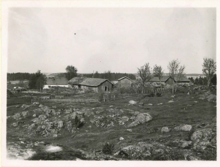
1. Liedon Sauvalan kylä Laurilan talo F 42474