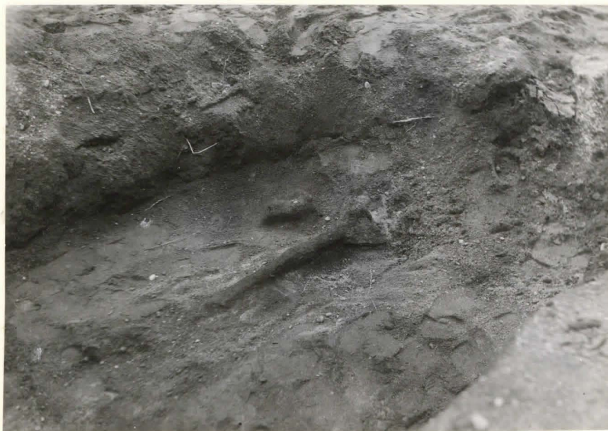
53. Hauta 130. Kirves ja siihen kuuluva puuvaasi. F 42524.