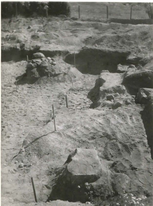
17. Rakennuksen perus- tuksen eteläsivun. (latomukset IV-VII.) F 42490