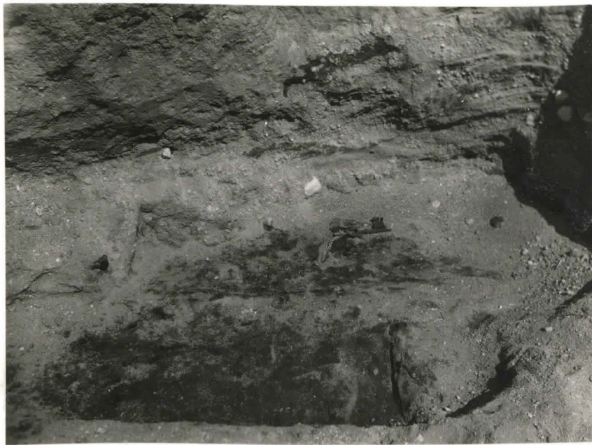
36. Hautat 56 ja 57, valok. etelästä F 42508