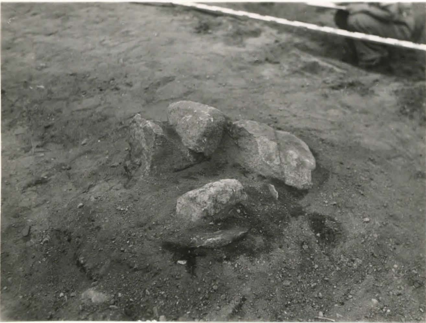
19. Rakennuksen pe- rustukseen kuulu- va kivilatomus I F 42492