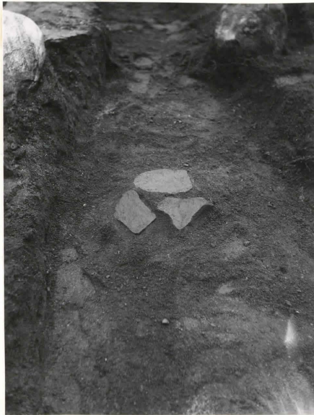
51. Hauta 97. Kivilato- mus haudan päällä F. 42523