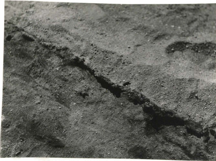
42. Hauta 73. Tekstilijäännöksiä pitkin haudan S-reunaa. F. 42514