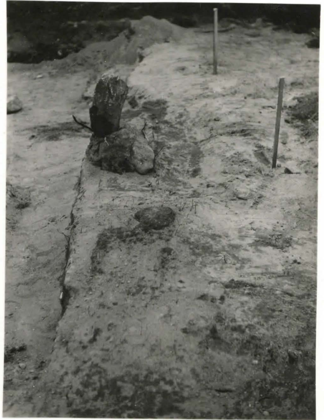
29. Hauta 8. valok. idästä F 42501