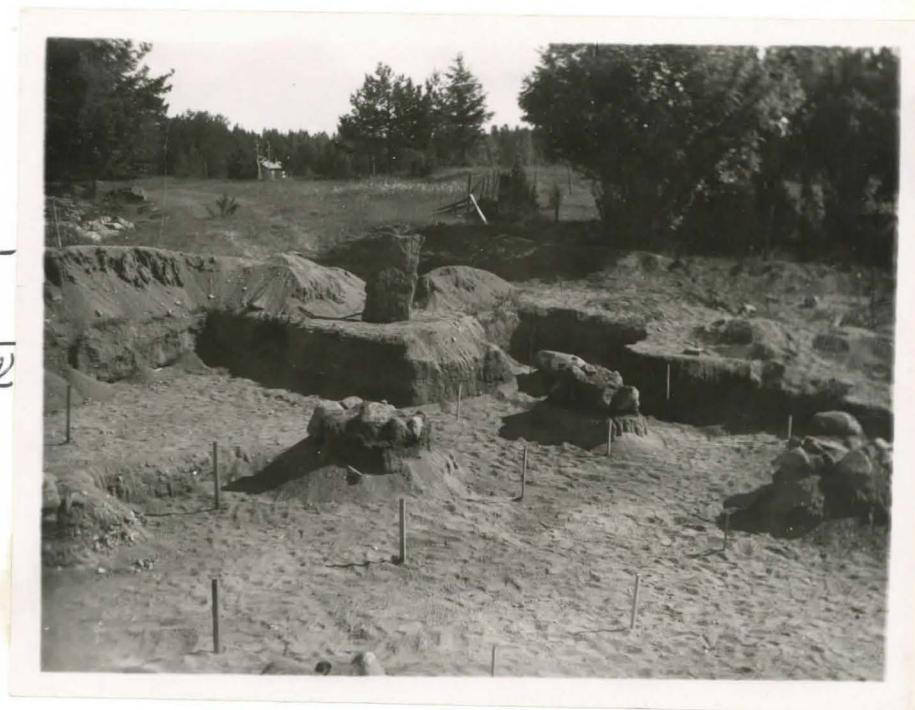
11. Dakennuksen perus- tukseen kuuluvat kivilatomukset II-IV F. 42484.

Dakennuksen perus- tukseen kuuluvat kivilatomukset III-VI F 42483