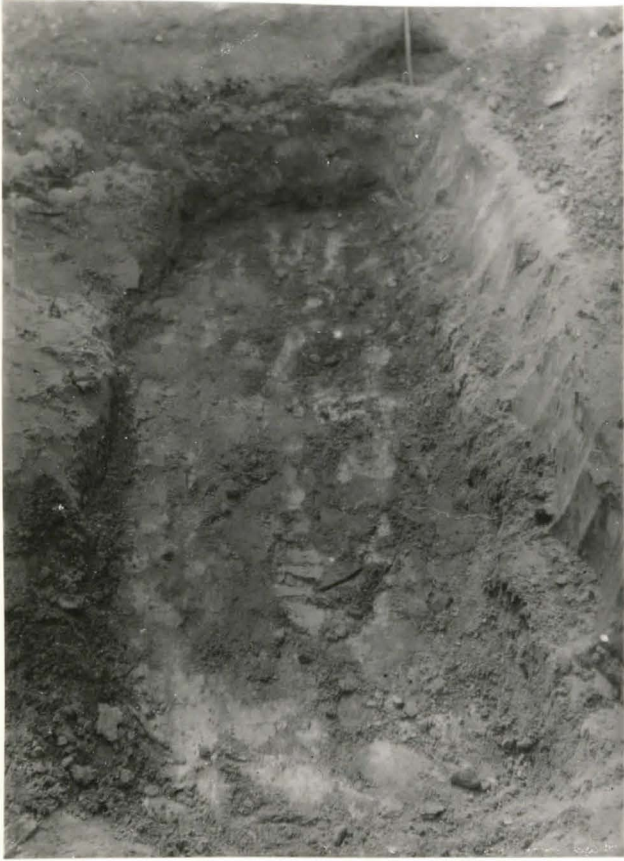
28. Hauta 4. valok. idästä F. 42500