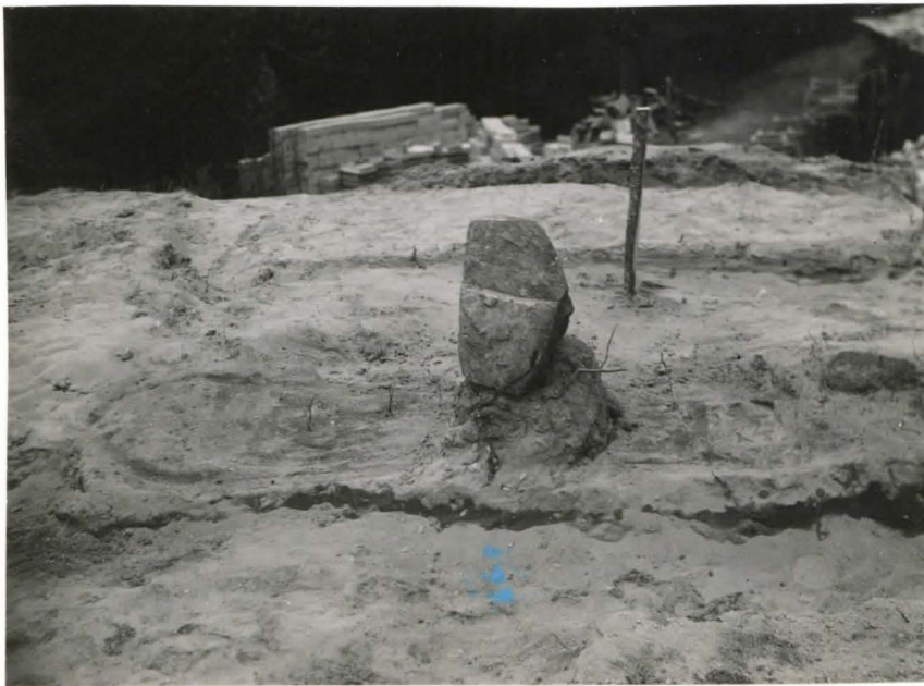
30. Hauta 8. kivi sin. puolella oleva kivi. Valok. etelästä F 42502