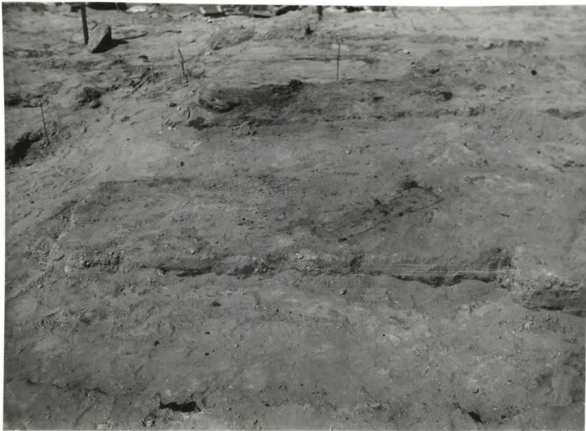
31 Haudat 15 ia (lapsenhauta) 15 a. viimeksimainittu viistoon edellisen yli. Taustalla hauta 14. F. 42503