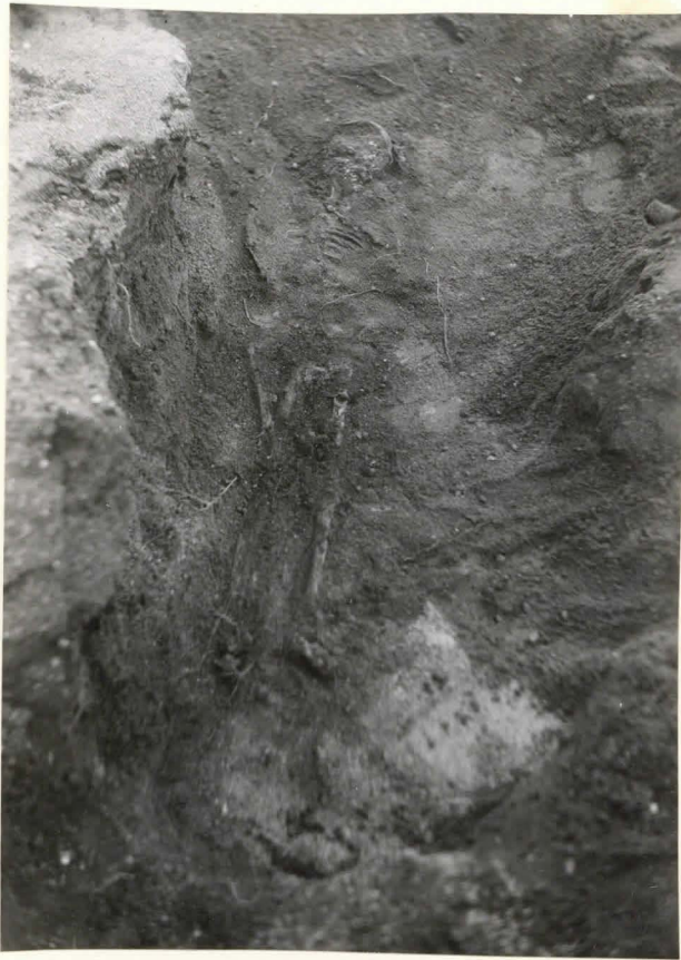
52 Luuranko haudassa 129 F. 42523 a