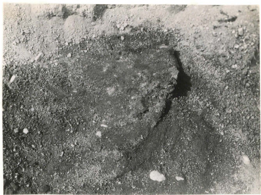
47. Hauta 83. Tekstiliäännöksiä F 42519