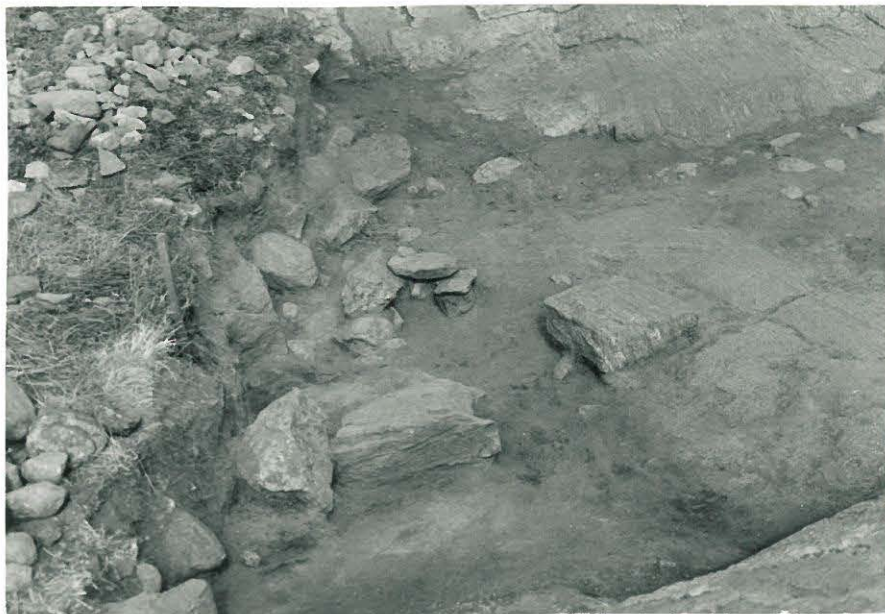
31. Laattakiviä ruutujen XVII:6-7 alueella.