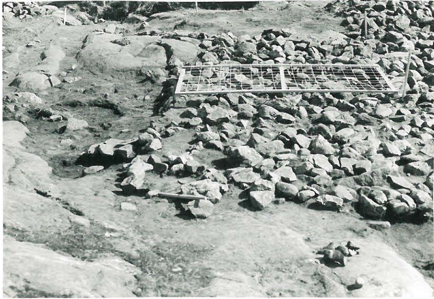
9. Ruudut XIV-XVII:6-7, pintakiveys osittain poistettu, kuvattu pohjoisesta.