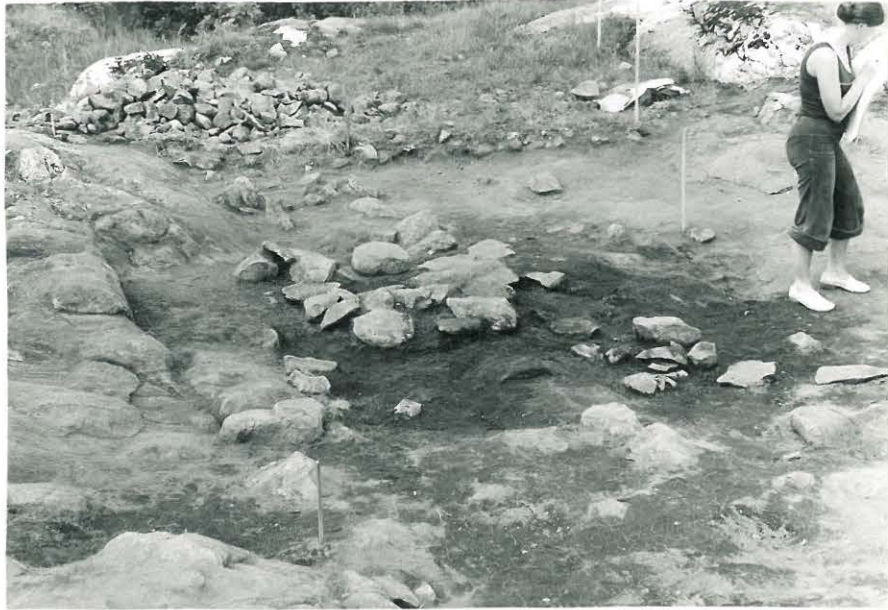
15. Laattakiveys II-kerroksessa, kuvattu etelästä.