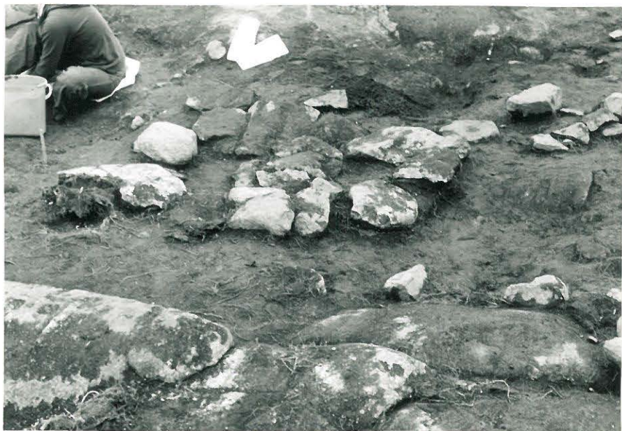
12. Ruudun XVI:7 II-kerroksesta tavattu laattakiveys, kuvattu esiinkaivamisen yhteydessä lännestä. 837