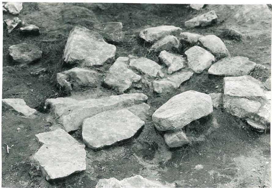
14. Lähikuva laattakiveyksestä, kuvattu pohjoisesta. 839