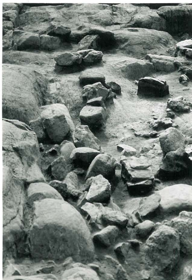
28. Peruskiveystä idästä.