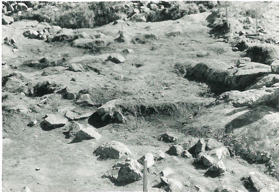
11. Kaivausalue (ruuturivit 6-7) pintakiveyksen noistamisen jälkeen. 836