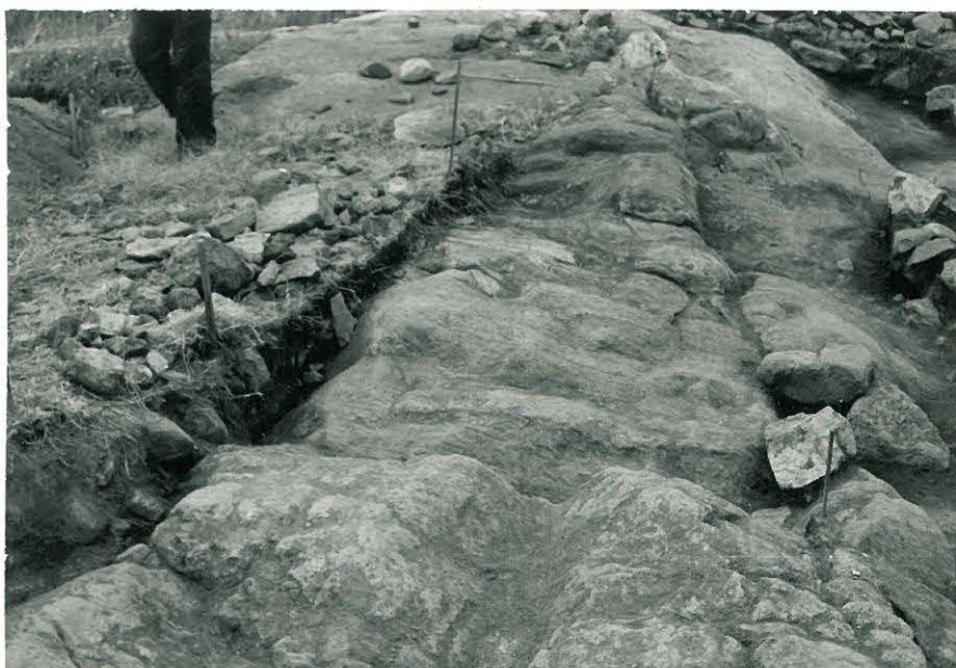
32. Ruuturivi XIV-XVII:6 kaivausten päätyttyä.