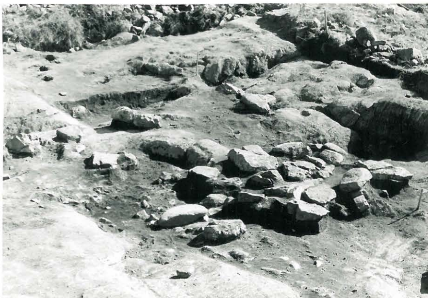
20. Kaivausalue koillisesta, etualalla savinaa (IIIkrs.) kaivettu pois, taustalla saveus edelleen jäljellä. Keskellä poistamatta jätetty laattakiveys. 845