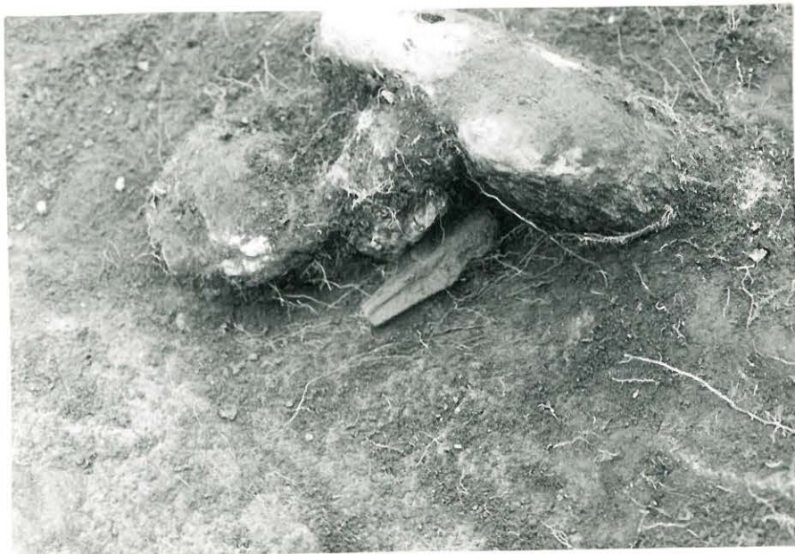
18. Löytö no 63 löytöpaikallaan.