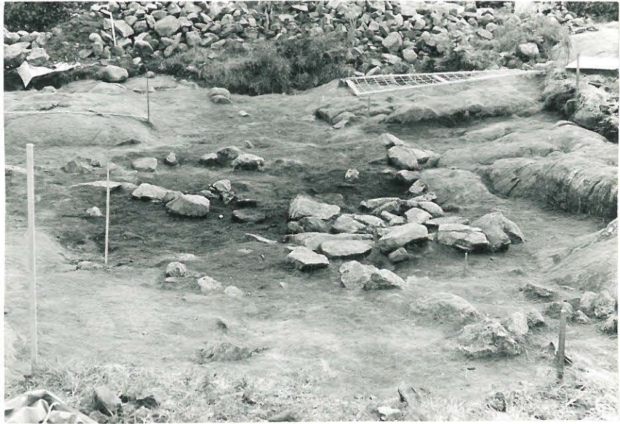
13. Kaivausalueen II-kerros tutkittuna pohjaan asti, kuvan keskellä laattakiveys, kuvattu pohjoisesta. 838