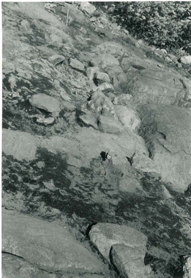
19. Seinän peruskive- ystä lännestä ku- vattuna, savinaa voimakkaan laikul- lista. 844