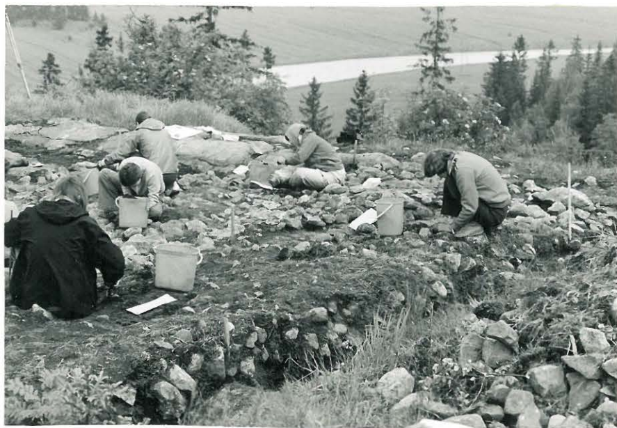
1. Pintakiveyksen paljastusta, kuvattu lounaasta.