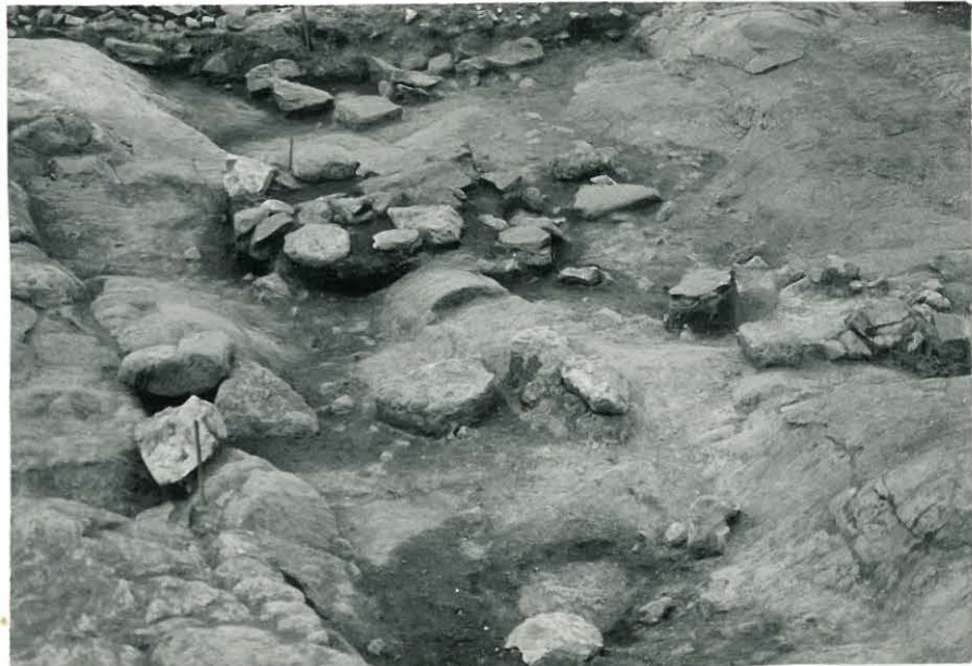
22. Kaivausalue etelästä kuvattuna, joiden takana näkyy yksittäisiä laattakiviä mm. kaivausalueen reunan seinämässä. 847