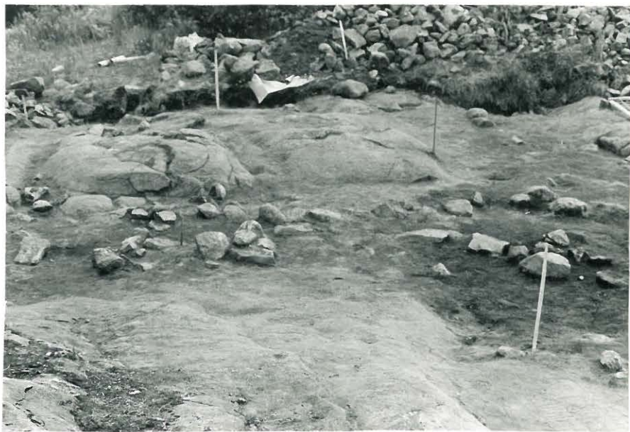
16. Ruudut XIV-XV:8-9, II-kerros kaivettu pohjaan. Savi-kerroksesta nistää esiin peruskivirivi, kuvattu pohjoisesta.