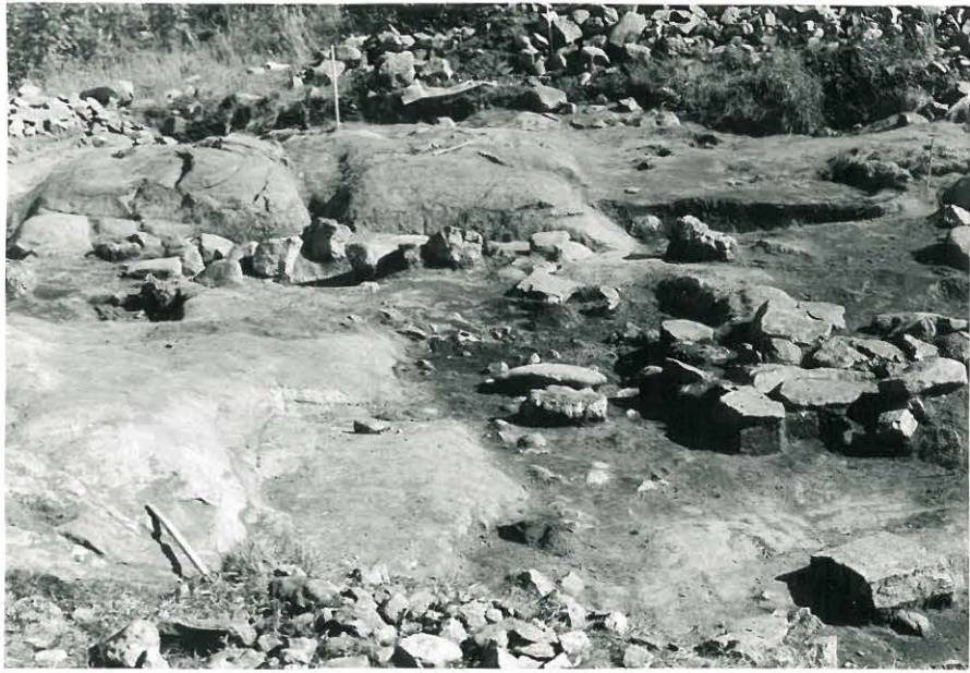
21. Kaivausalue pohjoisesta kuvattuna. Etualalla III-kerros kaivettu laatta- ja peruskiveystä lukuunottamatta. 846