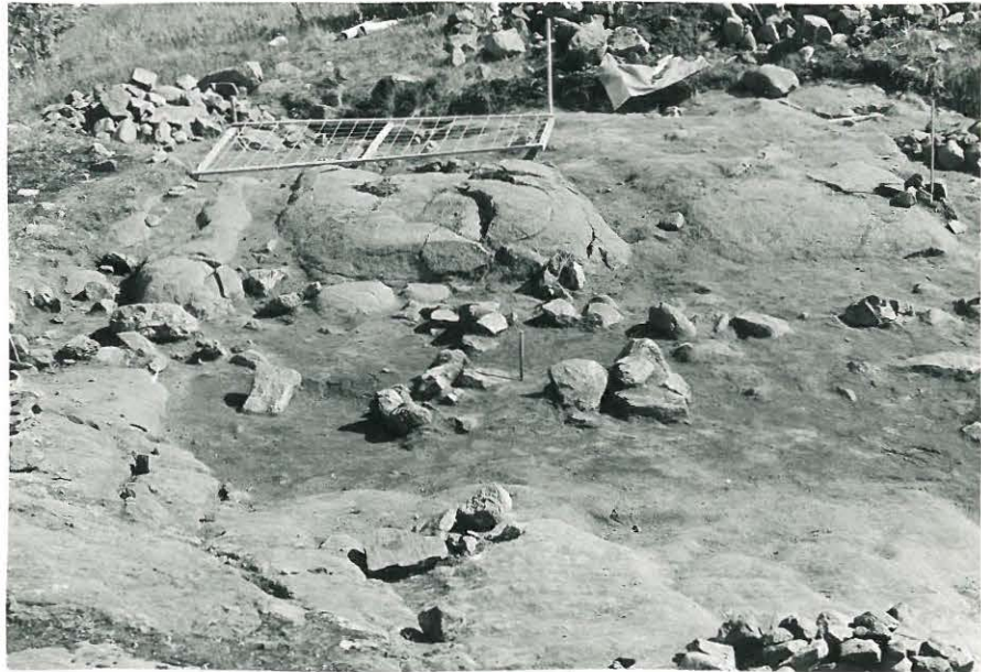
17. Ruudun XIV-XV:8-9 II-kerros kaivettu pohjaan, kuvattu pohjoisesta.