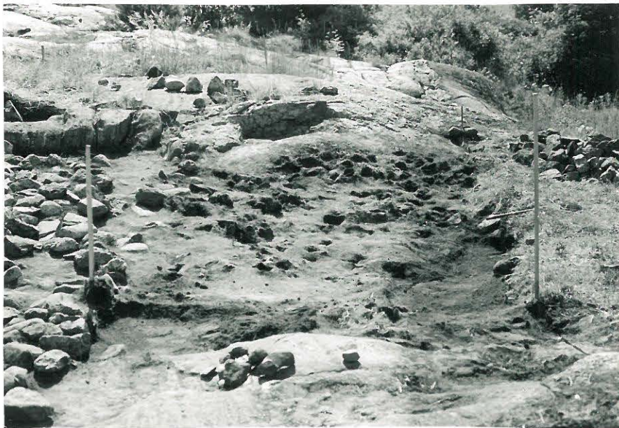
10. Pintakiveys poistettu ruuduista XVII:6-7, kuvattu idästä.