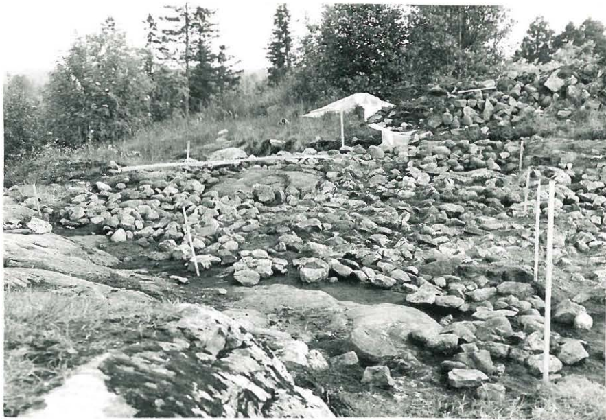
8. Pintakiveystä ruuduissa XIV:-XVII:8-9 kuvattu pohjoisesta.