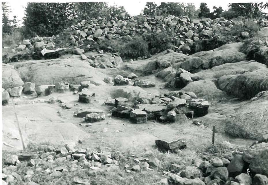
24. Kaivausalue pohjoisesta, III-kerros kaivettu kokonaisuudessaan pohjaan. 849