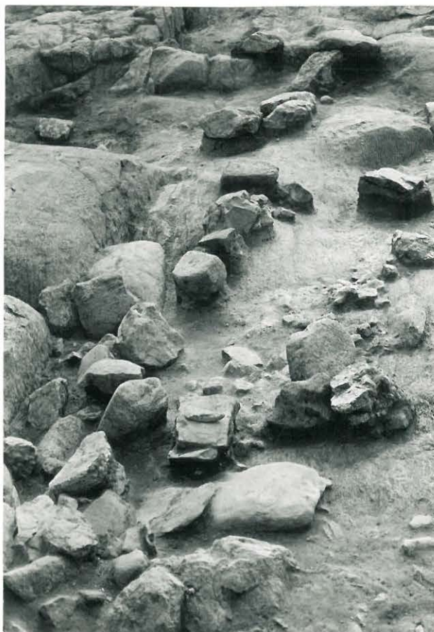
27. Peruskiveystä idästä.