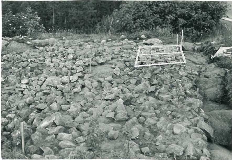
7. Pintakiveys ruuduissa XIV-XV lännessä kuvattuna.