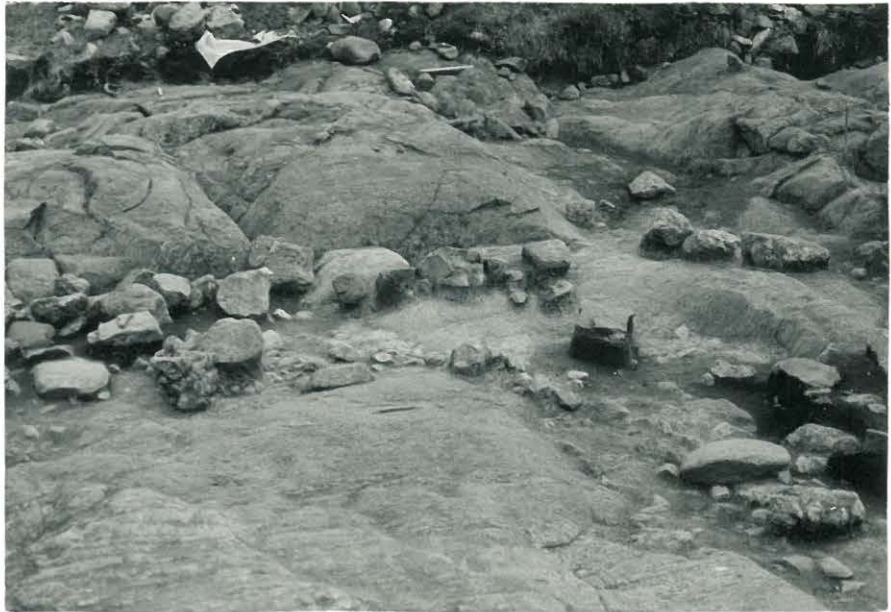
23. Kaivausalue pohjoisesta, III-kerros kaivettu pohjaan, peruskivet säilytetty paikoillaan. 848