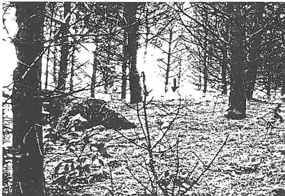
TYA 10921, Lammashaka, koekuoppa no 1:n ympä- ristö, maahan yms. kuvattu idästä.