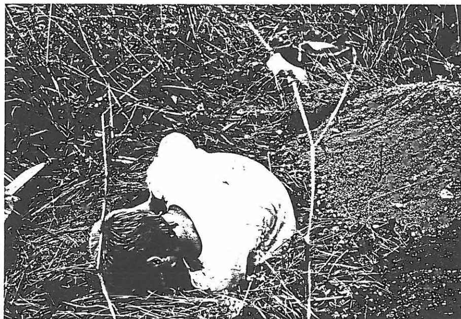
TYA 10081 P. Tuokka kaivaa koekuoppaa no 4 Nivolan aitan takana.