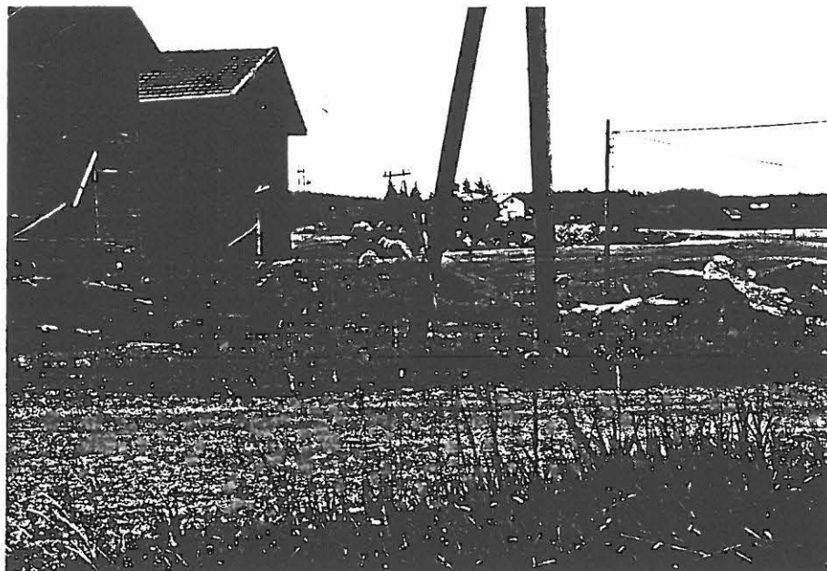
TYA 10083 Nivolan aitat, takana Muuntojärvi ku- vattu pohjoisesta.