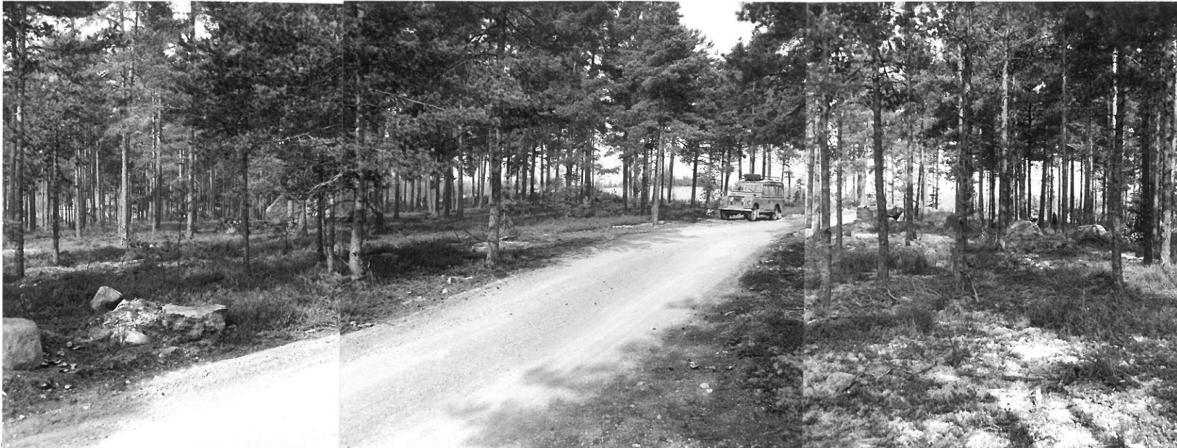
F.41726 F.41727 F.41728 Kuva 1: Yleiskuva koekaivausalueesta. Taustalla sorakuopat. Kuvan keskellä Turku-Pori valtatieltä sorakuopille johtava tie. Kuvan vasemmassa reunassa näkyvät valtatievarressa olevat puutalot ja niiden takana on Mynämotelli. Kuvan vasemmassa osassa keskivaiheilla näkyy alueella oleva suuri maakivi. Sorakuopan reunassa olevan rajapyykin paikka merkitty punaisella R-kirjaimella kuvan oikeaan reunaan. Valokuvattu kaakosta.