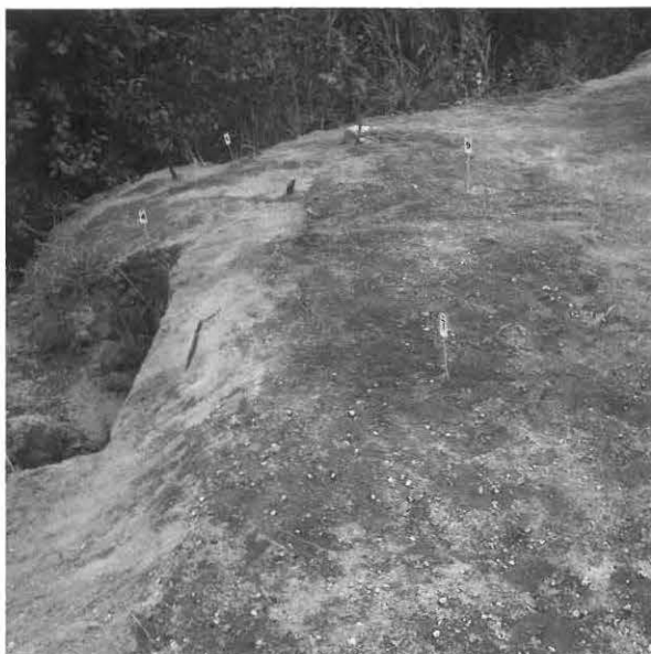
KUVA 14 / F. 120861

Kaivausalue (x: 524-531, y: 207-212) ja vanhan hiekkakuopan reunaa, taso 1, kuvattu koillisesta.