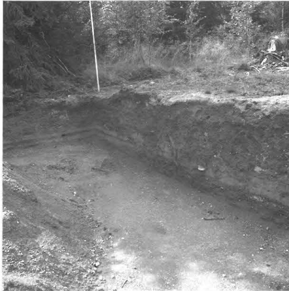
KUVA 18 / F. 120865

Hiekkakuopan luoteisreunan suoristetun profiilin lounaisosa, kuvattu idästä.