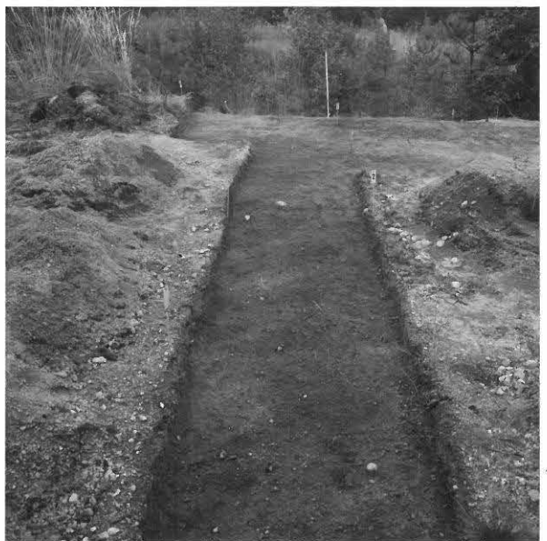
KUVA 13 / F. 120860

Kaivausalue (X: 528-532, Y: 205-210), taso 1, kuvattu luoteesta.