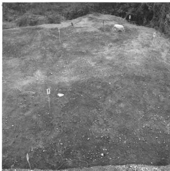
KUVA 16 / F. 120863

Kaivausalue (x: 526-531, y: 205-212) ja vanhan hiekkakuopan reunaa, taso 1, kuvattu luoteesta.