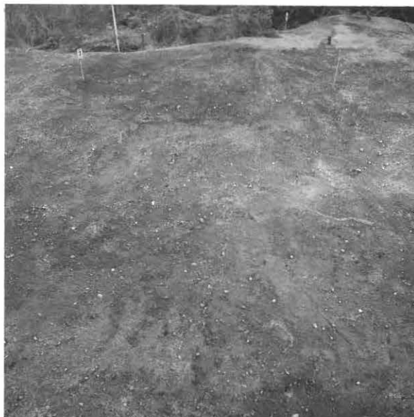
KUVA 15 / F. 120862

Kaivausalue (x: 524-531, y: 207-212) ja vanhan hiekkakuopan reunaa, taso 1, kuvattu koillisesta.