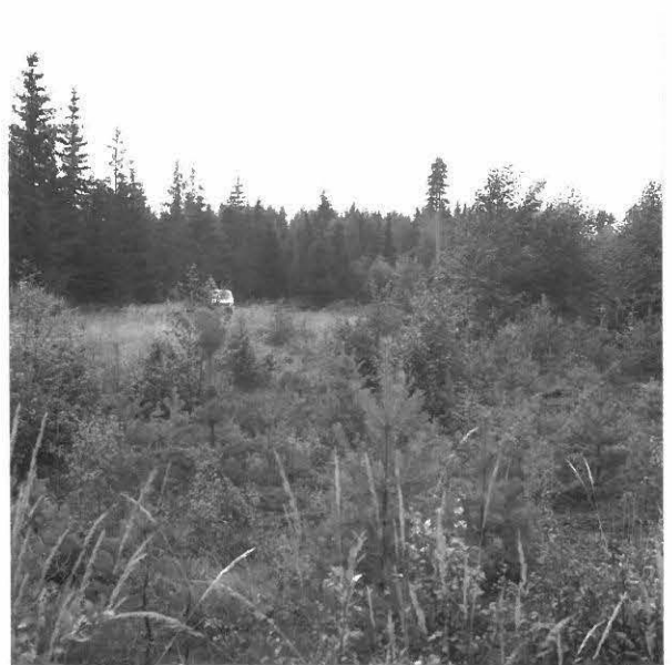
KUVA 2 / F. 120849

Tutkimusalue taustalla, hiekkakuopan luoteisreunassa, kuvattu etelälounaasta.