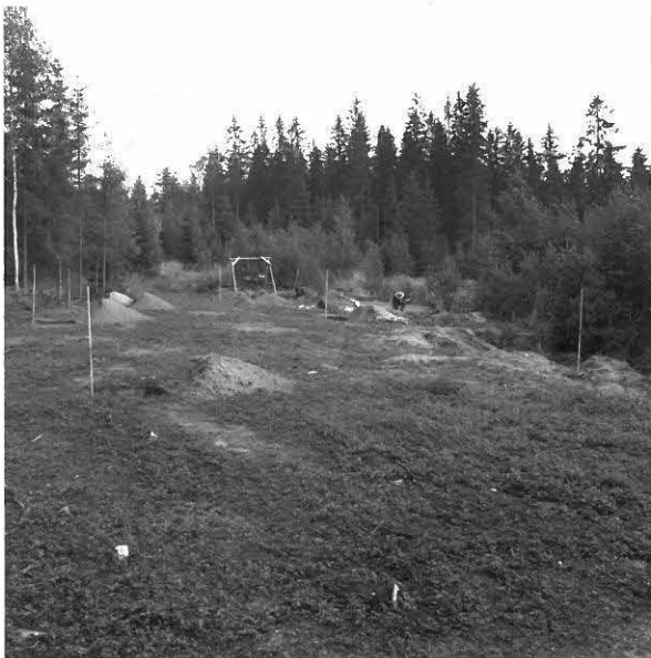
KUVA 8 / F. 120855

Tutkimusalue, vasemmalla vanha hiekkakuoppa, kuvattu pohjoiskoillisesta. Tutkimusalue, vasemmalla vanha hiekkakuoppa, kuvattu koillisesta. Tutkimusalue, vasemmalla vanha hiekkakuoppa, kuvattu itäkoillisesta.