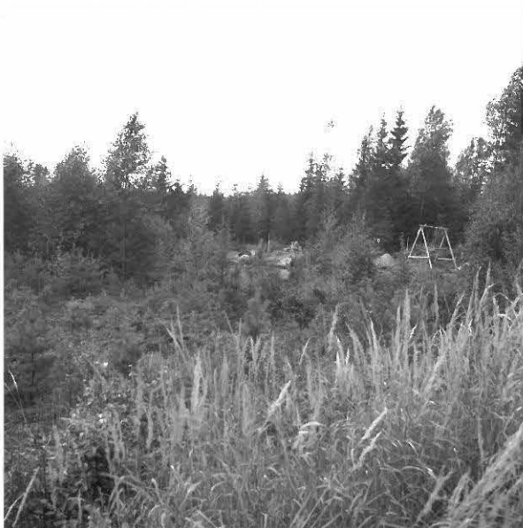
KUVA 3 / F. 120850

Vanha hiekkakuoppa, kuvattu itäkoillisesta.