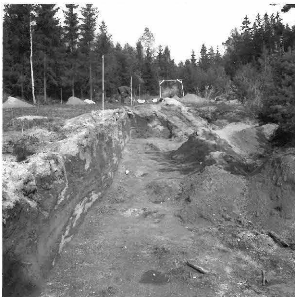
KUVA 19 / F. 120866

Hiekkakuopan luoteisreunan suoristetun profiilin lounaisosa, kuvattu idästä.