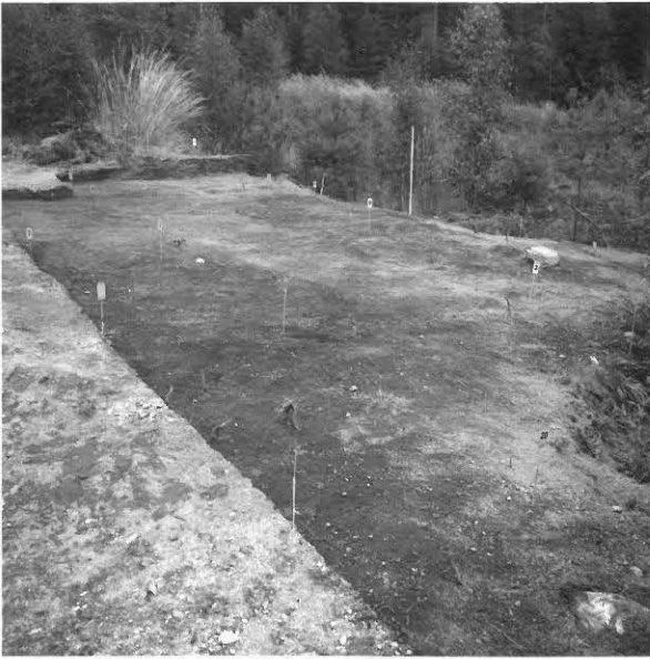
KUVA 10 / F. 120857

Kaivausalue (X: 523-532, Y: 205-212), taso 1, kuvattu länsilounaasta.