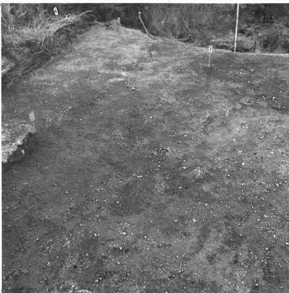
KUVA 12 / F. 120859

Kaivausalue (X: 523-531, Y: 205-209), taso 1, kuvattu idästä.