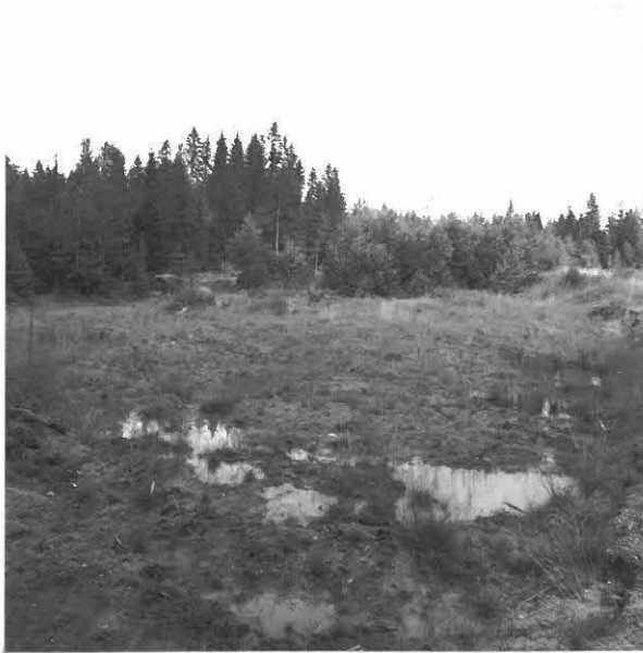
KUVA 1 / F. 120848

Tutkimusalue taustalla, hiekkakuopan luoteisreunassa, kuvattu etelälounaasta.