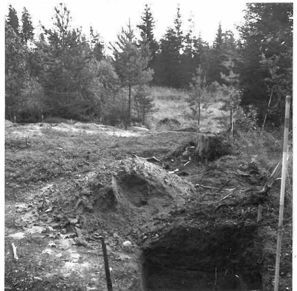
KUVA 9 / F. 120856

Tutkimusalue, taustalla oikealla vanhaa hiekkakuoppaa, kuvattu lounaasta.