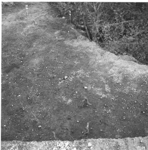
KUVA 17 / F. 120864

Kaivausalue (x: 525-530, y: 205-212) ja vanhan hiekkakuopan reunaa, taso 1, kuvattu luoteesta.