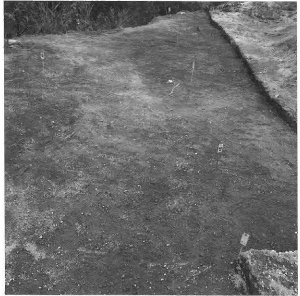
KUVA 11 / F. 120858

Kaivausalue (X: 523-532, Y: 205-212), taso 1, kuvattu länsilounaasta.