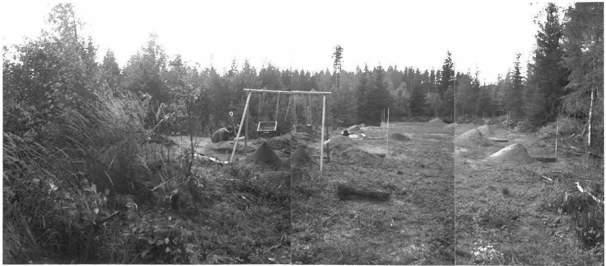
KUVA 5 / F. 120852