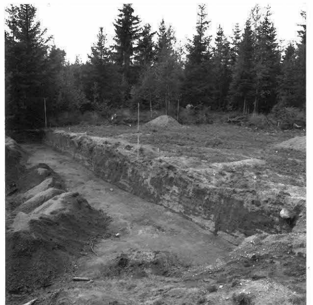
KUVA 4 / F. 120851

Tutkimusalue, etualalla vanha hiekkakuoppa, kuvattu idästä.