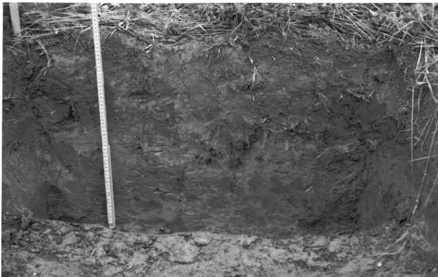
f 124793 Koekuoppa 420/700. Länsiprofiili. Hiilikerros kyntökerroksen alarajassa.