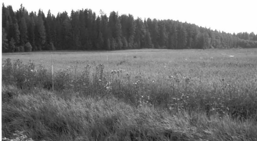
f 124790 Yleiskuva. Peruslinja etelään rata-alueen poikki.