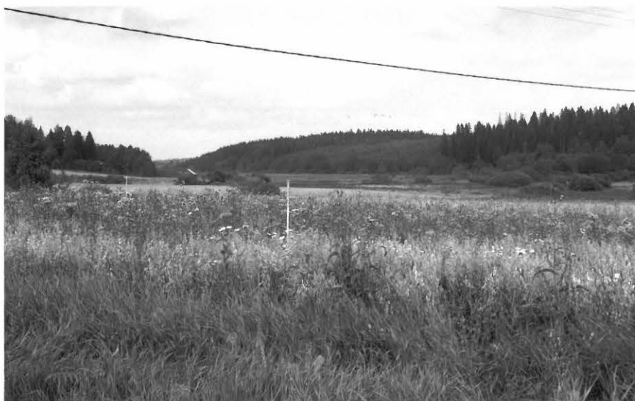
f 124791 Yleiskuva. Peruslinja pohjoiseen.