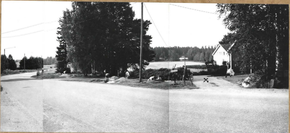
Yleiskuva kasvatuspaikalle, keihäänkärjen KM 13076 työpaikka x, kuv. konti etelään 7 73857-859