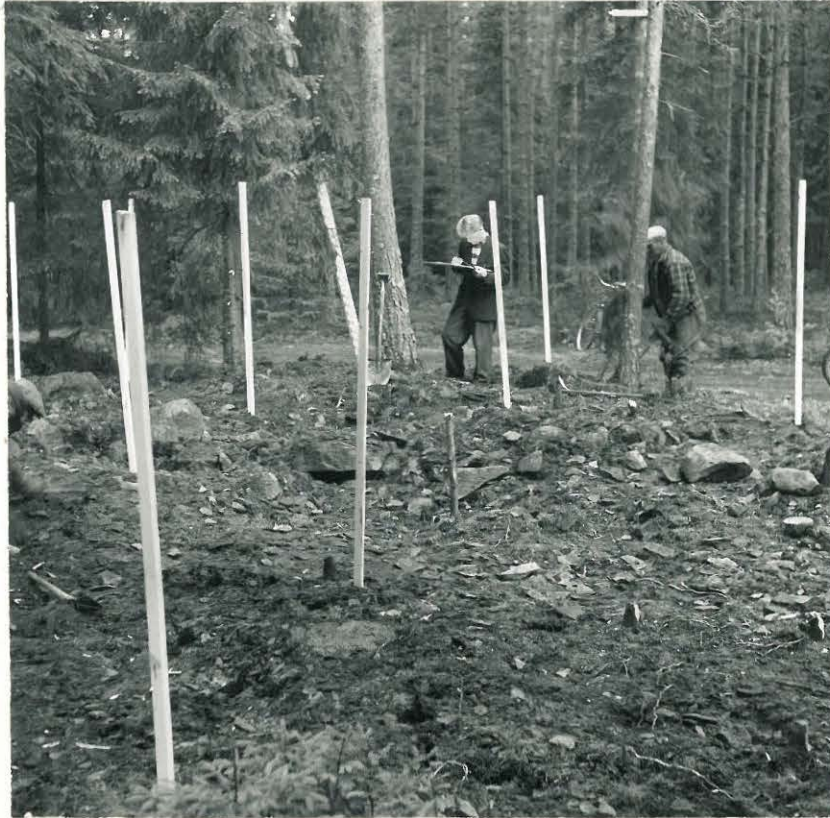
4. Kun pintaturve oli poistettu, havaittiin rökkiön pohja pienen hiekkakivisepelin peittämäksi.