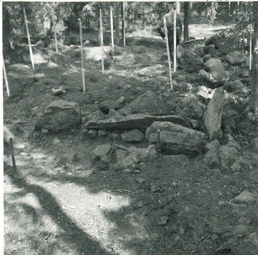
6. Paasiarkku sen jälkeen kun sen ympäristö oli perattu ja tutkittu. Kuvattu etelästä päin.