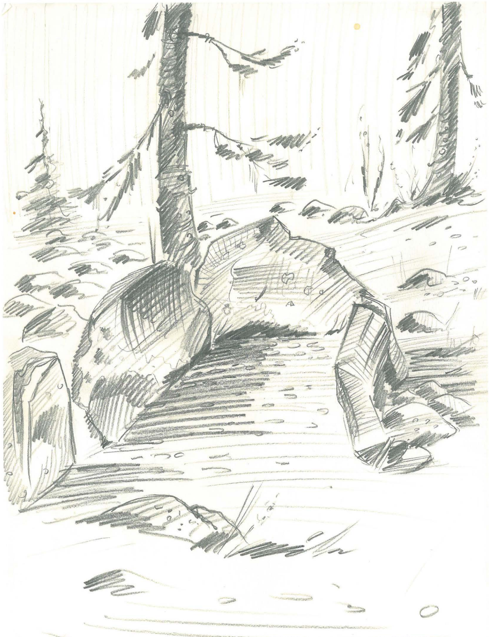
Nakkila, Lammainen, Tarringinmäki Paasiarkkuhauta