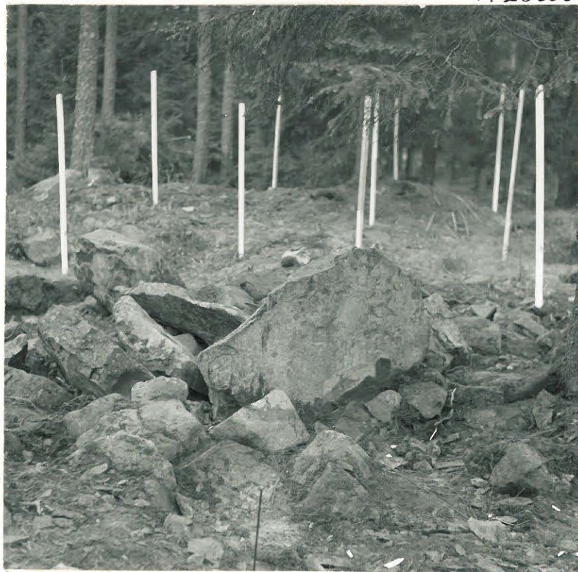
7. Sama kaakosta käsin.