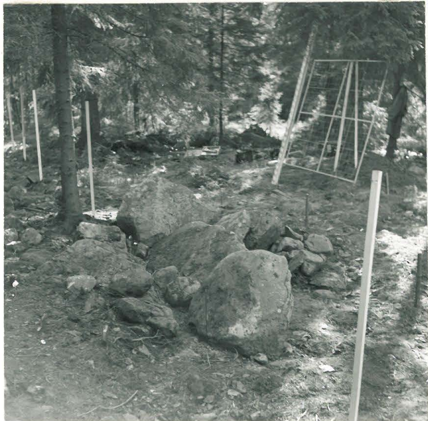
9. Sama valokuvattuna pohjoisluoteesta käsin.