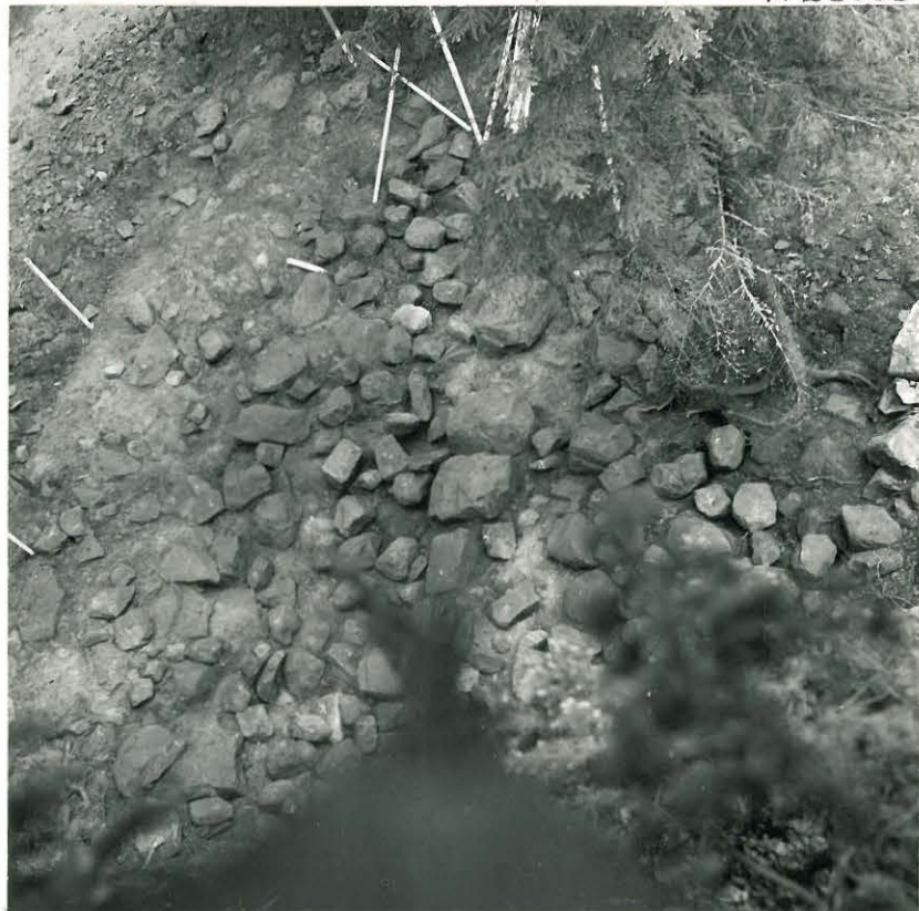
11. Sama kuin edellä, valokuvattu ylhäältä. Kuvassa näkyy melko selvästi kolme sisintä kivikehää sekä neljännen kehän yksityisiä kiviä. (S. H.)