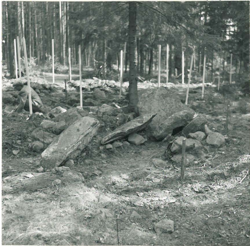
8. Paasiarkku länsilounaasta kuvattuna.