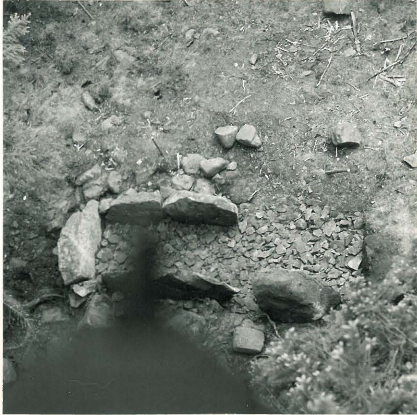
19. Paasiarkku entistettynä. Kuvattu ylhäältä päin.