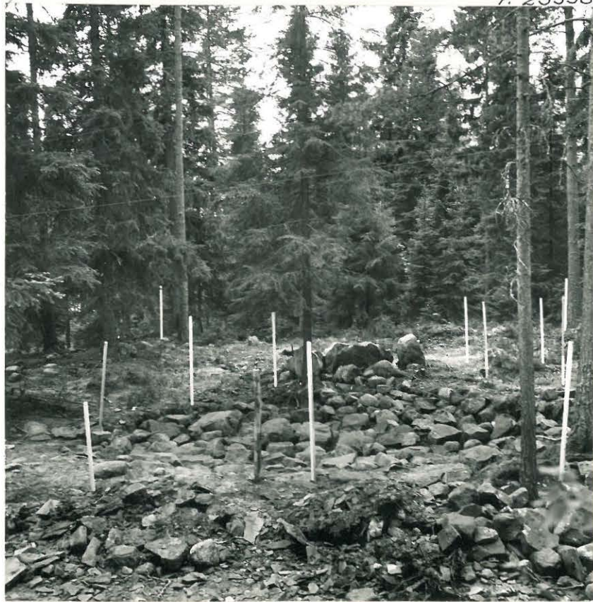
10. Kaivausalue pohjakiveykseen asti paljastettuna. Arkku entistetty. (U. S.)