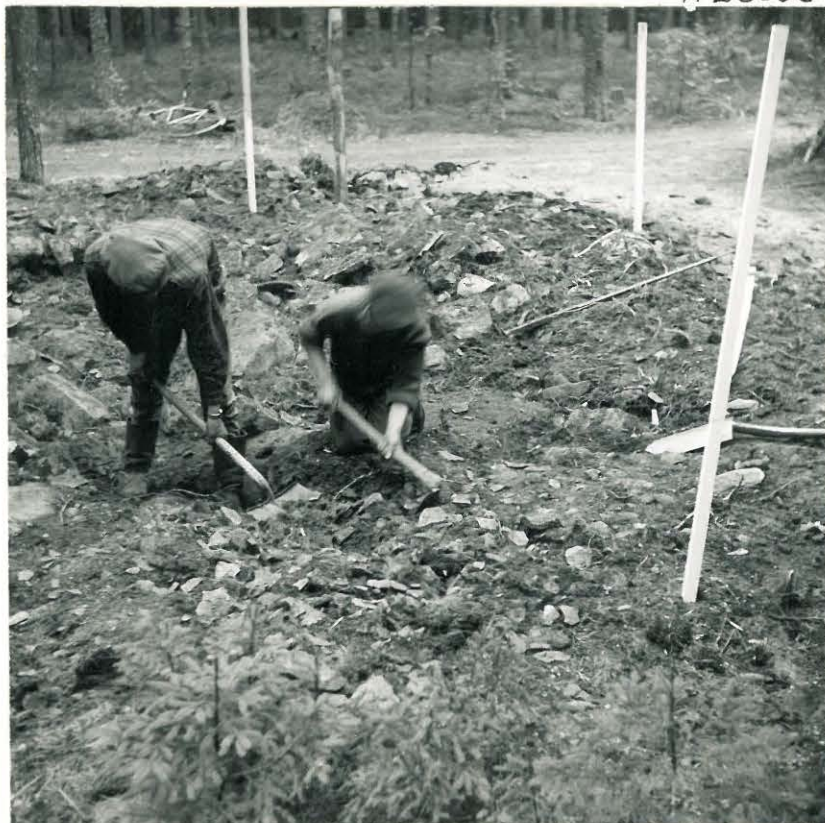
5. Sepeli poistettiin kuokalla.