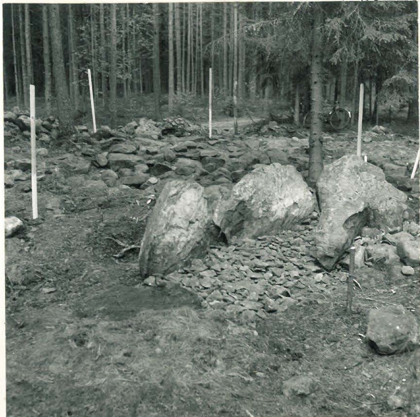
17. Paasiarkku entistettynä. Kuvattu länsilounaasta.