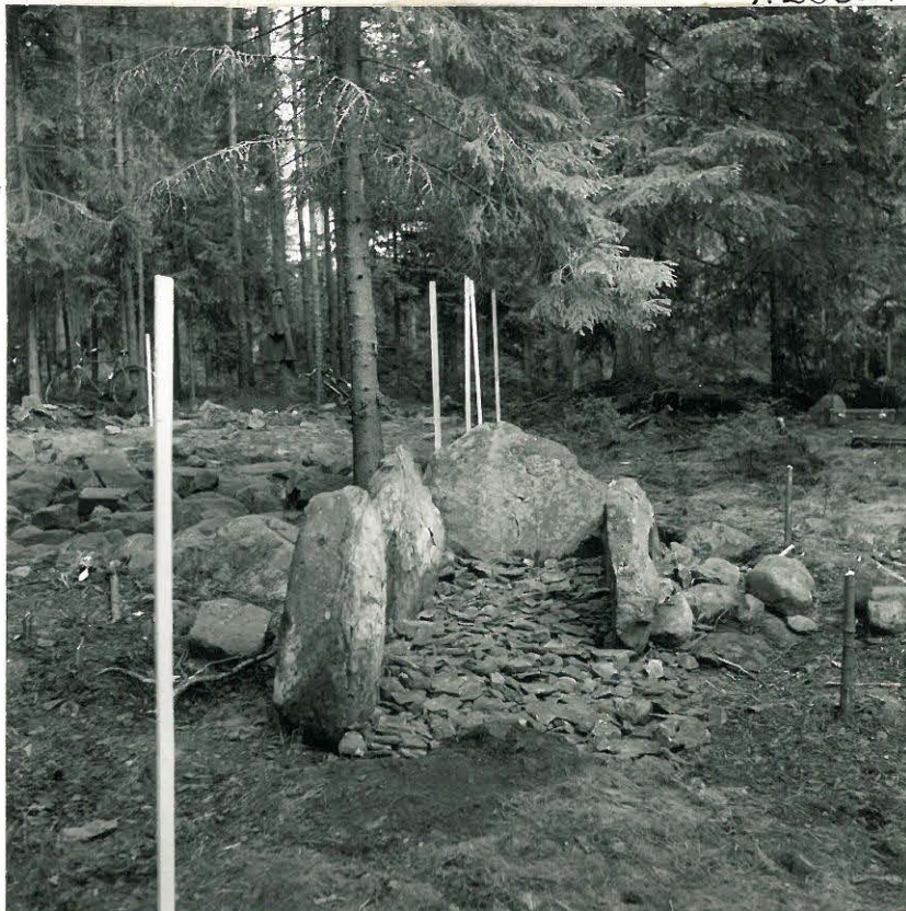
16. Paasiarokku entistettyä. Kuvattu lännestä.