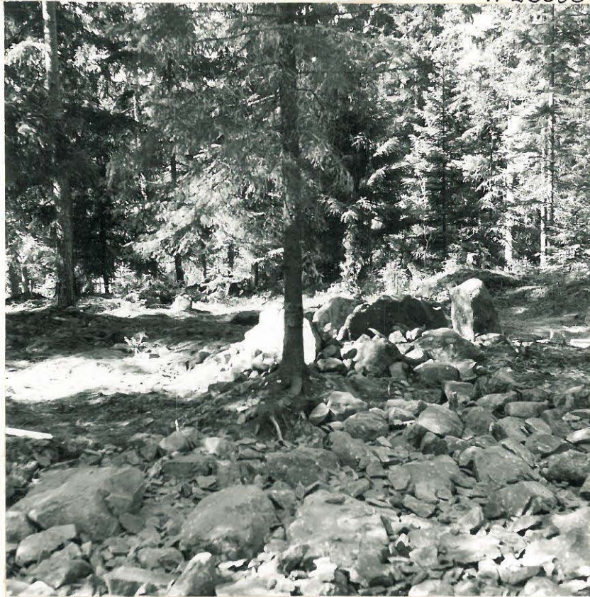
15. Kaivaussektori jälleen peitettyä. Kehäkiveys jätettiin näkyviin, ja kuvassa erottaa kaksi sisintä kehää. F.23604