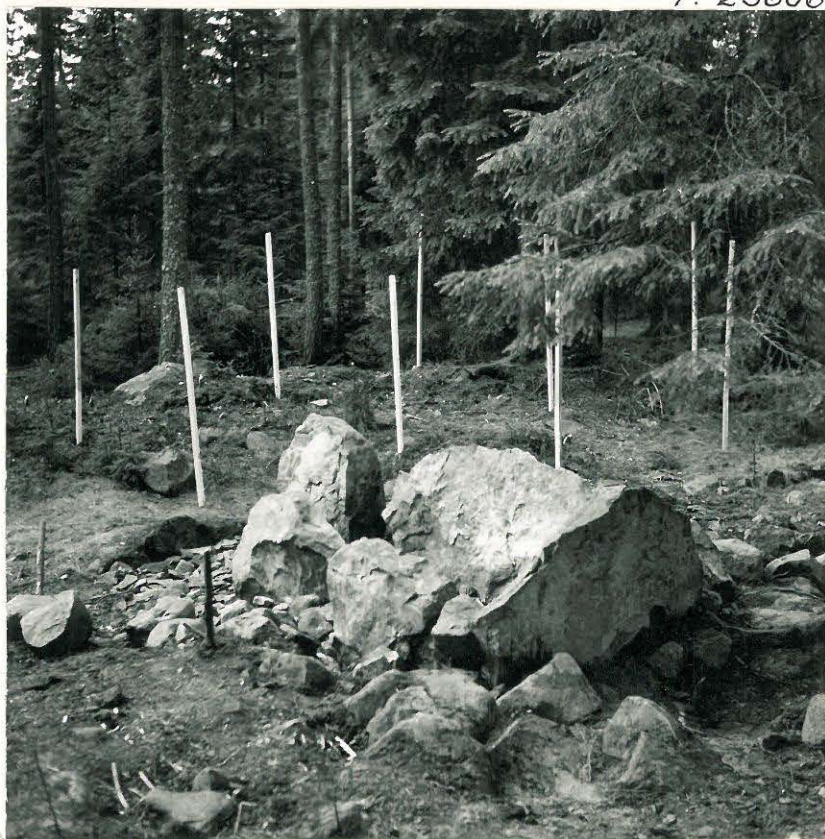
18. Sama kuin edellä kaakosta käsin valokuvattuna.