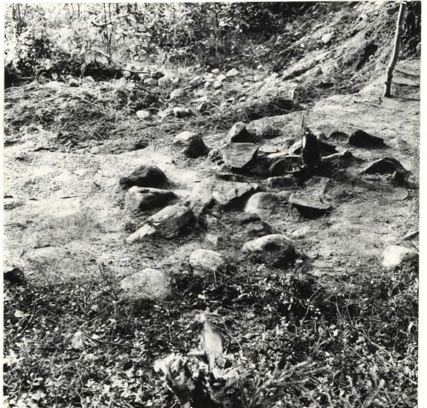
N:o 3 Ruudun B2 kiveystä turpeen poistamisen ja puhdistamisen jälkeen. Kuvattu koillisesta.