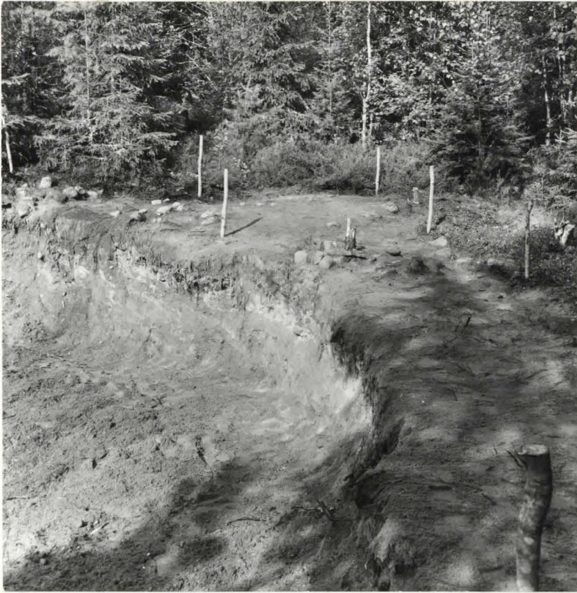
N:o 2 Kaivausalue turpeen poistamisen jälkeen. Kuvattu etelästä.