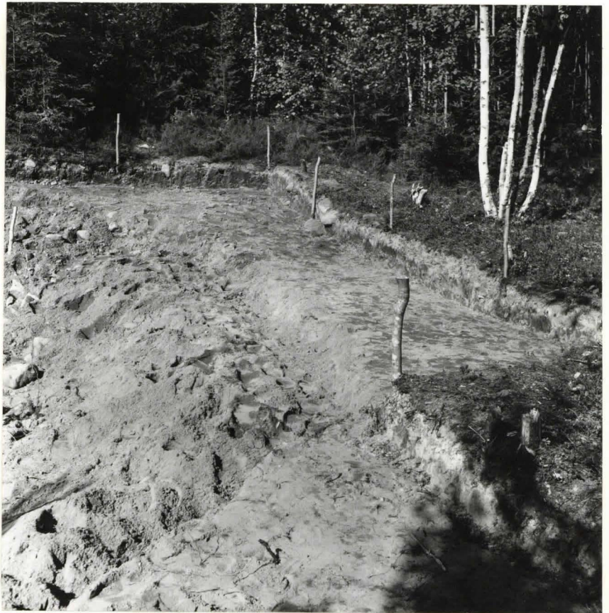
N:o 10. Kaivausalue pohjaan kaivettuna. Kuvattu kaakosta. Neg 25454