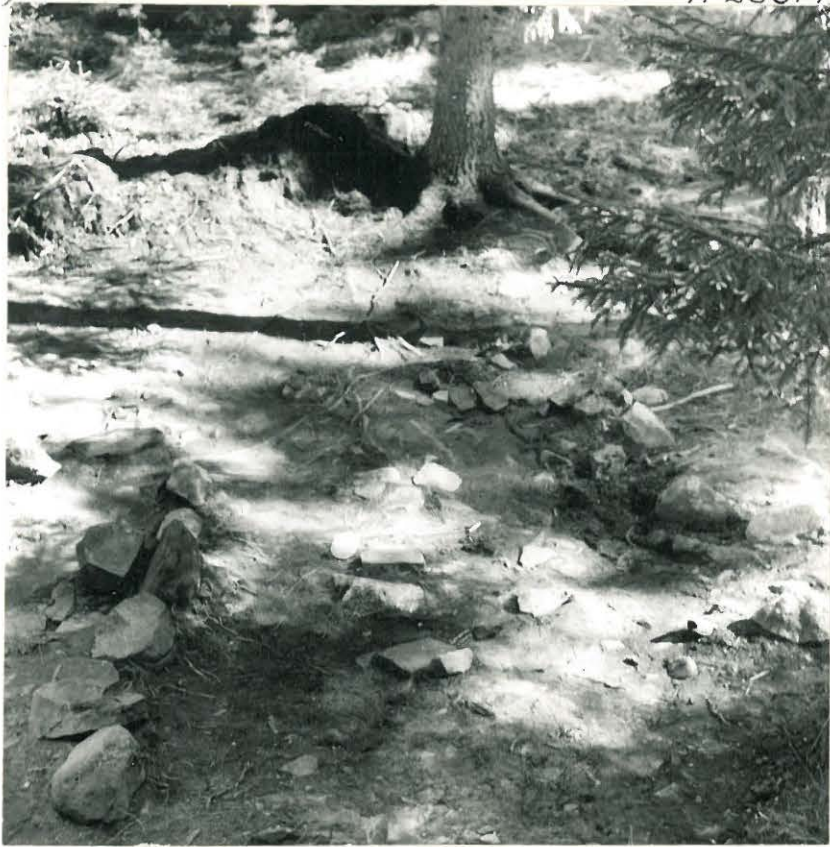
7. Läntisen kiveyksen itäinen kiviviivi, kiveysten välialue ja itäisen kiveyk- sen lounaisnurkka. Kuvattu lounaasta.