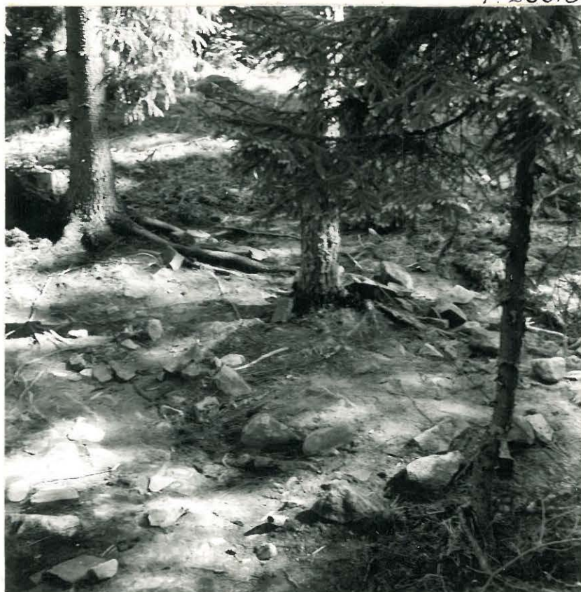
6. Itäinen kiveys pohjaan asti tutkit- tuna. Kuvattu lounaasta.