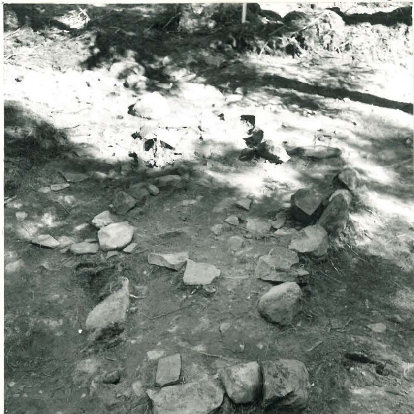
5. Läntinen kiveys pohjaan asti tutkit- tuna. Kuvattu etelästä.