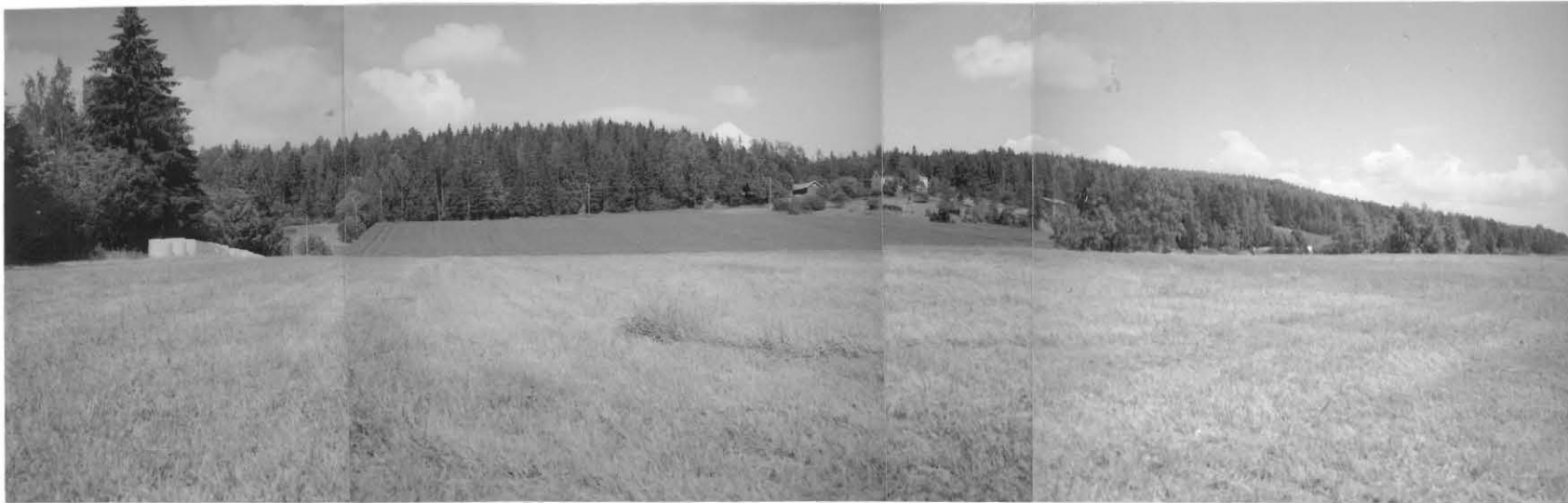
f. 135663-66 Panoraamakuvat tutkimusalueesta, joka edustalla oleva peltoalue taustalla Savian talo, vasemmalla puolella mäkien, pelkon halki kulkee kunnanraja, kuvattu järveltä, etelästä