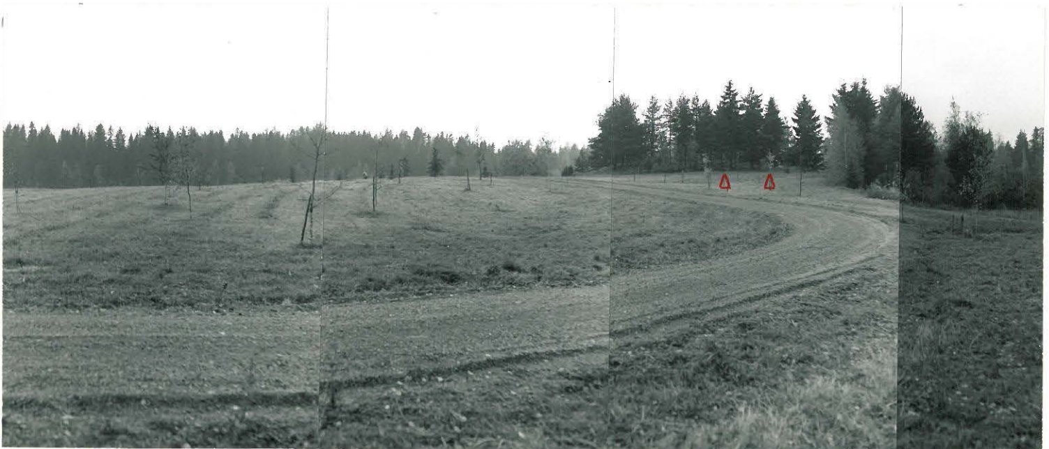
Kuva 1: Yleiskuva leirintäalueesta. Kuvan keskivaiheilla tutkimusalue, josta on löydetty inventoinnin yhteydessä kvartseja. Toinen kvartsilöytöalueista merkitty kuvaan merkillä \Delta . Valokuvattu etelästä.