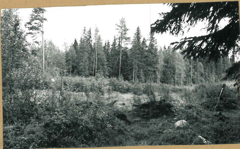
F. 95219-228 Panoraamakuvaa kaivausalueelle I, oikealla kosteikkoo ja suota; kuvattu lounaasta