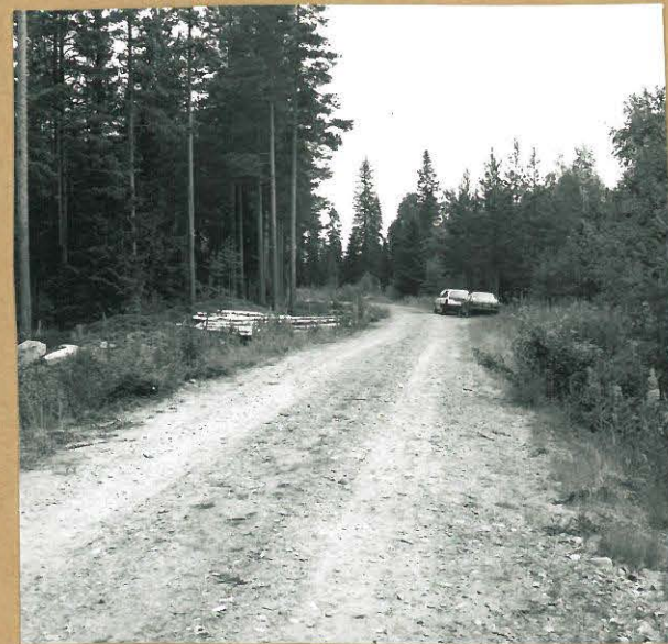
F. Yleiskuva tutkimusalueelta, oikealla autojen 95232: kohdalla alue I, taustalla alue II oikealla kuvattu tieltä, etelästä