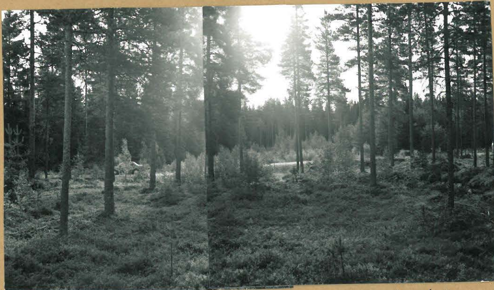
F. 95230-31 panoraamakuvaa kaivausalueelle II = taustalla näkyvä hakkualue, kuvattu lännestä