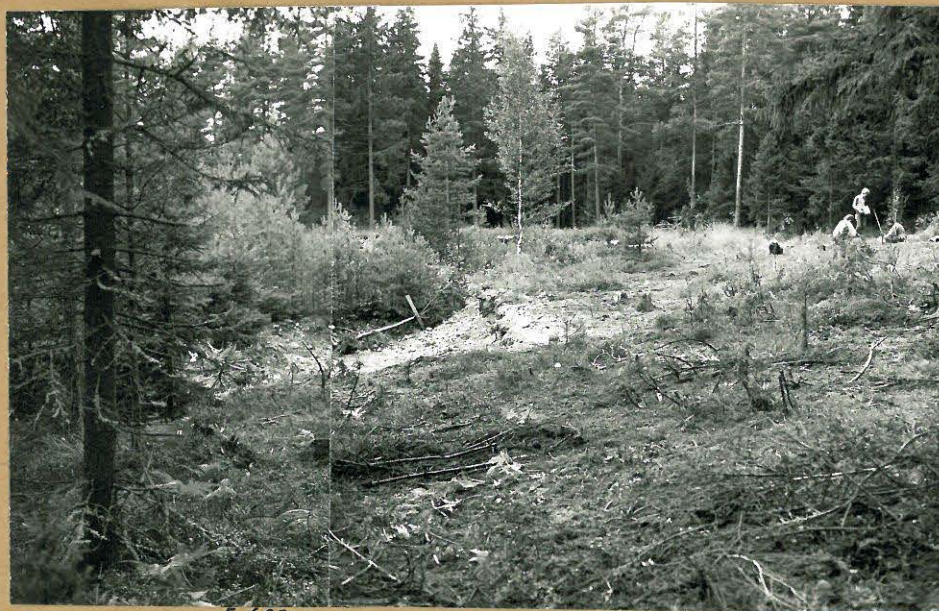
Kuva 4: Liesi tasossa 3. Kuvattu koillisesta.