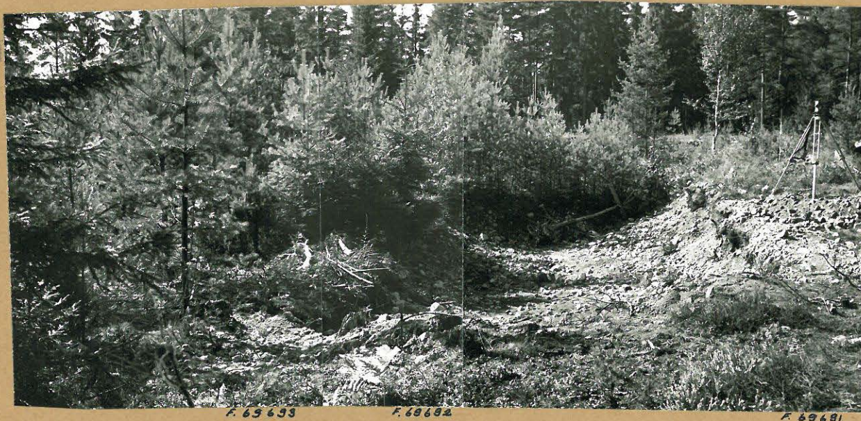
Kuva 2: Etualalla hiekkakuoppa, jonka reunamilta poimittu savias-tianpaloja ja palanutta luuta. Tutkitun lieden sijainti merkitty kuvaan nuolella. Kuvattu idästä.