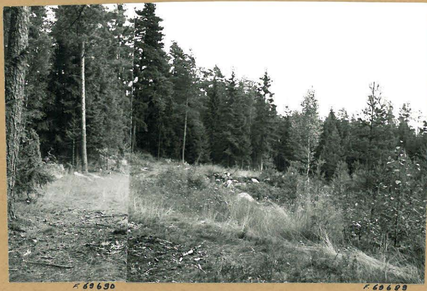
Kuva 1: Maisemakuva koekaivausalueesta. Kuvattu lännestä.