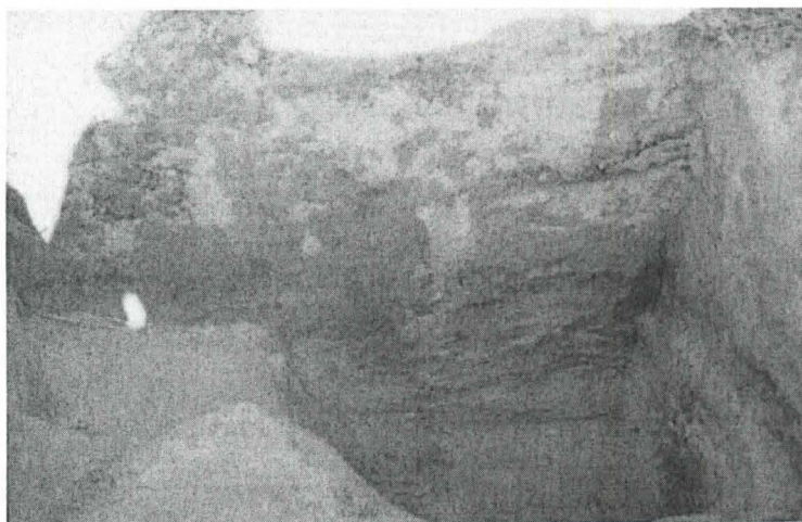
F.142410 Koekuoppa 520/270, länsiprofiili, sekoittunut kohta kaivettu pois, kuvattu idästä