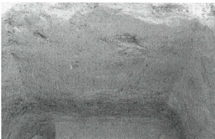
F.142409 Koekuoppa 410/270, kaivettu noin 85 cm, kuvattu etelästä