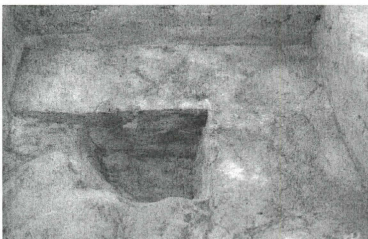
F.142411 Koekuoppa 520/270, kaivettu noin 35 cm, kuvattu idästä