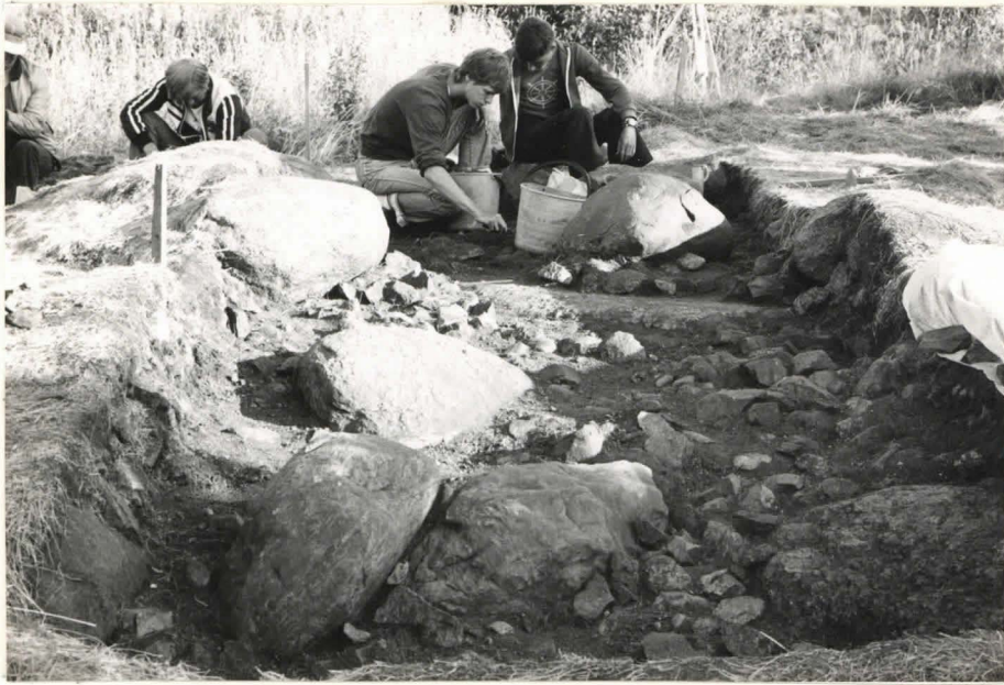
11. Ruudut B:+1 ja B:+2, taso 4, etelästä kuvattuna.