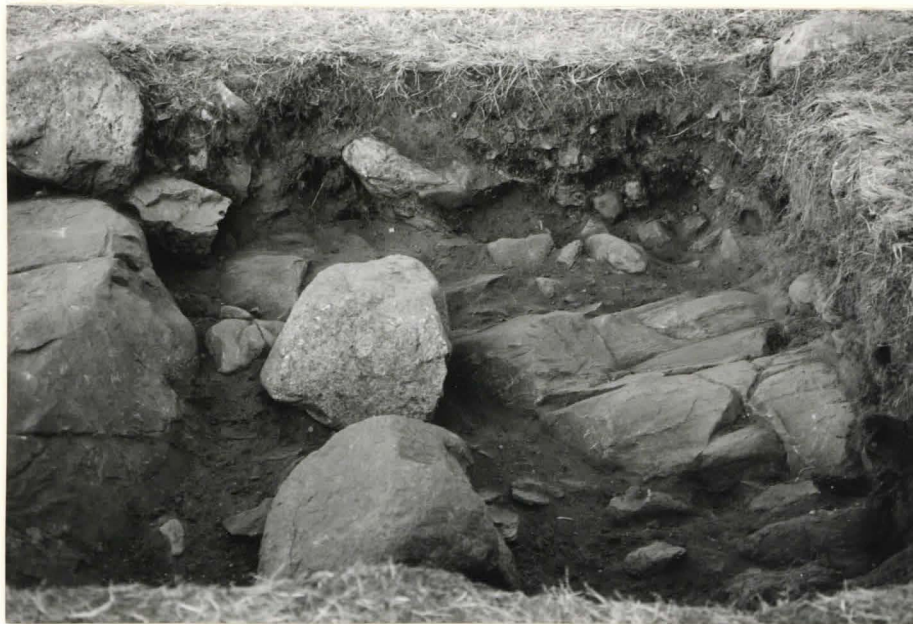
20. Ruutu A:+3, taso 10, etelästä kuvattuna.