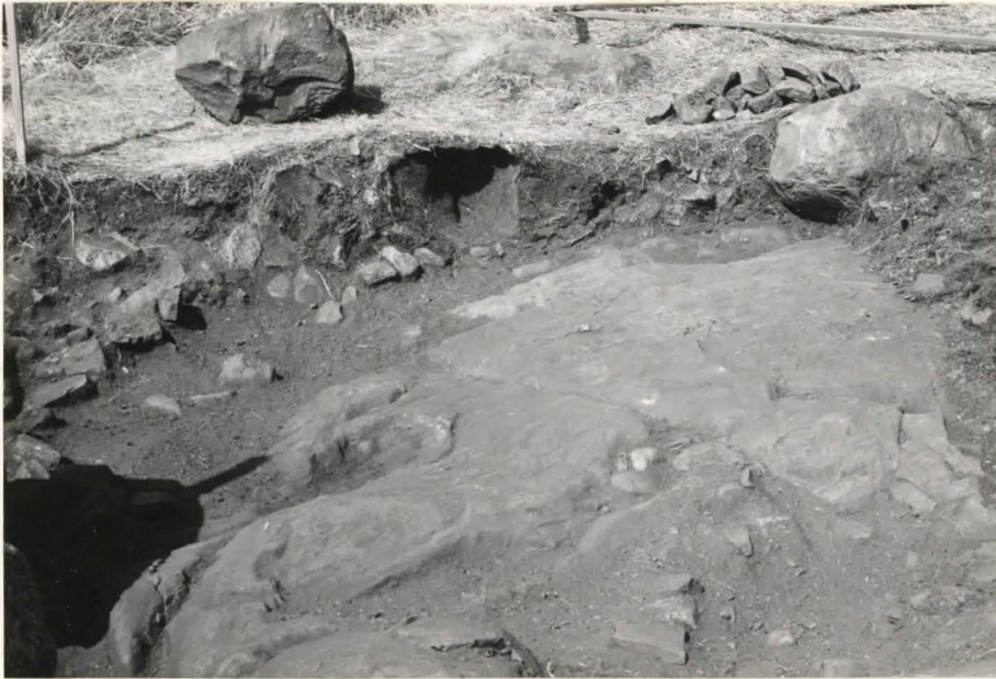
15. Ruutu B:+3, taso 6, etelästä kuvattuna.