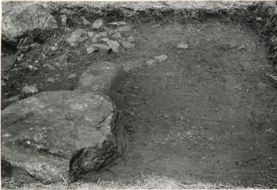
1. Ruutu A:+3, taso 1, etelästä kuvattuna.