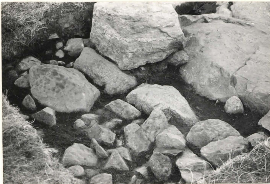
16. Ruutu A:+3, taso 7, koillisesta kuvattuna.