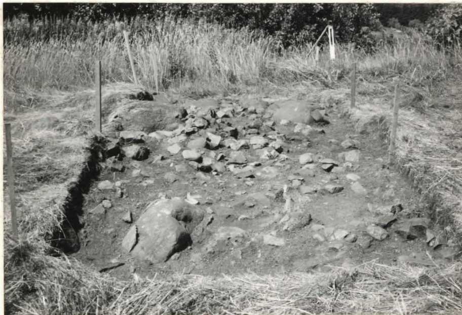
2. Ruutu B:+1, taso 1, etelästä kuvattuna. Takana ruudut B:+2 ja B:+3.