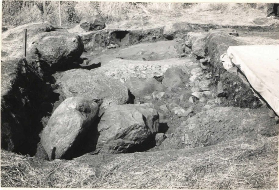
17. Ruudut B:+1 ja B:+2, taso 7, etelästä kuvattuna. Taaimpana ruutu B:+3, taso 6.