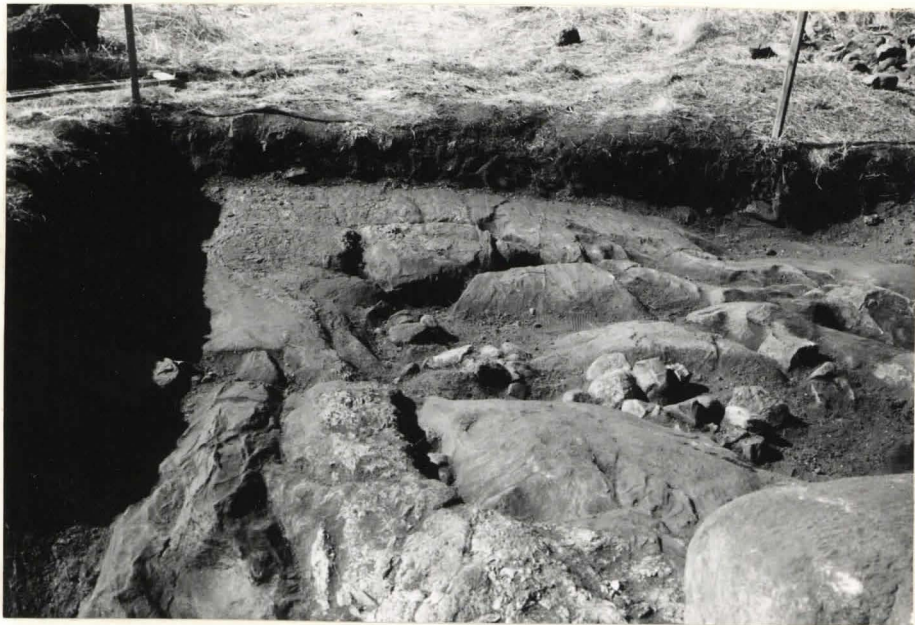
18. Ruutu C:+2, taso 8, idästä kuvattuna.