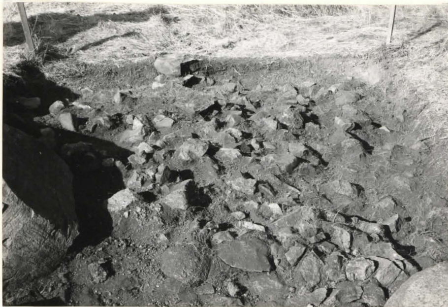
8. Ruutu C:+3, taso 2, idästä kuvattuna.