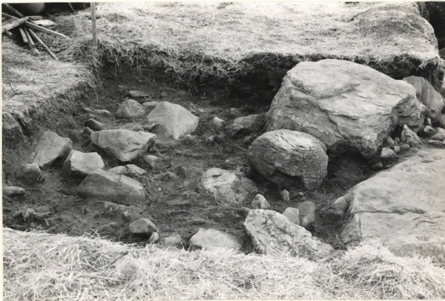
10. Ruutu A:+3, taso 4, pohjois-luoteesta kuvattuna.