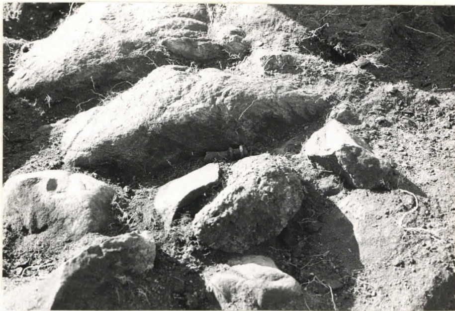
14. Löytö n:o 60, ruudun C:+3 itälaita, taso 5, pohjoisesta kuvattuna.