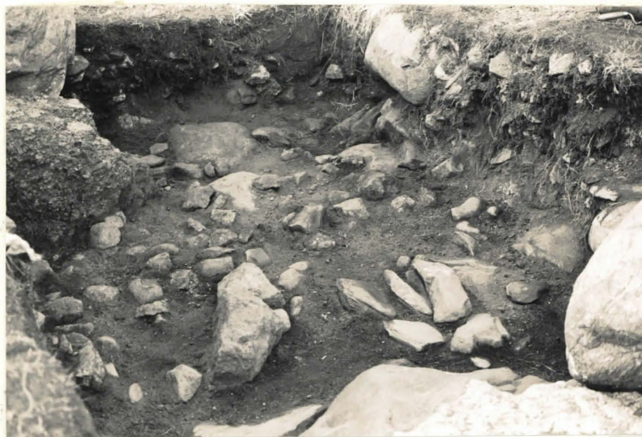
22. Ruutu B:+1, taso 11, koillisesta kuvattuna.