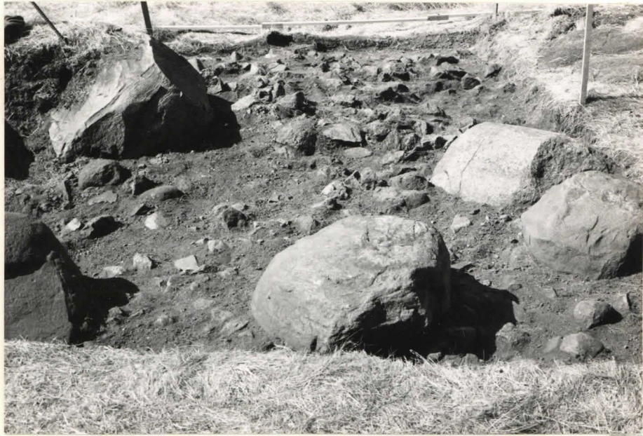
9. Ruutu B:+3, taso 3, idästä kuvattuna.