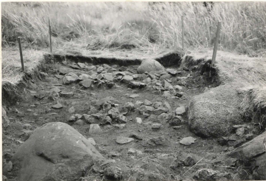
5. Ruudut B:+2 ja B:+1, taso 2, pohjoisesta kuvattuna.