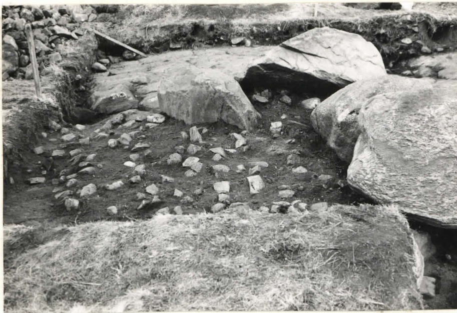
12. Ruutu C:+2, taso 5, etelästä kuvattuna.