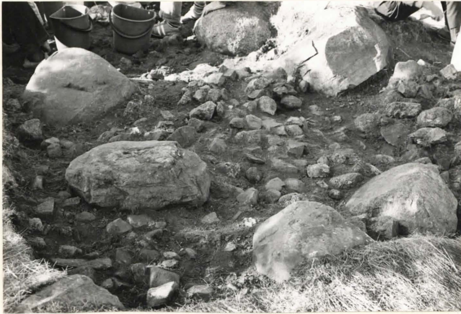
7. Ruutu B:+3, taso2, koillisesta kuvattuna.