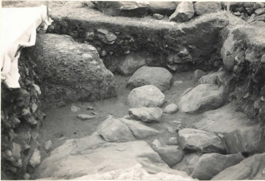
23. Ruutu B:+1, taso 14, pohjoisesta kuvattuna.