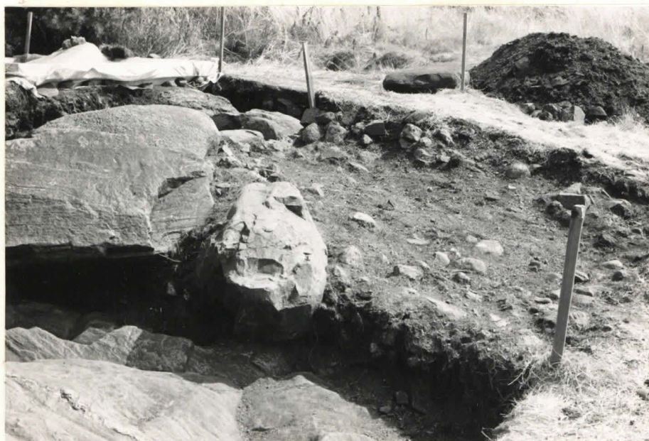
3. Ruutu C:+2, taso 1, pohjois-luoteesta kuvattuna.