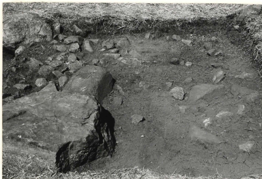
4. Ruutu A:+3, taso 2, etelästä kuvattuna.