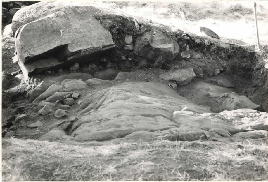
13. Ruutu C:+3, taso 5, pohjoisesta kuvattuna.