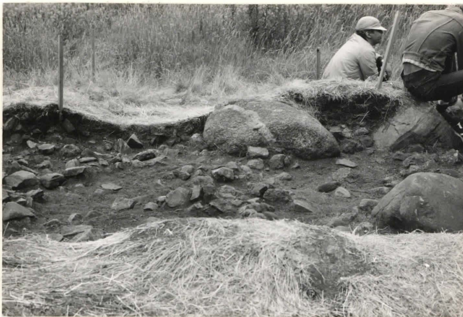
6. Ruutu B:+ 2, taso 2, idästä kuvattuna.