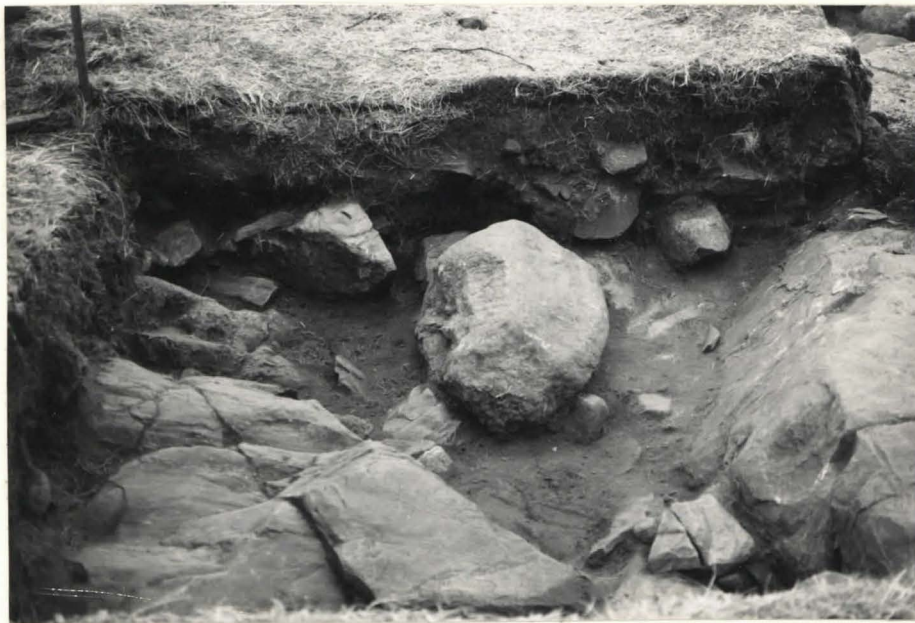
21. Ruutu A:+3, taso 11, pohjoisesta kuvattuna.