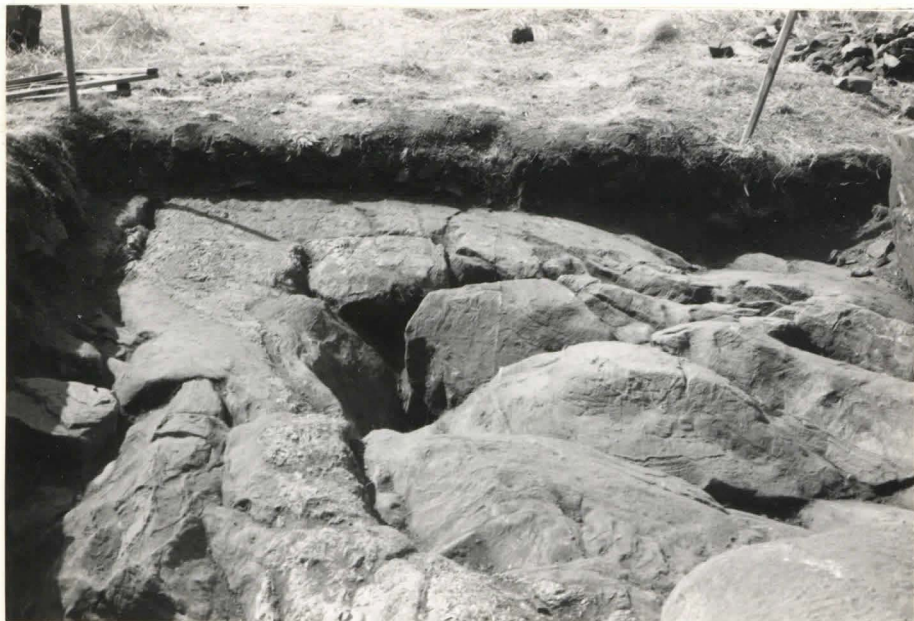
19. Ruutu C:+2, taso 9, idästä kuvattuna.