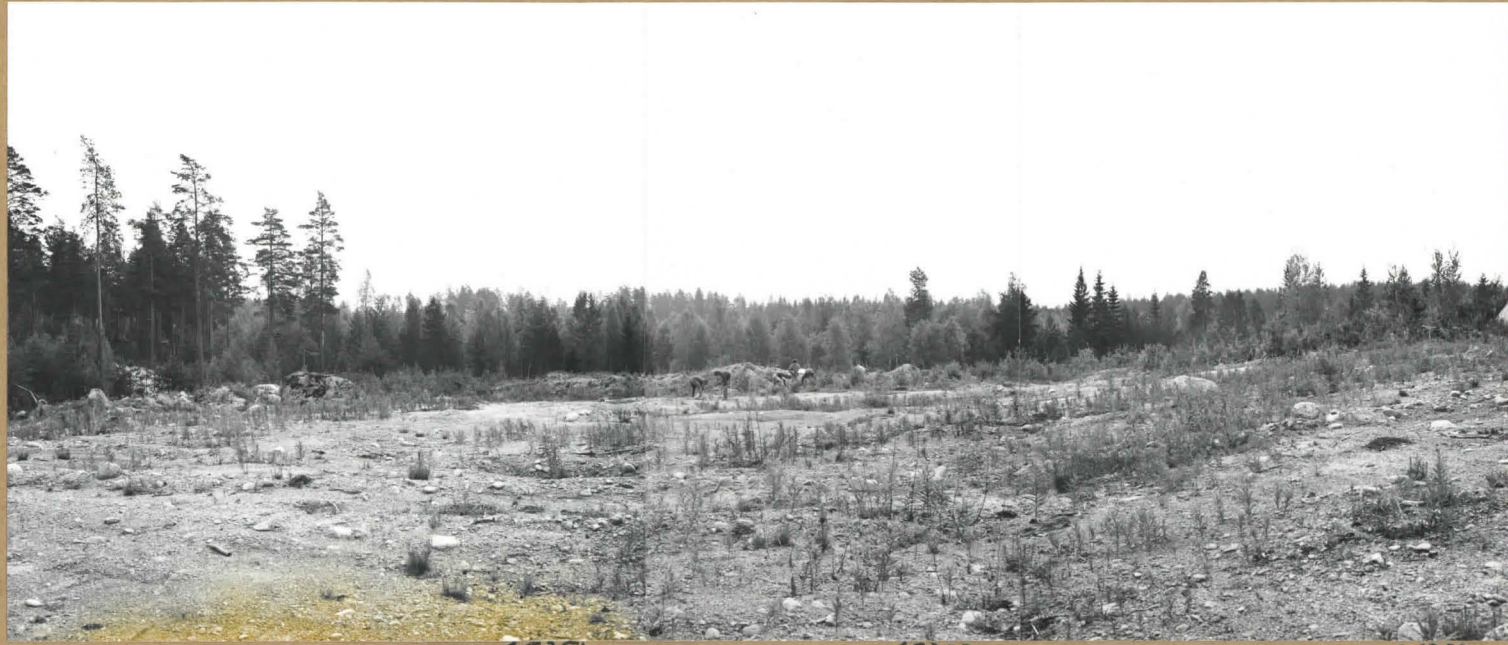
Panoraama alueesta pohjoisesta nähtynä. Asuinpaikka alkaa keskivaiheilla näkyvistä maakasoista ja jatkuu taustalla suon reunassa oleviin puihin. Koekuoppia tehdään kuoritulla alueella, missä ei havaittu merkkejä asuinpaikasta.