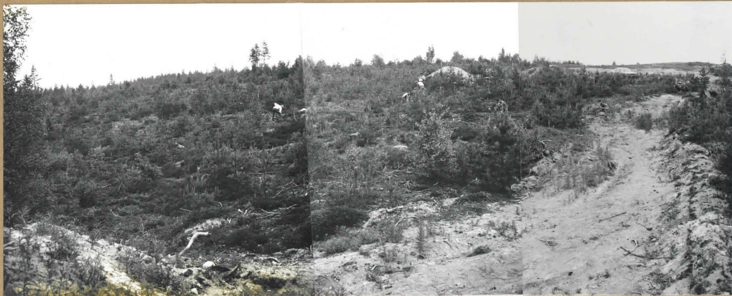
Panoraama etelästä länteen ja pohjoiseen. Asuinpaikka rajoittuu kuvan keskivaiheilla olevien auton ja hiekkakasan sekä kuvanottoaikan välille kuva-alan laidasta laitaan.