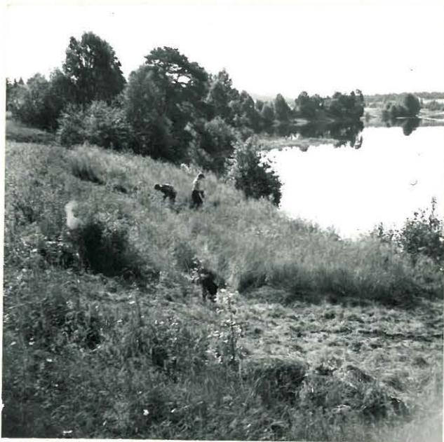
PELTOLAN KOEJAT POHJOI- SESTA VALOK.