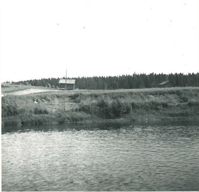
PELTOLAN KOEJEN PAIKKA VALOK. JOELTA; LÄNNESTÄ.