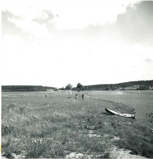
REVONNIEMEN ALUE ETELÄSTÄ. MIEHET LÖYTÖPAIKKOJEN KOHDILLA.