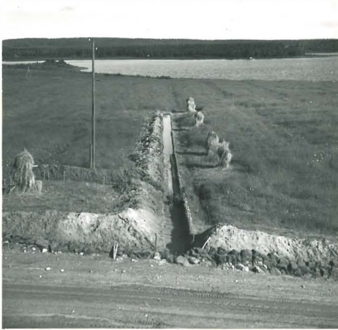
ALILAN ISO KOEJOJA (VEDEIN TÄYT- TÄMÄNÄ) VALOK. ETELÄSTÄ LADON KATOLTA. TAUST. REVONLAHTI.