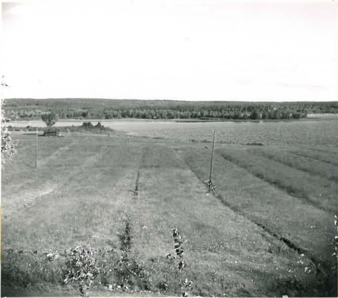
VAS. TUOKKILAN PALSTA KUM- PAREELLA, MISSÄ PIHLAJA JA LATO. TAUST. REVONLAHTI.