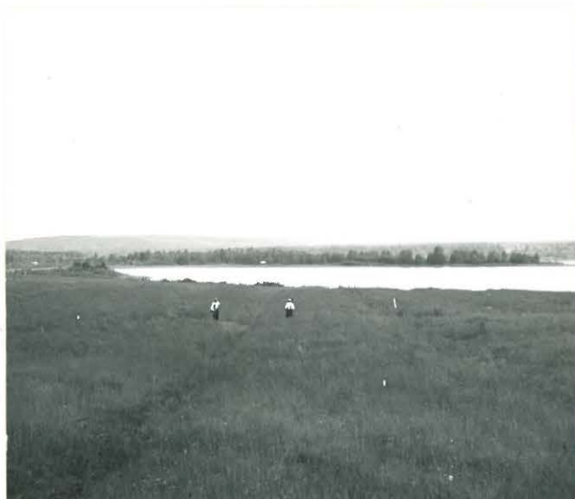
ALILAN RANTAPELTO; HIÖINKIVEN LÖYTÖPAIKKA KAAKOSTA. REVONLAHTI TAUST.