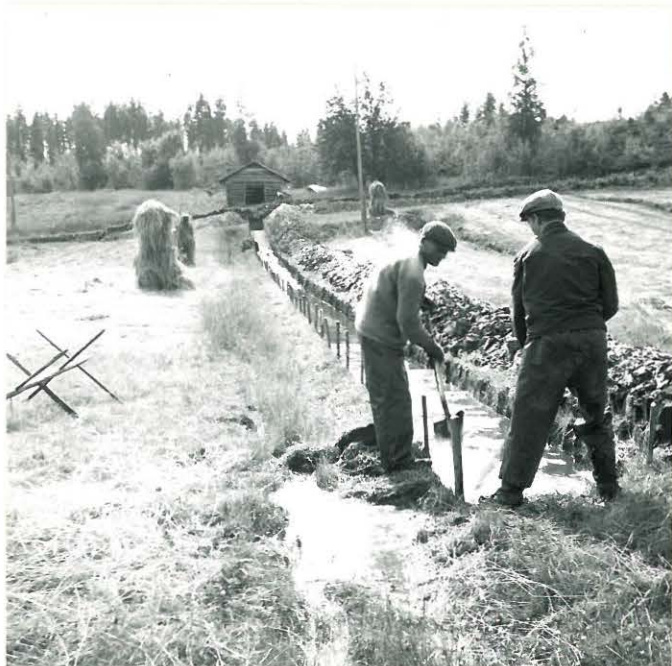
SATEISEN KESÄN SATOA. MIEHET YRITTÄVÄT POISTAA VETTÄ ALILAN ISOSTA KOEJASTA ENNEN TÄYTTÖÄ. (VALOK. N. POHJOISESTA.)