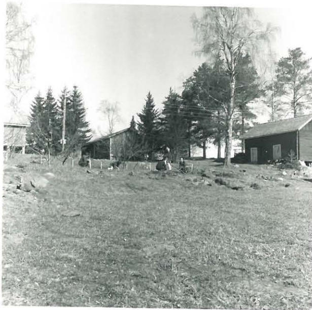
Kuva 2. Koekivänsalvella suunnitteen kaakosta. Taustalla Ohlolan ulko rakennuksia. jäätalokki kuvan vasemman laidan ulkopuolella. - F. 33770