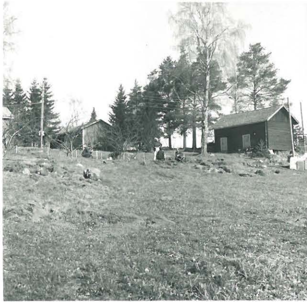
Kuva 1. Koekivänsalvella suunnitteen kaakosta. Taustalla Ohlolan ulko rakennuksia. - F. 33769