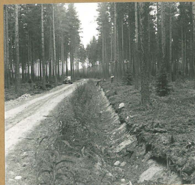
f 56267 Kuva 3. Tien reunoille tehdyistä koekuopista tuli melko runsaasti kivikaut. asuinpaikkaan viittaavaa aineistoa, S.