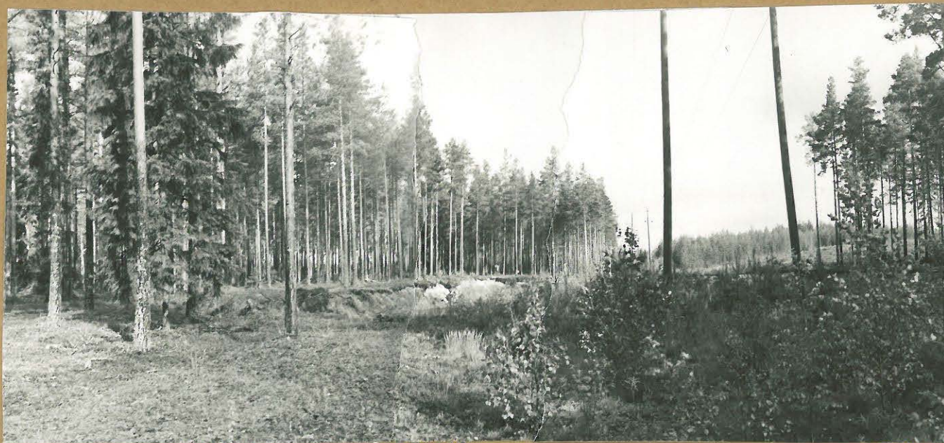
f 56262 f 56263 f 56264 Kuva 1. Lappforsin hiekkakuoppaa nähtynä kaakosta. Länsireuna tutkittiin koeojituksella