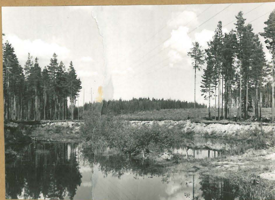
f 56265 f 56266 Kuva 2. Hiekkakuopan pohjois- ja koillisreunoja, joille tehtiin koeojat. SW.