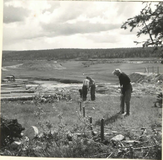
Siikaniemi 6. Koeosa paalutettuna. Kuva otettu metsän reunasta suuntaan SW