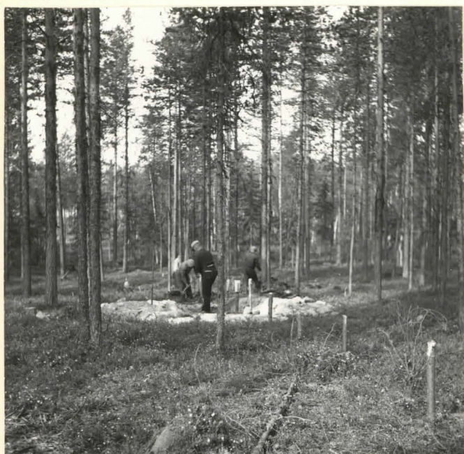
Siikaniemi 7 Koeoja suuntaan WSW