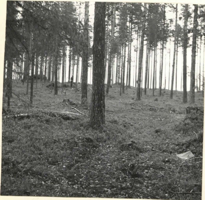
Siikaniemi 7. Alue jängän reunasta suuntaan NE