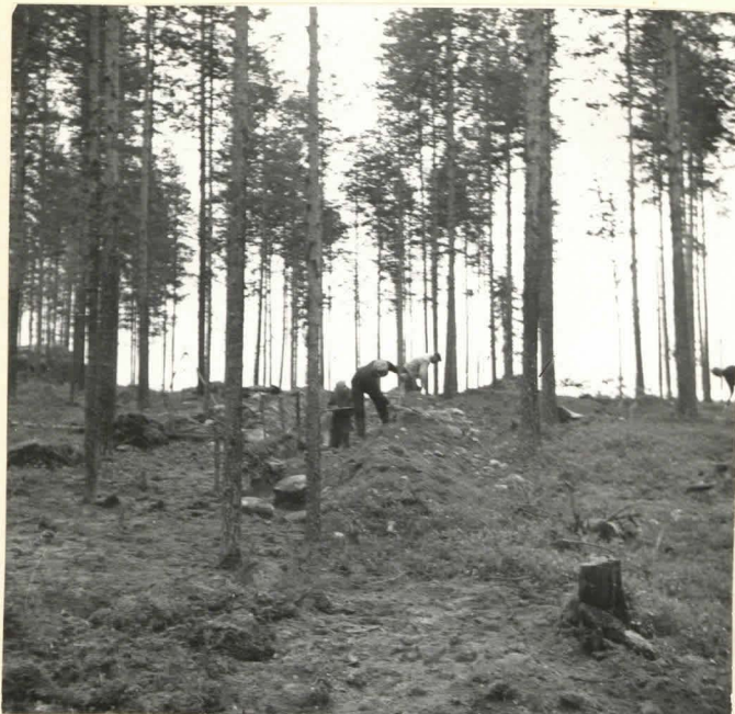
Siikaniemi 7. Koeoja suuntaan NE