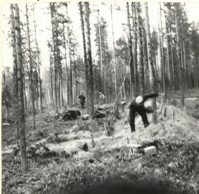
Siikaniemi 7 Poikkioja K-U suuntaan NW.