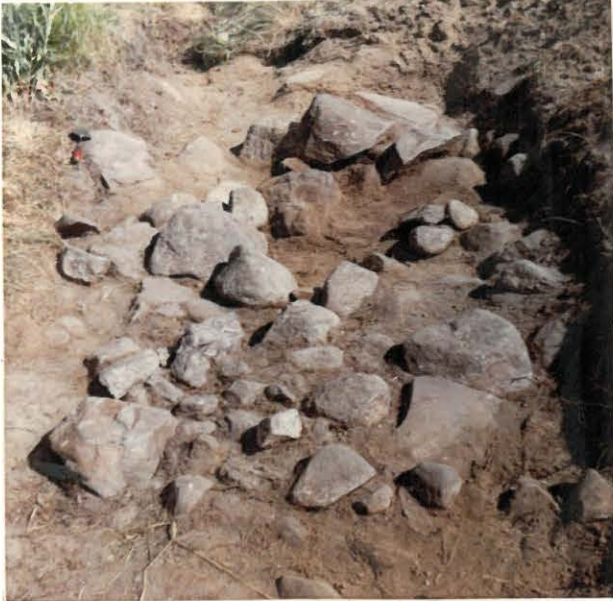
4. Kiveys koeojan länsipäässä, kuvattu lännestä käsin. Kivien joukossa oli punertavia hiekkakivilaakoja.