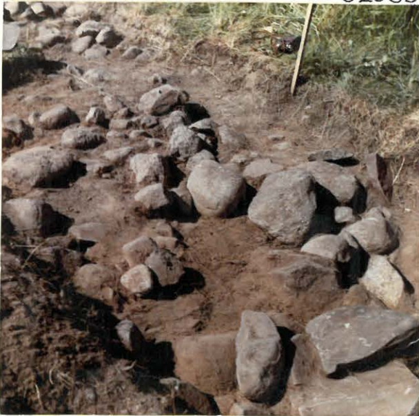
6. Koeojan kiveystä kaakosta päin kuvattuna. Huom. erikoisesti punertavat hiekkakivilaakat.