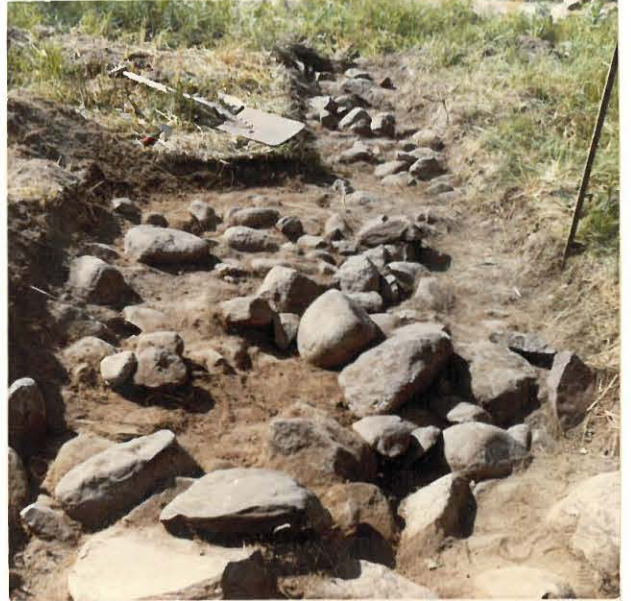
5. Koeojan länsipäättä kuvattuna idästä käsin. Kuten kuvasta näkyy, kiveys alkoi heti tietä reunustavasta kivipenkereestä 1.-aidasta (sijaitsee aivan taustalla näkyvän ruohikon takana).