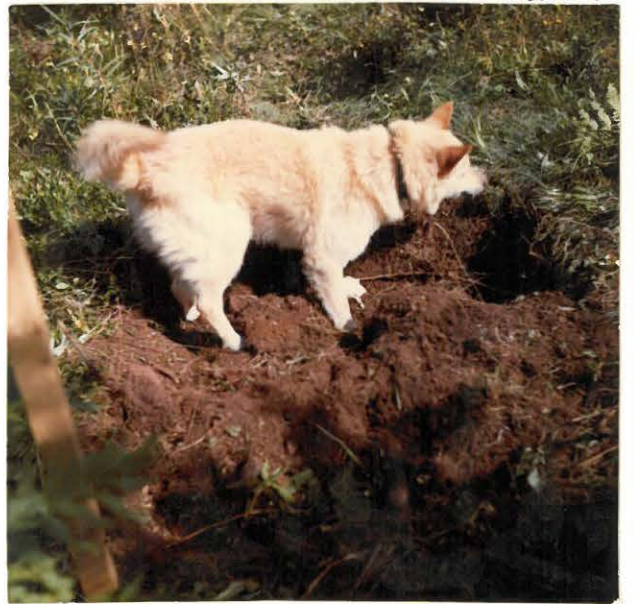
7. "Apulaiskaivaja" Ressu. Siellä, missä kiveystä ei ollut, oli maaturpeen alla tämän näköistä. Koeojan keskikohtaa lännestä päin kuvattuna.