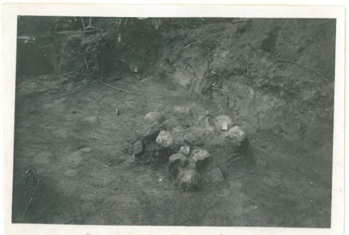
Kivi II Pajarin aminpaikalla.