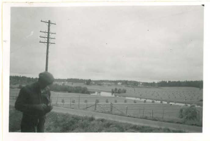
Näköala Pajarin aminpaikelta lounaaseen.