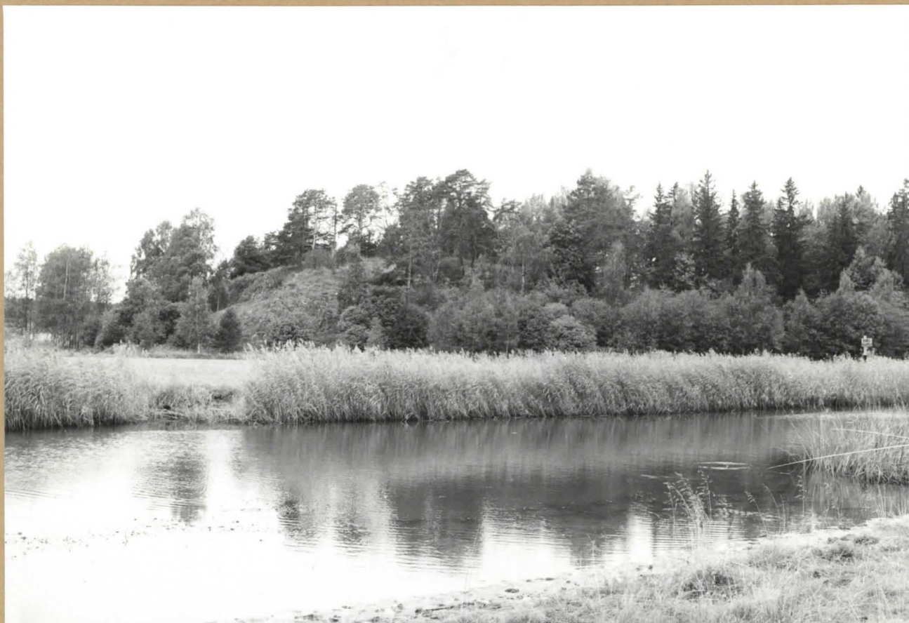
Linnavuoren eteläosa (päälinna) kuvattu Sipoonjoen itäpuolelta itäkaakosta kuvattuna.