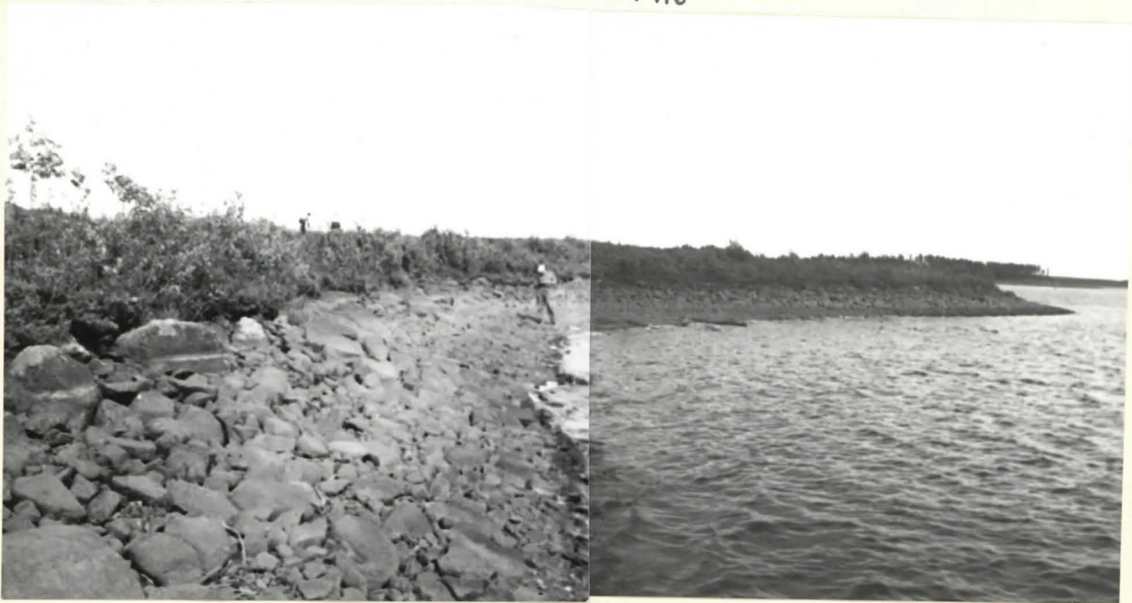
2. SOTASAAREN KIVIKKOISTA RANTAA