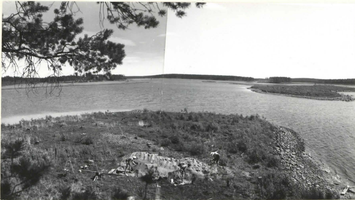
5. YLEISNÄKYMÄ SAAREN KÄRJESTÄ, PUUSTA KATSOEN VAAKITUSKONEESTA VASEMMALLE TERVAHAUTA.