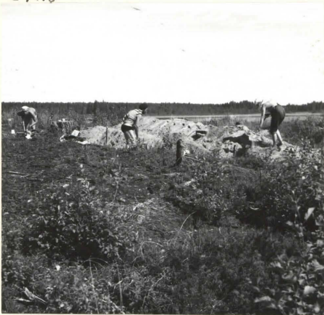
4. KAIVAUS KÄYNNISSÄ