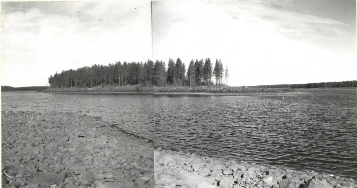
1. SOTASAAREN PÄÄ KAAKOSTA