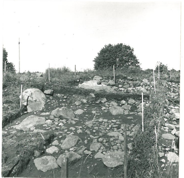
5. F. 46987