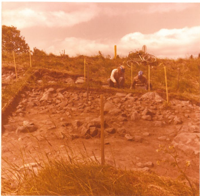
13. F. 46997 Röykkiö, ruudut d -7, e -7, f -7, d -8 e -8, f -8, taso 2 Kuvattu idästä