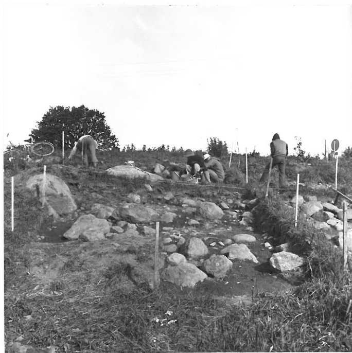
Työkuva, kuvattu lännestä