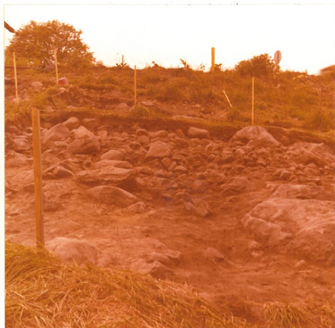
15. F. 46999 Röykkiö, ruudut d -8, e -8, f -8, taso 2 Kuvattu idästä