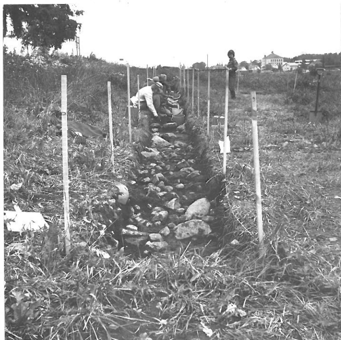
6. Koesja A, kuvattu kaakosta