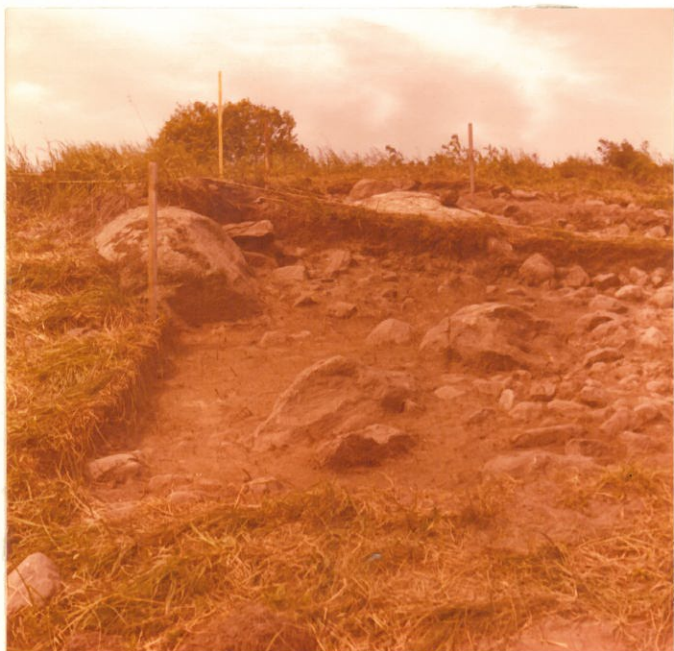
17. Rökkiö, ruudut e-5, f-5 F. 47001 taso 3 kuvattu koillisesta