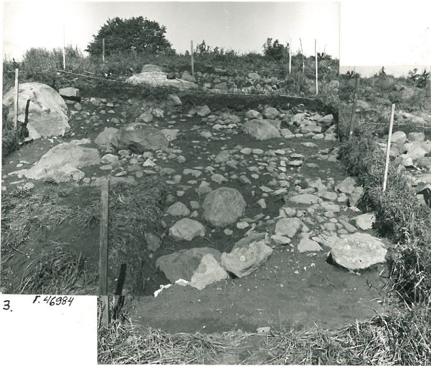
3. F. 46984