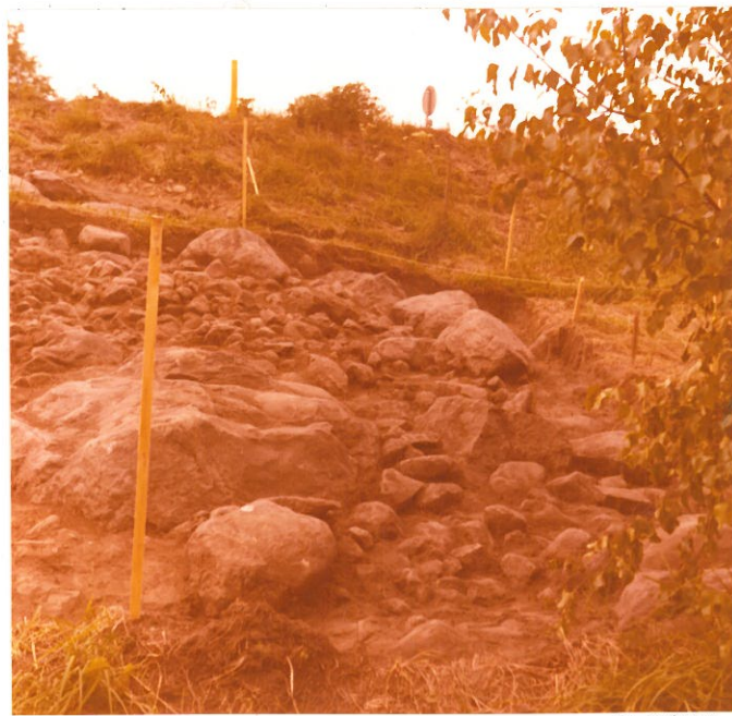
16. F. 47000 Röykkiö, ruudut d -9, e -9, f -9, taso 2 Kuvattu idästä