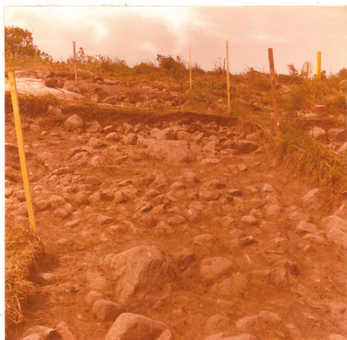
18. Rökkiö, ruudut d-6, e-6, f-6 F. 47002 taso 3 Kuvattu koillisesta.