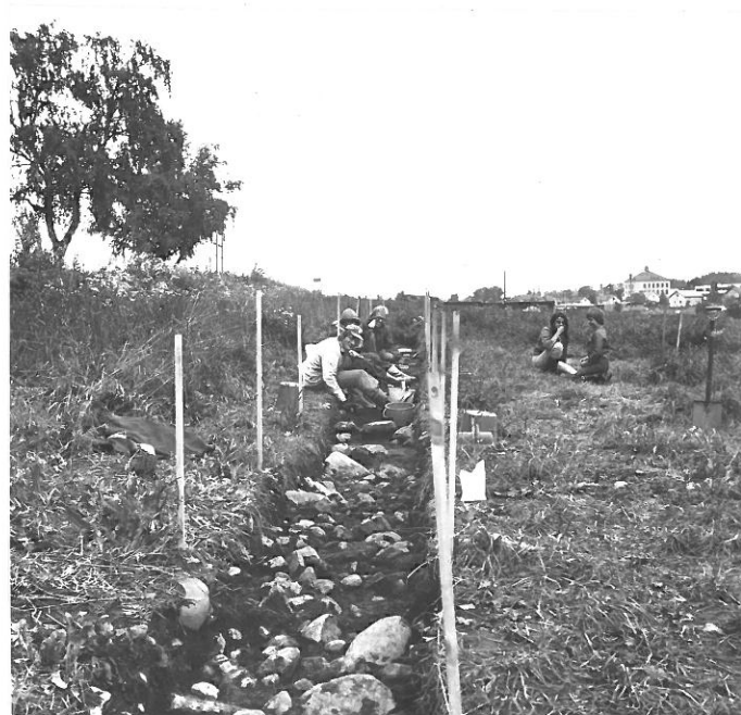
7. Koesja A, kuvattu kaakosta