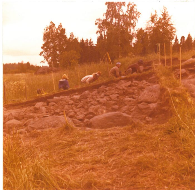
14. F. 46998 Röykkiö, ruudut f -7, -8, -9, taso 2 Kuvattu etelästä