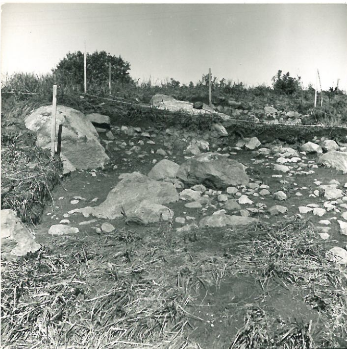
4. F. 46986