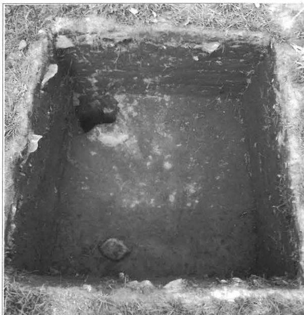
Kuva 9 / F. 140219 Koekuoppa 500/219, kuvattu etelästä.