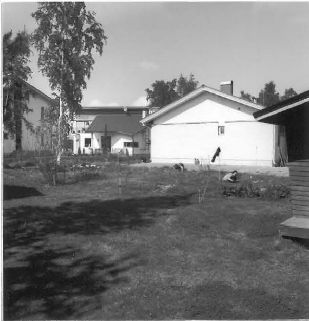
Kuva 1 / F. 140211

Tutkimusalueen eteläosaa, keskellä koekuoppalinja ja fontille vuonna 2004 valmistuneen omakotitalon eteläpääty, oikealla Toivolan tilan aittarakennus, taustalla Kuihamonkujan uusia pientaloja, kuvattu etelästä.