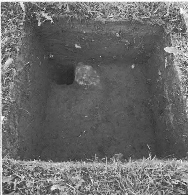
Kuva 7 / F. 140217 Koekuoppa 524/202, kuvattu etelästä.