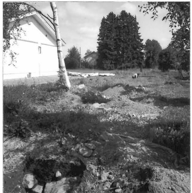
Kuva 4 / F. 140214

Tutkimusalueen itäosaa, keskellä koekuoppalinja, oikealla vuonna 2004 valmistuneen omakotitalon itäpuoli, taustalla Toivolan tilan ulkorakennuksia, kuvattu itäkoillisesta Loimalankadulta.