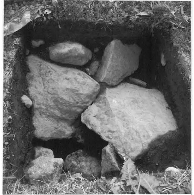
Kuva 6 / F. 140216 Koekuopan 499/200 kiviä, kuvattu etelästä.