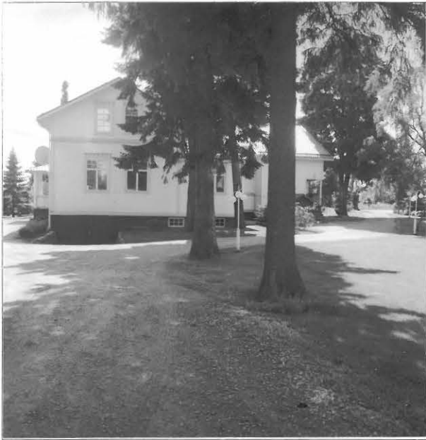
Kuva 5 / F. 140215 Toivolan tilan päärakennuksen pohjoispääty, jonka itäpuolelta on löytynyt rautakautisia aseita (KM 5351:54) ja länsipuolelta (KM 6066:1-2), kuvattu pohjoisesta.