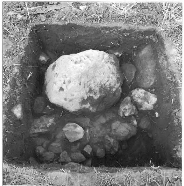
Kuva 8 / F. 140218 Koekuoppa 499/205, kuvattu etelästä.