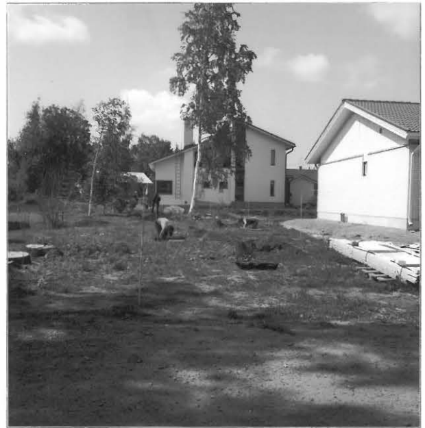
Kuva 2 / F. 140212

Tutkimusalueen eteläosaa, keskellä koekuoppalinja ja fontille vuonna 2004 valmistuneen omakotitalon eteläpääty, oikealla Toivolan tilan aittarakennus, taustalla Kuihamonkujan uusia pientaloja, kuvattu etelästä.