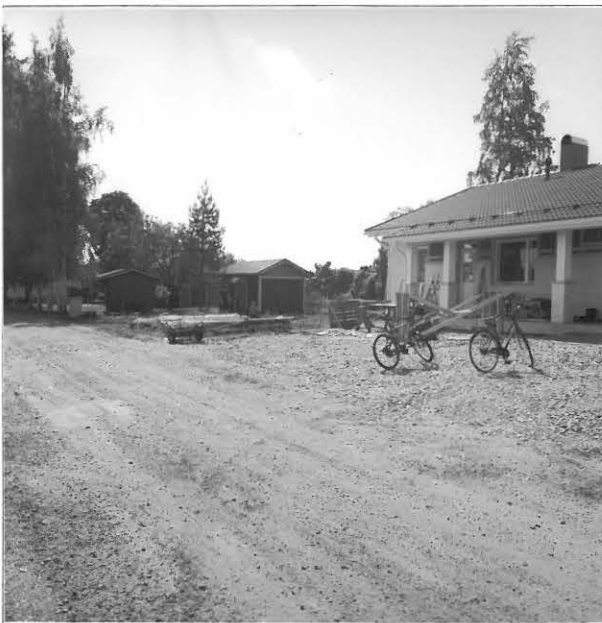
Kuva 3 / F. 140213

Tutkimusalueen eteläosaa, keskellä koekuoppalinja, oikealla fontille vuonna 2004 valmistuneen omakotitalon eteläpääty, vasemmalla Räätikkipuistossa sijaitseva Kässälän vanhan saunan paikka, taustalla Kuihamonkujan eteläisempi uusi pientalo, kuvattu idästä.