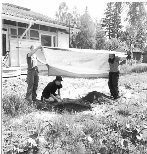
Kuva 10 / F. 140220 Jan-Erik Nyman kaivaa koekuoppaa 518/205, vasem- malla Ulrika Köngäs ja oikealla Nora Salonen, taus- talla vuonna 2004 valmistuneen omakotitalon länsi- seinää, kuvattu pohjoisluoteesta.