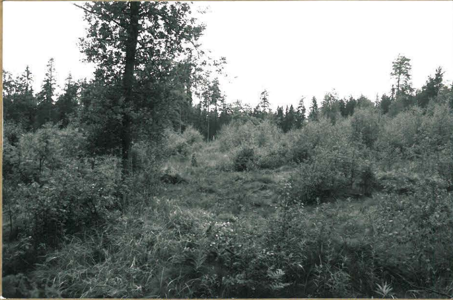
104818 VESIJOHTOLINJA RAIVATTUNA. KUVATU KARTHUNQJALTA LUOTEESEEN.