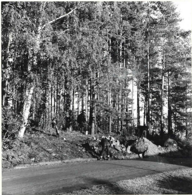
② KAIVAUS KÄYNNISSÄ f. 35366