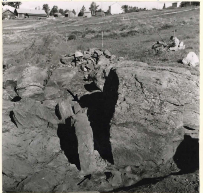
F. 25132 →

23. Suuren maakiven eteläpuolelta idästä jään. Maakiven ja vieressä olevan pystykkaan väliin täytettiin runsaasti liuta ja savirhampolija.