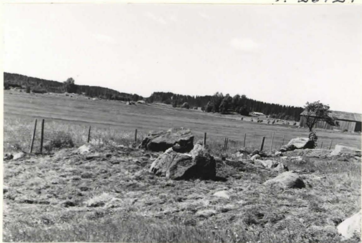
12. Kumpun 20 kaivauksen jälkeen ennalleen täytettynä koillisesta kuvattuna.