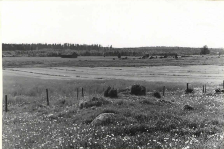
1. Kumpu 20 koillisesta.