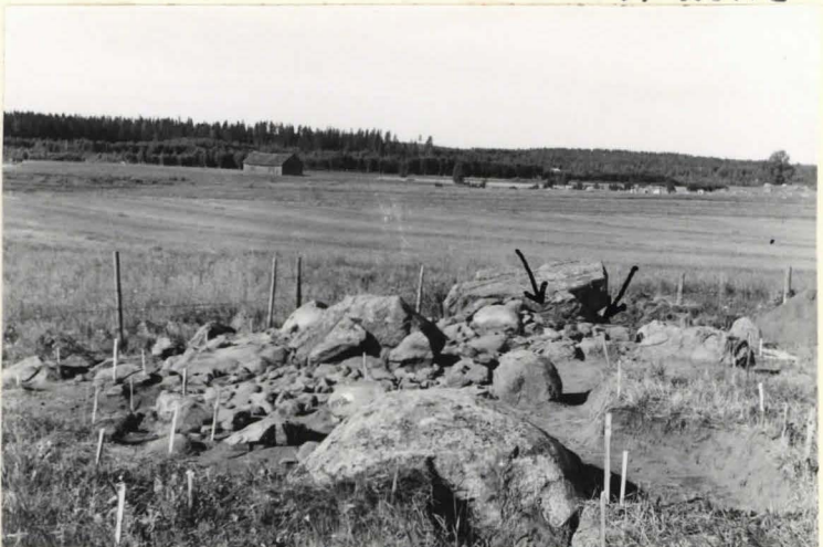
9. Kunnan 20 koillisesta. Kätäjapensaat on poistettu. Punsaimmat löydöt tulivat ruokien osoittamasta kohdasta.