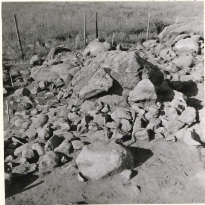
11. Kumpun 20 kerkeästä pohjoisesta kuvattuna.