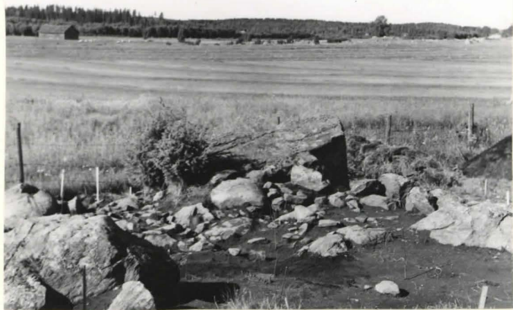
6. Kunnan 20 lounaispää kiveyksen paljastamisen jälkeen koillisesta kuvattuna.