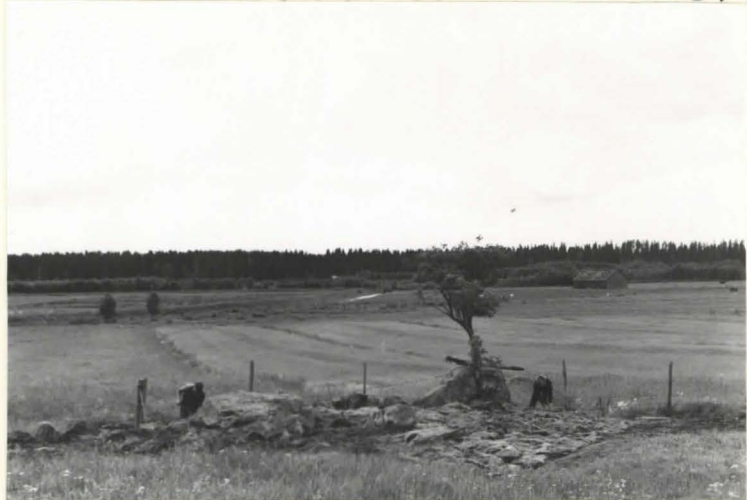
24. Kumpu 21 ennalleen peitettynä kauruksen jälkeen pohjoisesta päin.