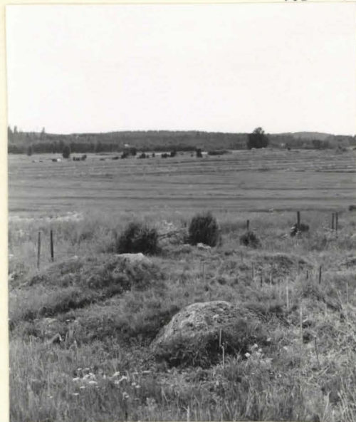
5. Kumpu 20 koillisesta pöytä- tuna.