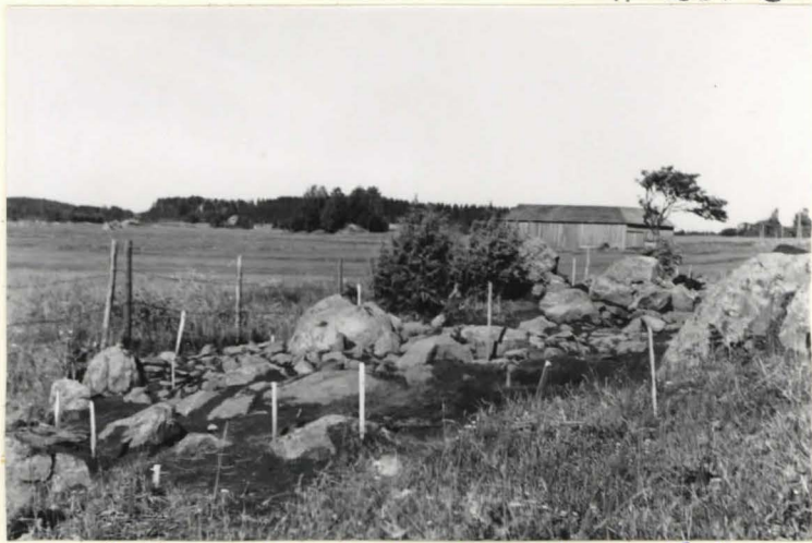
7. Kunnan 20 idästä kiveyksen kultua esiin.