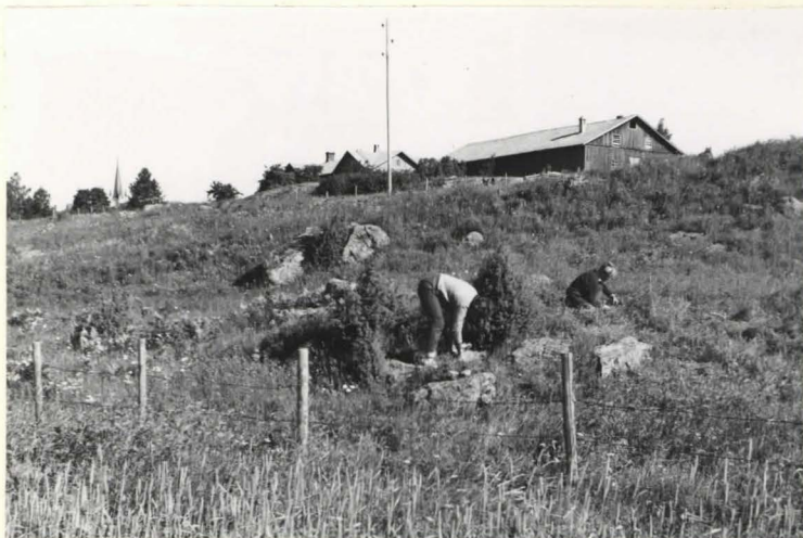
28. Kumpun 19 kouruun kaurus kaurussa. Kuvattu etelästä länteen.