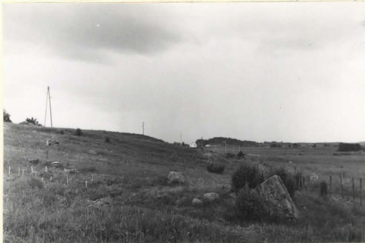
3. Kumpu 20 lännestä.