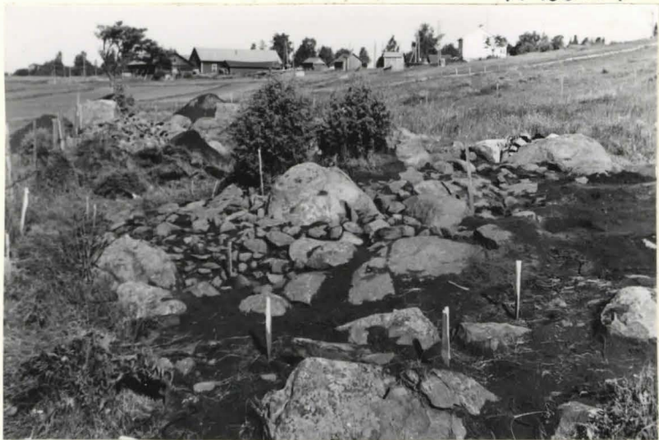
8. Sama koekosta. Kätäjapensaat peittävät suurimman maakin näkyvistä.