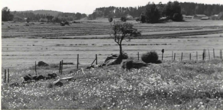
14. Kumpu 21 koillisesta jäin ennen kaivauksia.