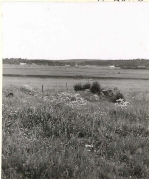
4. Kumpu 20 luoteesta.