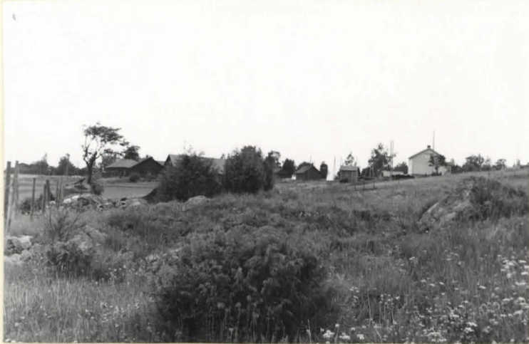
2. Kumpu 20 idästä.