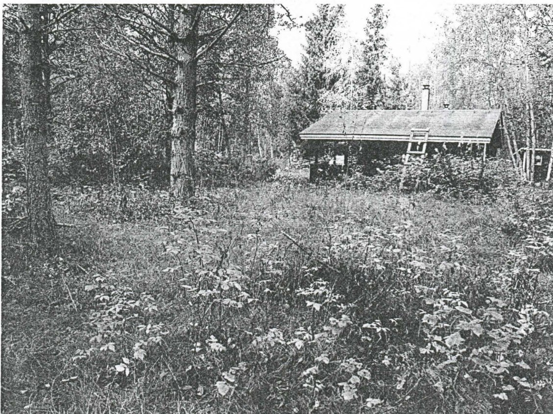
Kuva 4. Yleiskuva koekuopitetusta alueesta mökin eteläpuolella. Suunniteltu kaivonpaikka kuvan keskellä. Kuvattu kaakosta.

Tutkimuksissa ei tehty esihistorialliselle ajalle ajoittuvia löytöjä tai havaittu muita merkkejä esihistoriallisesta muinaisjäännöksestä. Historialliselle ajalle ajoitettavat löydöt tehtiin kesämökin eteläpuolisista koekuopista. Varsinkin koekuoppa 1:stä tehtiin useita historialliseen aikaan ajoittuvia löytöjä. Selvää kulttuurikerrosta ei havaittu yhdestäkään koekuopasta. Koekuoppa 1 sijaitsi matalahkon röykkiön itäpuolella aivan mökin pihamaan laidassa. Historialliselle ajalle ajoittuvia löytöjä tehtiin koekuopista numero 1, 2, 3 ja 4 sekä koepistosta 1. Koekuoppien 1-4 ympäristö on ollut peltomaana historiallisella ajalla. Näissä kuopissa havaittiin peltokerros noin 5-30 cm syvyydessä. Koekuopat 5-12 sijaitsivat vesijättömaalla. Koekuopituksen yhteydessä kaivettiin myös alueella sijaitsevan röykkiön eteläreunaan koekuoppa (numero 13), josta ei tehty löytöjä tai havaintoa kulttuurikerroksesta.