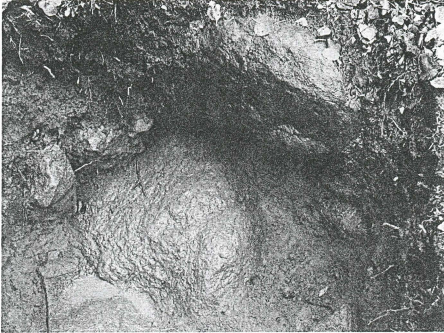
Kuva 3. Koekuoppa 13. pohja. Koekuopan pohjalla oli suuria kiviä. Kuvan ylälaidassa näkyvä suuri kivi liittyy todennäköisesti läheiseen röykkiöön. Kuvattu kaakosta.

0-16 cm Pintamulta/ -turvekerros. 16-33 cm Soransekainen hiekka 33-51 cm Soransekainen hiekka jossa savilinssejä. Ei löytöjä.