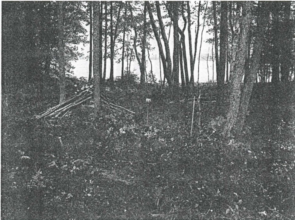
Kuva 1. Yleiskuva kaivausalueesta suunnitellun saunarakennuksen kohdalta. Taustalla Vanajavesi. Kuvattu lounaasta.