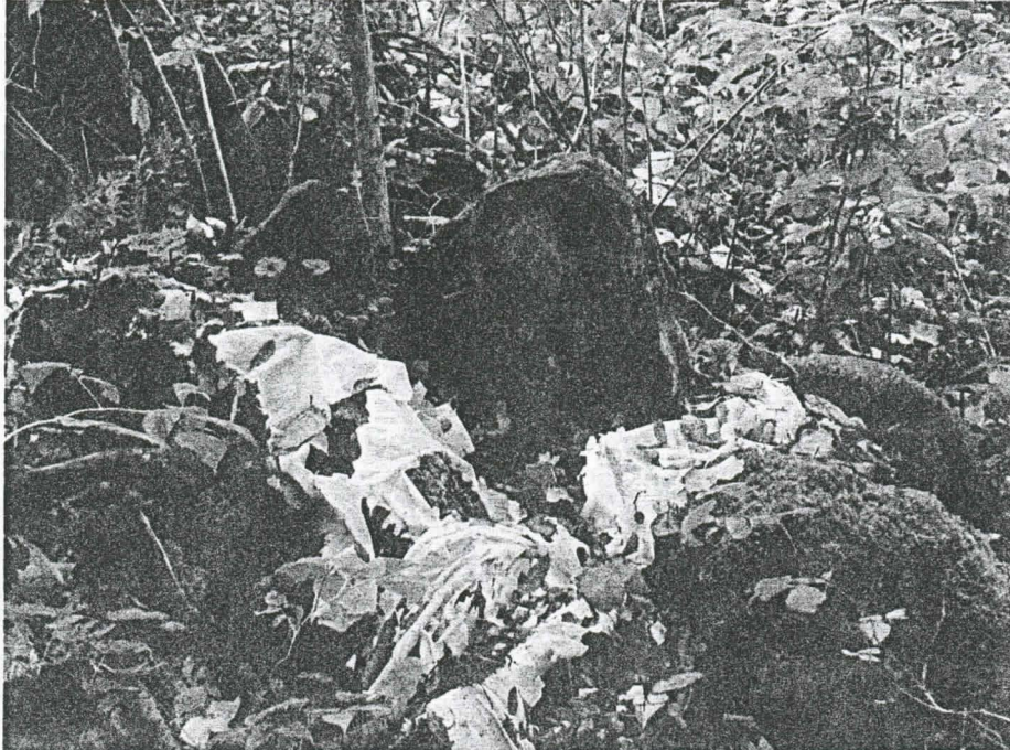
Kuva 2. Rajakivi 11 rannan tuntumassa. Valkoiset muovinpalat kiven juurella ovat ilmakuvausessa käytetyn kohdistusristin jäänteitä. Kuvattu etelästä.

Koekuoppien sijainti laskettiin apulinjalta mittattujen kolmioiden avulla. Korkeusmittaukset suoritettiin vaaituskoneella. Vaaituksia laskettaessa on käytetty lähtökohtana Vanajavedenpinnan korkeutta 8.10.2003, joka oli 78,90 m mpy.