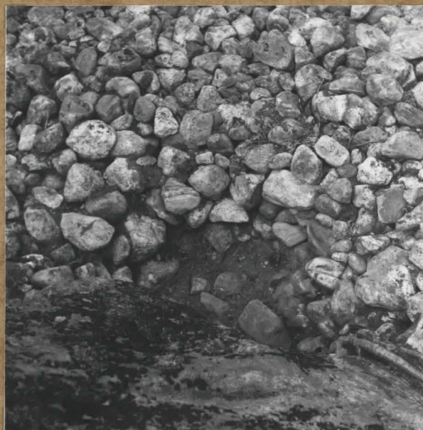
f. 84757 Gropen söderom hyddbottnen efter att de inrasade stenarna avlägsnats (nivå 2.).