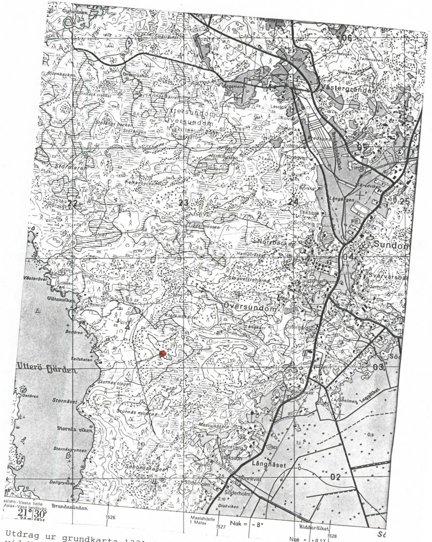
Utdrag ur grundkarta 1331 08 VASKILUOTO/1981. Utgrävningsplatsen vid Västersvägen S, koord x= 6991 40, y= 1526 35, z= , utmärkt med rött på kartan (●).