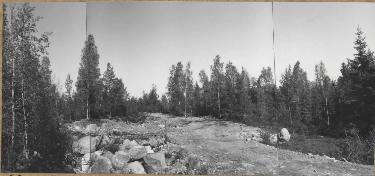
f. 84749-84751 Panoramabild över forskningsområdet vid Västersvägen-S. Hydd- botnen vid den längsta björken strax till höger om bildens mitt- punkt. Från väster.