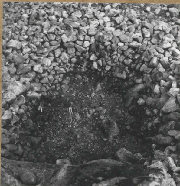
f. 84756 Hyddbottnens inre efter att de inrasade stenarna avlägsnats (nivå 2.).