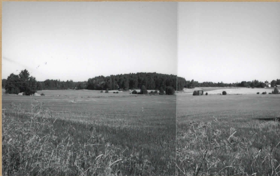
neq. 136528-29 Hiidenmäki, kuvattu eteläkaakosta