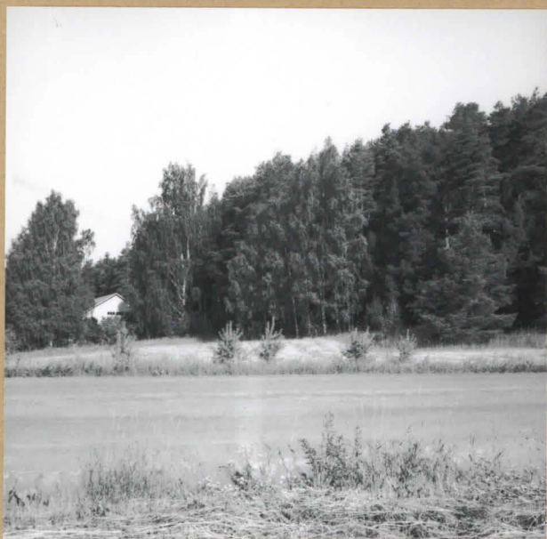
neq. 136530 Tutkimusalue talousrakennuksen oikealla puolella pellon jänne- rajalla, kuvattu kaakosta