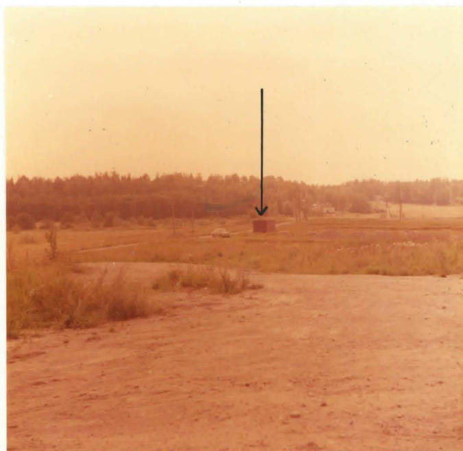
Kaivausalue I, pohjois-etelä suuntainen koeaja. Kuvattu kaakosta.