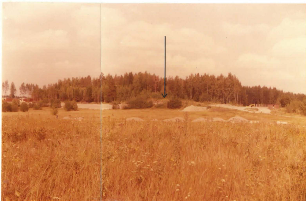
yleiskuva. Kaivausalue II nuolen osoittamassa kohdassa. Kuvattu etelästä.